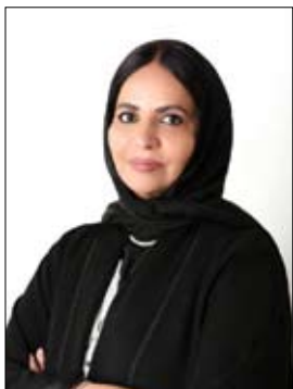
العميمي عن الجوائز الفكرية والأدبية وحضورها الطافي