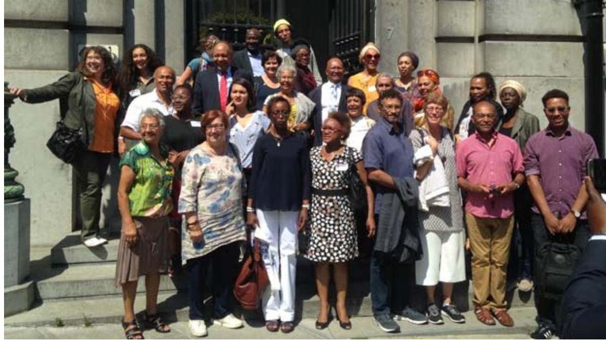
عندما تبني مجلس الشيوخ قرارا يعترف بالفصل العنصري ضدهم