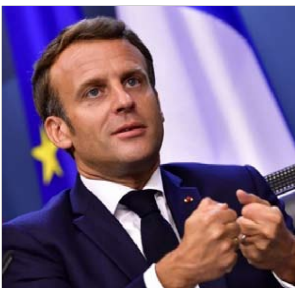
ماكرون تستهويه صحافة المشاهير

ولادة "جيل الألف يورو". ظهوره، مثل السطوة التي تمارس على جزء من صحافة المشاهير أسفل وما وراء جبال الألب، يسحر. إن قرب "ميمي" مارشان، إمبراطورة صحافة المشاهير، من الرئيس ماكرون، يؤكد هذا الاتجاه الثقيل الذي، لئن كان قديماً، فقد ارتفع بشكل مذهل بفضل الاستخدامات القادمة من شركة برلسكوني. منذ عام 2007، سعى المرشحون الرئاسيون إلى أن يكونوا على الصفحة الأولى لأخبار الصحف بدلاً من التفاعل مع القوى الاجتماعية في البلاد... لقد اندمج المستهلك والنخب، في نهاية فترته الرئاسية، وقع نيكولا ساركوزي فريسة عدة قضايا قانونية، كما شبهته بـ"رغبته في العودة إلى الساحة السياسية، ونتيجة لذلك نتحدث عن "برلسكوتة". لقد استطاع نيكولا ساركوزي الاعتماد على أصدقاء يمتلكون وسائل إعلام، ولكنه ليس صاحب وسائل إعلام، إن ما يميزه عن برلسكوني، انه ليس سيد التدفقات. يعمل برلسكوني وترامب بنفس الطريقة: جملة، تعبير جدي يركز عليهما فيجبان المناقشات التي الحياة ما بدا أنه توافق وإجماع في الحياة السياسية والاجتماعية حتى ذلك الحين. دعوى التحدث لأغلبية صامتة، فهما يحددان شروط النقاش، حتى أن لم يكن هذا الأخير ذا أهمية كبرى أو لم يكن حاسماً بالنسبة للبلد. وأدى وصول تويتير إلى زيادة هيجان المناقشات التي بدأت. واليوم، يحتاج المرء فقط إلى النظر إلى الشبكة الاجتماعية المعنية ليرى أن الرموز الترامبية قد طبعت القوس السياسي بأهمل.