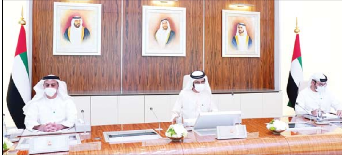
محمد بن راشد خلال ترؤسه اجتماع مجلس الوزراء

مجلس الوزراء يعتمد عدة قرارات وتعديلات وأنظمة وإصلاحات تشريعية