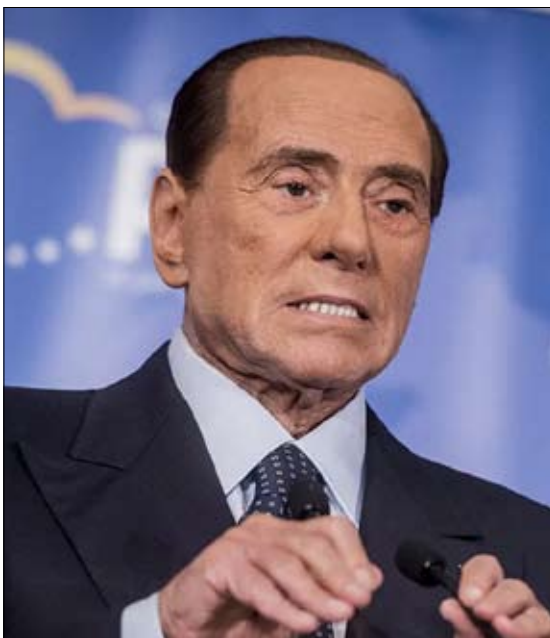
برلسكوني السياسة بطريفة أخرى.

لم يطبع الرجلان بلديهما فقط وإنما أثرا أيضاً على السياسة الفرنسية وغيراً جميع رموزها الفرنسية. اثنان من أصحاب المليارات، يجسدان الرأسمالية المنتصرة في الثمانينات تكمن قوة هذه التجارب السياسية في وصف بسيطة أولها كسر القواعد القديمة للحياة السياسية