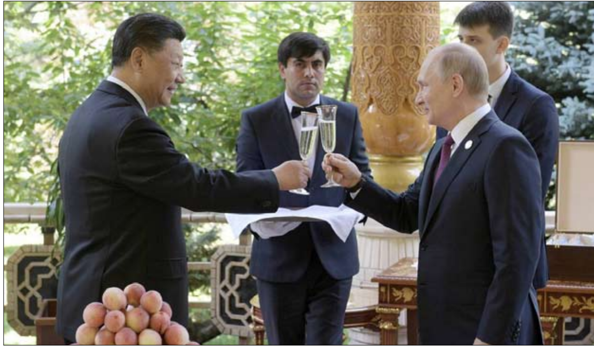
نخب لا يروق للأمريكان