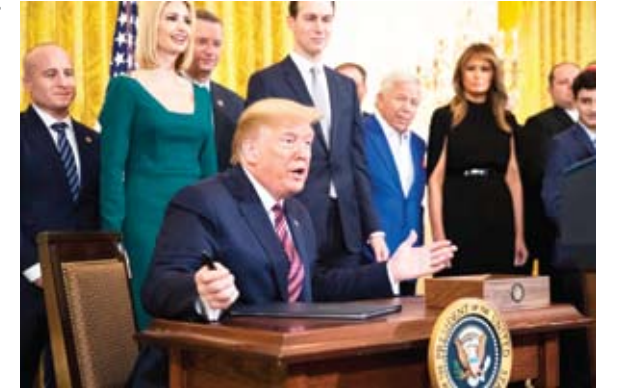
ترامب صانع الفرجة

قال مصدر مطلع داخل مطار معيتيقة الليبي، أمس الأحد، إن طائرة نقل عسكرية غادرت طرابلس في طريقها لتركيا وعلى متنها 120 مرتزقا سوريا. وأكد المصدر في تصريحات لسكاي نيوز عربية أن المطار تسلم بالفعل لجول طائرات تركية وليبية ستقل أكثر من ألف مرتزق خلال أسبوع واحد. وأوضح المصدر، أن 120 عنصرًا حضروا صباح الأحد للمطار في عربات عسكرية، حيث تم وضعهم في إحدى القاعات الجانبية البعيدة عن صالات الركاب ومن ثم تم إقلائهم للطائرة. وأكد أن الطائرة توجهت إلى مطار يقع في إحدى المدن التركية الحدودية مع سوريا تمهيدا لتفليح مدينة عفرين التي تسيطر عليها ميليشيات موالية لأتقرة. من جانبه أكد المرصد السوري لحقوق الإنسان، أن دفعة من مرتزقة فضيل "السلطان مراد" ومسلحين آخرين عادوا خلال الساعات الماضية إلى الأراضي السورية قادمين من ليبيا. ويحسب المرصد فإن ذلك يأتي بعد ضغوط دولية وإقليمية على تركيا. وكان موقع "سكاي نيوز عربية" انفرذ الثلاثاء الماضي، بأن اتفاقا جرى بين تركيا والولايات المتحدة يقضي بخروج المرتزقة السوريين من كافة التراب الليبي. وأشار المصدر إلى أن طائرات من الخطوط الإفريقية وطائرات تركية ستقل المرتزقة من مطار معيتيقة الدولي إلى تركيا، ومن ثم إلى سوريا. ومطلع ديسمبر الماضي، كشفت مبعوثة الأمم المتحدة بالإبارة إلى ليبيا، ستيفاني وليامز، عن وجود 20 ألفاً من "القوات الأجنبية والمرتزقة" في ليبيا، معتبرة ذلك انتهاكاً "مروعاً" للسيادة الوطنية، كما أشارت إلى وجود 10 قواعد عسكرية في ليبيا، تشغلها بشكل جزئي أو كلي قوات أجنبية ومرتزقة.