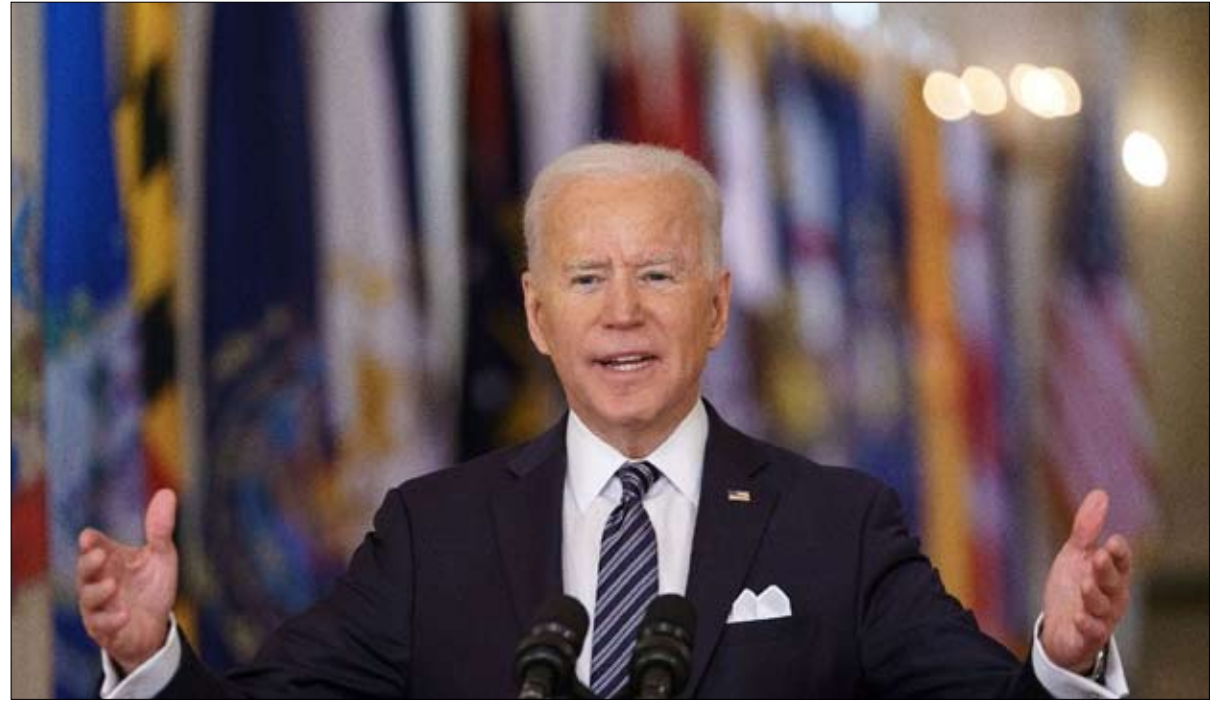
بايدن يريد لعب دور الشرطي