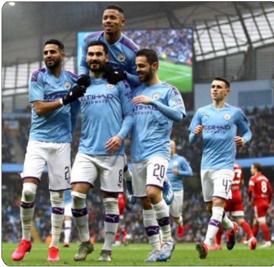
ولم يكن مانشستر سيتي بحاجة الموسم الحالي بقدر حاجته إليها ست مباريات قوية في غضون 19 يوما فقط، خلال مارس إلى فترة الراحة في أي وقت من الآن لاسيما وأن الفريق خاض

الحالي وكانت معظمها مباريات من العيار الثقيل، وتبدو الفرصة سانحة الآن أمام مانشستر سيتي للاستعداد الجيد قبل الفترة العصبية التي تنتظر الفريق في أبريل المقبل حيث يخوض فيها أكثر من اختبار صعب وحاسم في مسيرته بالموسم الحالي. ومن خلال فوزه الثمين على إيفرتون أمس، واصل الفريق كتابة اسمه في سجلات الأرقام القياسية حيث حافظ على سجله خاليا من الهزائم للمباراة الـ 17 على التوالي في مختلف البطولات خارج ملعبه، كما عزز الفريق رقمه القياسي في عدد الانتصارات المتتالية خارج ملعبه في مختلف البطولات وحقق الانتصار الـ 14 على التوالي خارج ملعبه وهو رقم قياسي أيضا للنادية الإنجليزية. وسيكون مانشستر سيتي بحاجة إلى الحفاظ على هذه المسيرة الناجحة خارج ملعبه خلال أبريل المقبل لحسم أكثر من