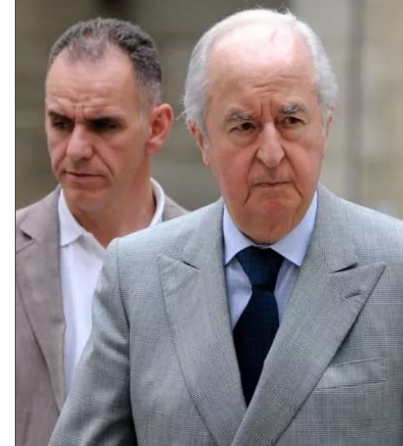
بالادور اغواه النموذج

لم يعد من السادر أن نرى هذا الجهاز في برنامج "لا تلمس سياسي تلفزيوني لسيريل حنون. نفهم كانوا عام 1994، فزعين ومنزعجين بسبب ابتعاد برامج بداية عصر برلسكوني، ففور ظهورهم على الهواء، تنأى سلسلة من التخريجات الفظة والعنيفة، والتي تترجم بلا شك تحدي صيف للقواعد الديمقراطية. تمكن من تجديد عدد كبير من المتعاطفين في نوع من محكمة شعبية كبرى لعيوب وأمزق الحكومات السابقة. مع برلسكوني، تم بيع الحلم لجميع أشكاله: رحلات بحرية ساحية، وعود رائعة بان إيطاليا تشهد إرداد بالادور، آلان مادلين، حماسه