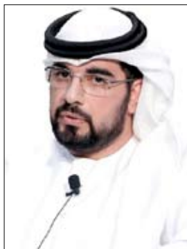
على الساحة الثقافية العربية كالبوكر وجائزة الشيخ زايد