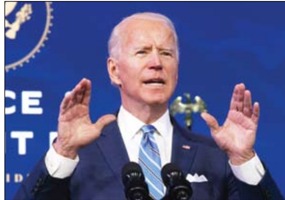
بايدن يريد لعب دور الشرطي

في ذلك الجو القطبي، اتهم الأمريكيون الصينيين بـ "الإبادة الجماعية ضد مسلمي الأويغور في شينجيانغ، وتدوا باعتداءات بكين ضد هونغ كونغ أو تايوان، واحتجوا على الهجمات الإلكترونية الصينية... الكثير من المظالم التي تهدد" استقرار العالم، "ويج بلينكين، ليست هذه هي الطريقة التي نرحب بها بضيوفنا"، هذا ما قاله نظيره الصيني وانغ بي. ويجب أن "نتخلى عن عقلية الحرب الباردة"، رد زميله من الحزب الشيوعي يانغ جيتشي. (التفاصيل ص10)