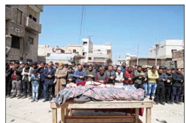
أثناء تنصيب أحد الضحايا الأكراد

التي، دون معرفة الأسباب، كما استمرت الاشتباكات العنيفة بين قوات النظام وقوات سوريا الديمقراطية من جهة، والقوات التركية والفصائل الموالية لها على محاور عين الغربية من جهة قريتي صيدا ومعلق، وسط قصف صاروخي متبادل بين الطرفين. إلى ذلك، ارتفعت حصيلة الضحايا البشرية على خلفية القصف الصاروخي لقوات