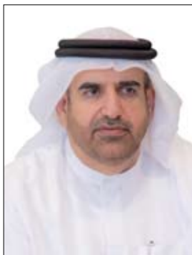
وجائزة العويس وكيف يمكن أن نقيم أثر هذه الجوائز.