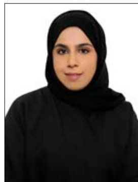
وأشار إلى أسباب تراجع الكتب ذات العمق الفكري والفلسفي