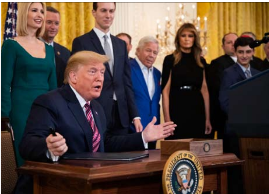
ترامب صانع الفرجة

لم يطبع الرجلان بلديهما فقط وإنما أثرا أيضاً على السياسة الفرنسية وغيراً جميع رموزها الفرنسية. اثنان من أصحاب المليارات، يجسدان الرأسمالية المنتصرة في الثمانينات تكمن قوة هذه التجارب السياسية في وصف بسيطة أولها كسر القواعد القديمة للحياة السياسية