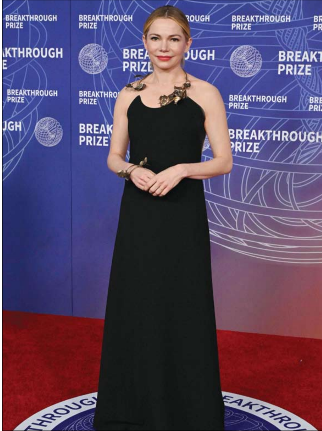
الممثلة الأمريكية ميشيل ويليامز لدى حضورها حفل توزيع جوائز بريكثرو الثاني عشر في باركر هانغرا في سانتا مونيكا، كاليفورنيا، 1 أ ف ب

وتخلص الدراسة إلى أن فهم تأثير البيئة السكنية المبكر قد يفتح الباب أمام استراتيجيات جديدة للوقاية من أمراض القلب، تستند إلى تحسين ظروف المعيشة إلى جانب العوامل الطبية التقليدية.