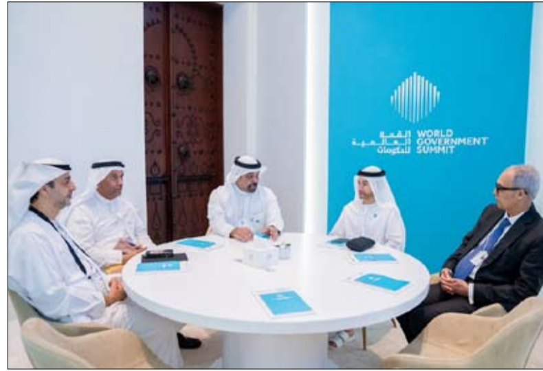
على هامش القمة العالمية للحكومات 2023