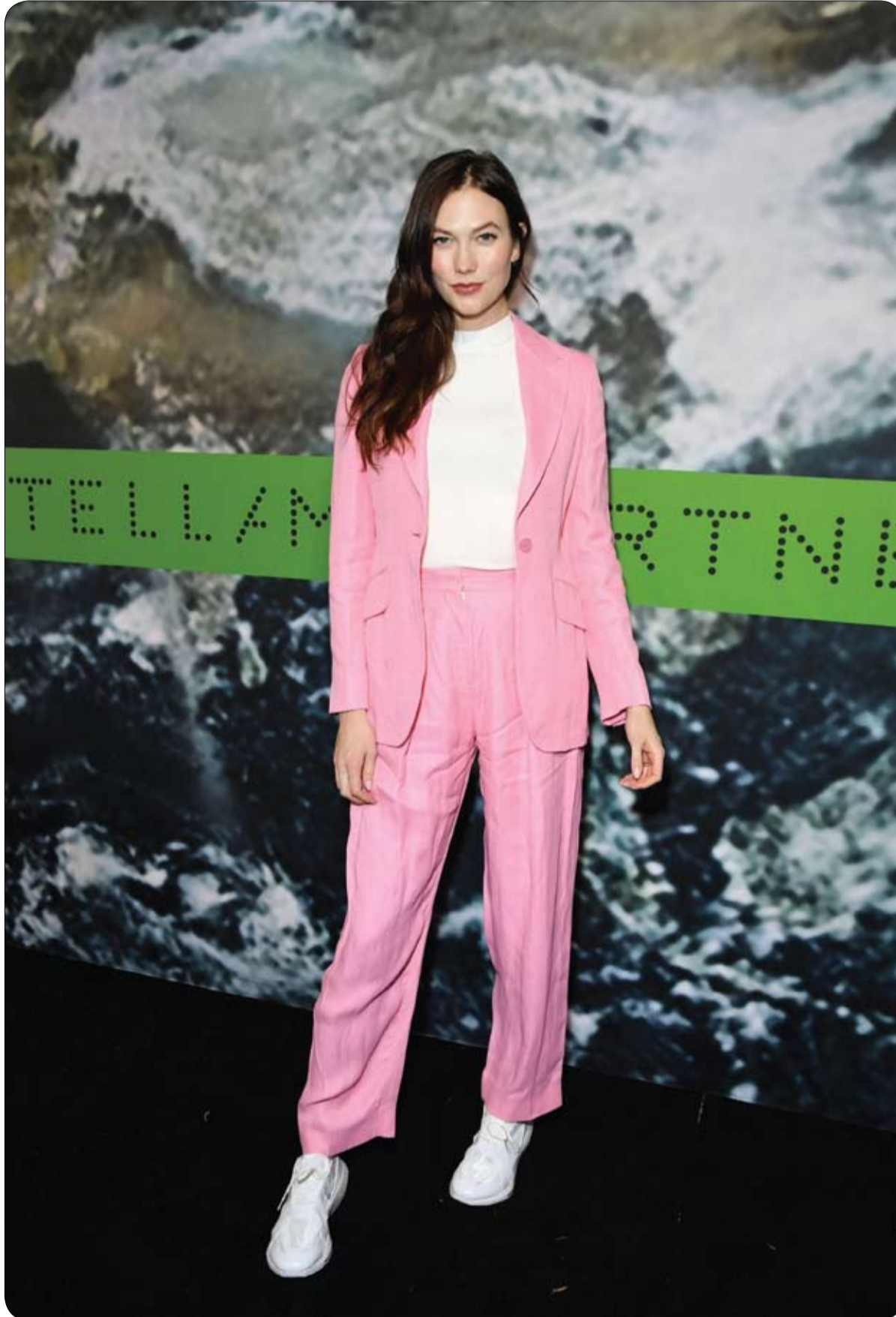
كارلي كلوس خلال حضورها حفلة ستيليا مكارتنّي X أديداس في لوس أنجلوس، كاليفورنيا.

تم عرض جزء من جزيرة كرواتية ساحرة فريدة من نوعها في البحر الأدرياتيكي على شكل قلب للبيع في الوقت المناسب لعبد الحب. وإذا كنت تبحث عن هدية نادرة لعبد الفالنتاين، وتملك 13 مليون يورو (14 مليون دولار) لتنتفحها، فهذه الجزيرة التي يطلق السياح على الجزيرة اسم "جزيرة الحب" هي ما تبحث عنه. وتعد جزيرة غالينسناك غير المأهولة في قناة باسامان واحدة من أكثر الجزر الكرواتية شهرة ويتم تقديم جزء منها للمشتريين المحتملين من أجل التنمية. وقال سيلفسترو كاروم، ممثل مالك قطعة الأرض المعروضة للبيع "يتم التقاط أكثر من مليون صورة سنويا في الجزيرة وحولها واعتقد أن شعبيتها عالية جدا".