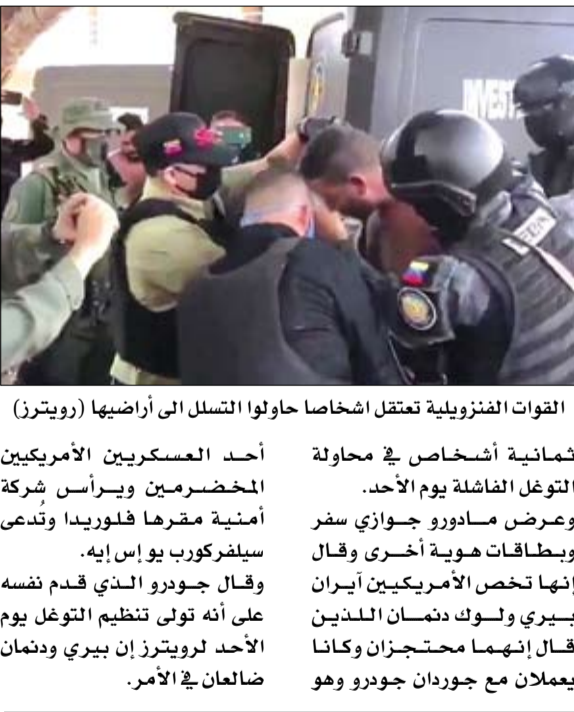
القوات الفنزويلية تعتقل اشخاصا حاولوا التسلل إلى أراضيها

تماشياً مع خطة وزارة الصحة ووقاية المجتمع لتوسيع وزيادة نطاق الفحوصات في الدولة بهدف الاكتشاف المبكر وحصر الحالات المصابة بفيروس كورونا المستجد كوفيد 19 والمخالطين لهم وعزلهم، أعلنت الوزارة عن إجرائها أكثر من 28 ألف فحص جديد على فئات مختلفة في المجتمع باستخدام أفضل وأحدث تقنيات الفحص الطبي. وساهم تكثيف إجراءات التقصي والفحص وتوسيع نطاق الفحوصات