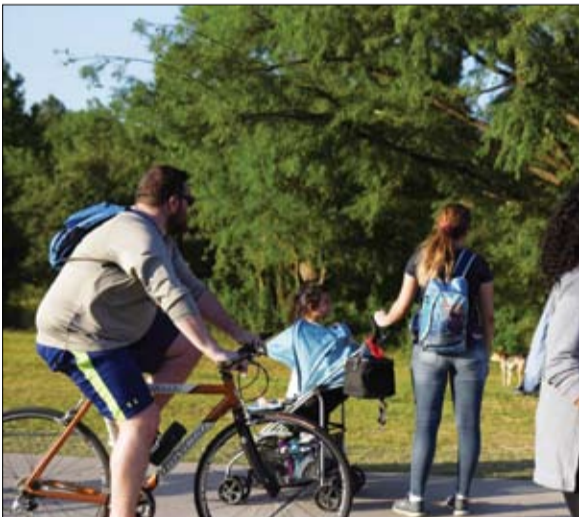
عائلات تتجمع في بوفالو ببارك عقب تخفيف إجراءات التباعد الاجتماعي في هيوستن، تكساس.

عواصم-وكالات يواصل فيروس كورونا المستجد تفشيه وحصد الأرواح رغم الإجراءات الاحترازية التي طبقتها العديد من البلدان حول العالم. وأودى وباء كوفيد-19 بحياة أكثر من ربع مليون نسمة، ما يزيد عن 85 المئة منهم في أوروبا والولايات المتحدة لوحدهما، منذ ظهر فيروس كورونا المستجد للمرة الأولى في الصين في ديسمبر الماضي، وفق تعداد أجرته وكالة فرانس برس ليل الاثنين استناداً إلى مصادر رسمية. تسجيل إيطاليا 195 وفاة جديدة بـفيروس كورونا ومجموع الوفيات يتجاوز 29 ألفاً، وتم تسجيل 164 وفاة جديدة بـفيروس كورونا في إسبانيا وإجمالي الوفيات يصل إلى 25428. كما سجلت الولايات المتحدة،