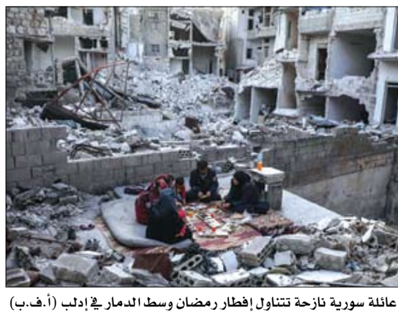
عائلة سورية نازحة تتناول إفطار رمضان وسط الدمار في إدلب

عواصم-وكالات قتل 14 مقاتلاً من القوات الإيرانية والمجموعات الموالية لها على الأقل في غارات استهدفت ليلاً مواقع تابعة لها في محافظة دير الزور في شرق البلاد، وفق ما أفاد المرصد السوري لحقوق الإنسان. ورجح المرصد أن تكون طائرات جوية إسرائيلية شنت الغارات ليلاً مستهدفة بادية مدينة الميادين وبلدتي الصالحية والقورية، موضحة