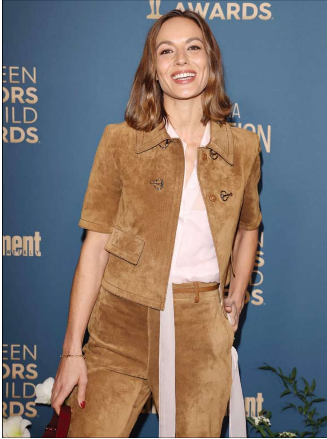
الممثلة الفرنسية أنطونيا ديسبلات لدى حضورها حفل توزيع جوائز نقابة ممثلي الشاشة (SAG Awards) في لوس أنجلوس.

كشفت خبيرة في التغذية عن بعض الأطعمة أو الوجبات الخفيفة التي لا ينبغي تناولها مع كوب من الشاي أو القهوة. وقالت الصيدلانية ديبورا غرايسون، إن شرب الشاي أو القهوة مع أطعمة معينة، مثل اللحوم الحمراء والخضروات الورقية الخضراء (السبانخ والبروكلي)، قد يزيد من فرصة الإصابة بنقص شديد في العناصر الغذائية. وأوضحت أن المواد الكيميائية الموجودة في هذه المشروبات الساخنة، تمنع الجسم من امتصاص الحديد (المعدن الحيوي لنقل الأكسجين في جميع أنحاء الجسم، ما يمنحنا الطاقة ونظام مناعة قوي). وتابعت غرايسون: "إذا كنت تشرب الشاي دائماً مع وجبتك الغذائية، فقد تصاب بفقر الدم". ويمكن أن تكون أعراض فقر الدم منهكة، بما في ذلك الإرهاق الشديد وتساقط الشعر والالتهابات المتكررة. وتنصح غرايسون أولئك الذين يعانون من ضعف الشهية، والذين يتطلعون إلى زيادة الوزن أو العضلات، بالامتناع عن شرب الكثير من أي من السوائل مع الوجبات. وتقول: "إن وجود السوائل في المعدة يمكن أن يقلل من كمية الطعام التي يمكنك تناولها". وتشمل نصائح غرايسون الأخرى: تناول الطعام في موعد لا يتجاوز 3 ساعات قبل الذهاب إلى الفراش، والامتناع عن الاستلقاء بعد الوجبة لتجنب أعراض الارتجاع.