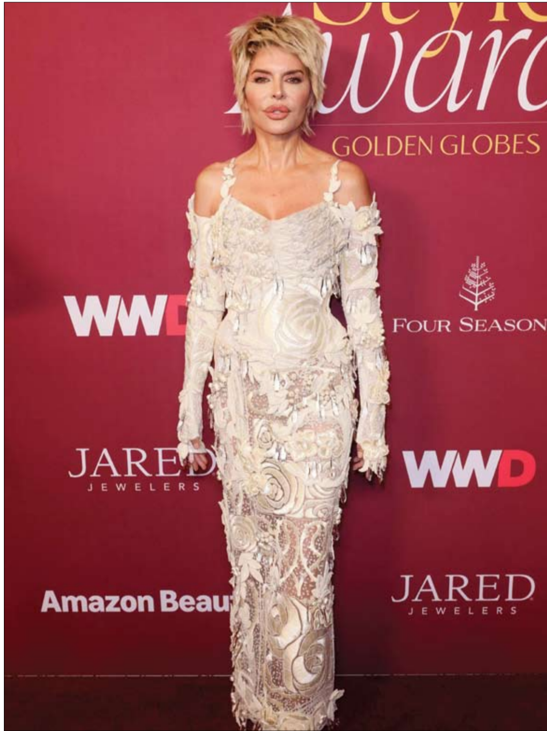
الممثلة الأمريكية ليزا رينا لدى حضورها حفل توزيع جوائز WWD Style للفولدن غلوب في لوس أنجلوس. (ا ف ب)

ووفقا له، يجب على الشخص في حالة استمرار ارتفاع مستوى ضغط الدم مراجعة الطبيب المختص لوصف العلاج المناسب أو تغيير الأدوية التي يتناولها.