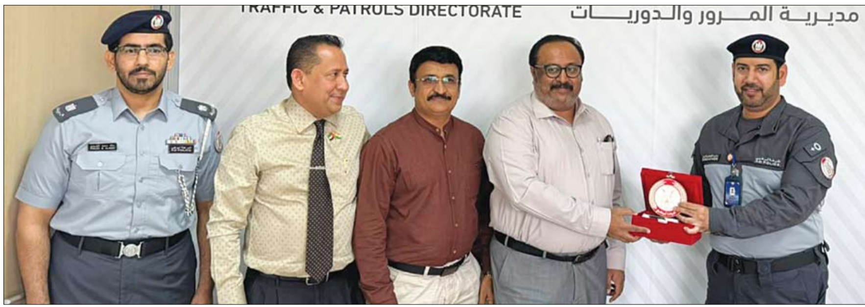
21 من الشركاء الاستراتيجيين في منطقة العين تقديراً لجهودهم