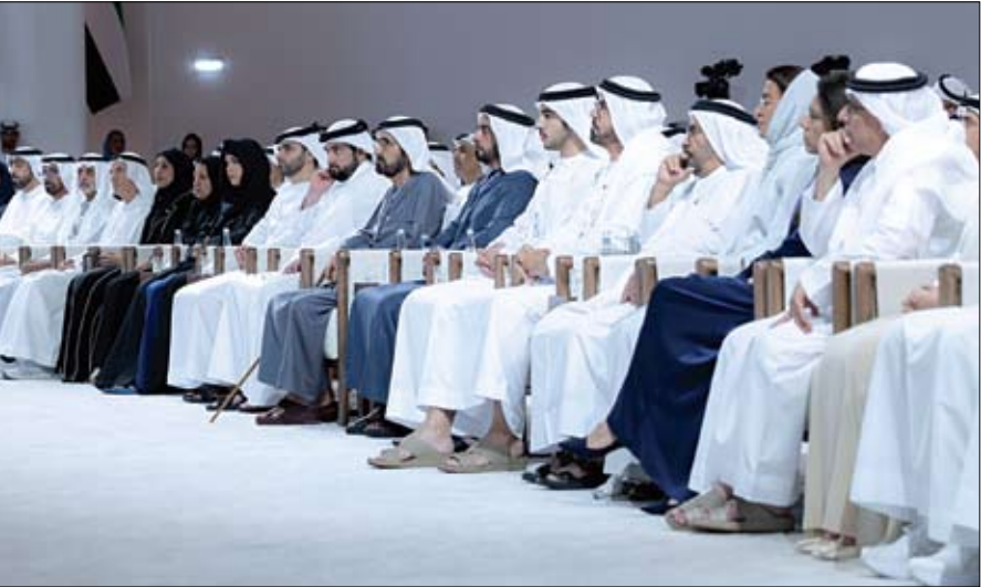
محمد بن راشد يشهد إطلاق «الأجندة الوطنية لنمو الأسرة 2031»، (وام)

وقال صاحب السمو الشيخ محمد بن راشد آل مكتوم : مجتمعنا التماسك عنوان قوتنا ونجاح تجربتنا ورصيد الإمارات الأثمن في حاضرها ومستقبلها.. ترسيخ قيم الأسرة الإماراتية وتعزيز استقرارها ورهاها مسؤولية وطنية كبرى وغاية كل جهد حكومي.. نمو الأسرة كان وسبقني هدفا ساميا في دولتنا والاستثمار في هذا الملف تحصين لما أنجزناه وما نريده من خير لأجيالنا القادمة، (التفاصيل ص7) العاصمة أبوظبي.