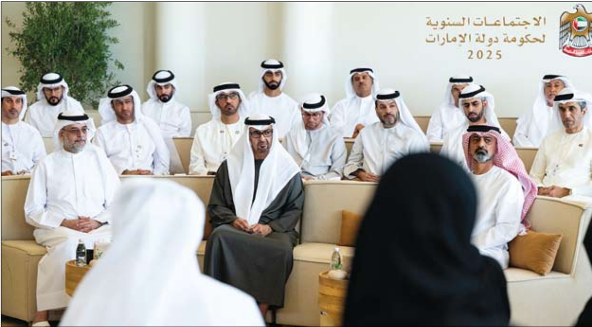
رئيس الدولة خلال حضوره جلسة حول الأجندة الوطنية لنمو الأسرة 2031 ضمن الاجتماعات السنوية لحكومة الإمارات

شهد صاحب السمو الشيخ محمد بن زايد آل نهيان رئيس الدولة حفظه الله أمس جلسة حول الأجندة الوطنية لنمو الأسرة 2031 ، التي عقدت ضمن الاجتماعات السنوية لحكومة الإمارات في دورتها لعام 2025 في العاصمة أبوظبي، بمشاركة قيادات ومسؤولين من الجهات الاتحادية والمحلية. كما وجه سموه بتخصيص عام 2026 ليكون «عام الأسرة» تعزيزاً لأهداف الأجندة الوطنية لنمو الأسرة الإماراتية .. بجانب ترسيخ وعي مجتمع دولة الإمارات من مواطنين ومقيمين بأهمية الحفاظ على الترابط الأسري والعلاقات الأسرية المثينة التي تجمع أفراد الأسرة كونها الركيزة الأساسية التي يقوم عليها المجتمع القوي والمزدهر.. إضافة إلى دورها في غرس قيم التعاون والتواصل والتآلف الأصيلة التي يتميز بها مجتمع الإمارات ونقلها إلى الأجيال المقبلة للحفاظ عليها واستمراريتها.