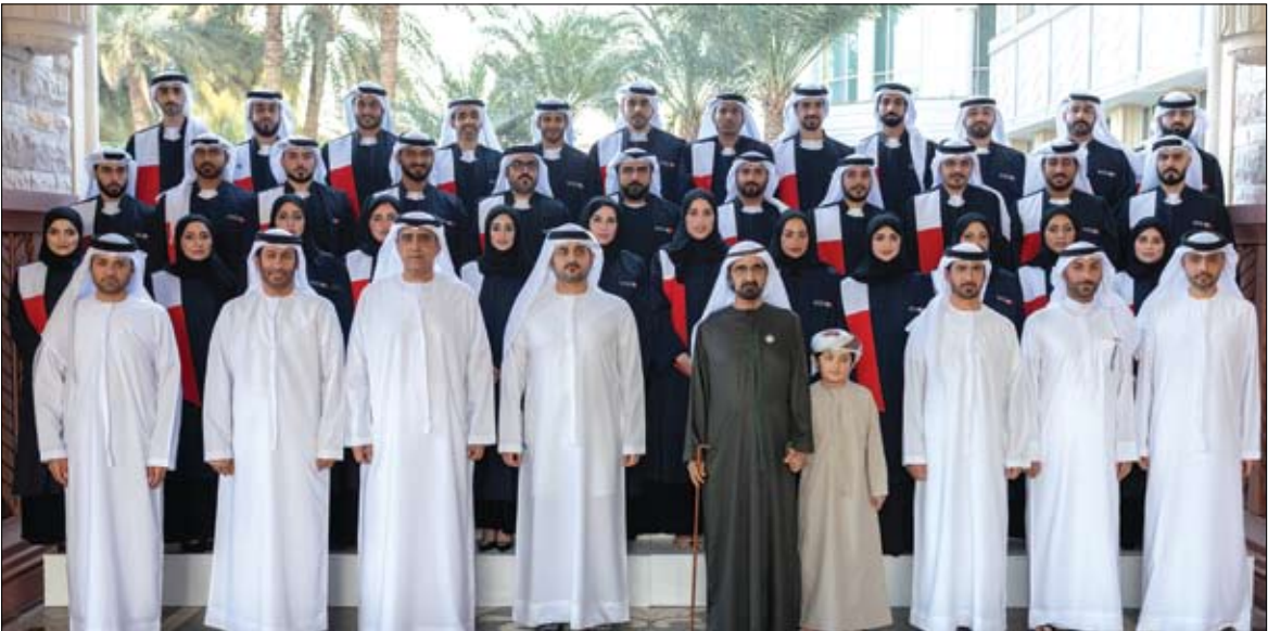
أمام محمد بن راشد القضاة الجدد في محاكم دبي يؤدون اليمين القانونية

أمام سموه 35 قاضيا من المواطنين في محاكم دبي يؤدون اليمين القانونية محمد بن راشد: القضاء العادل حصن لحماية الحقوق وصون كرامة الإنسان