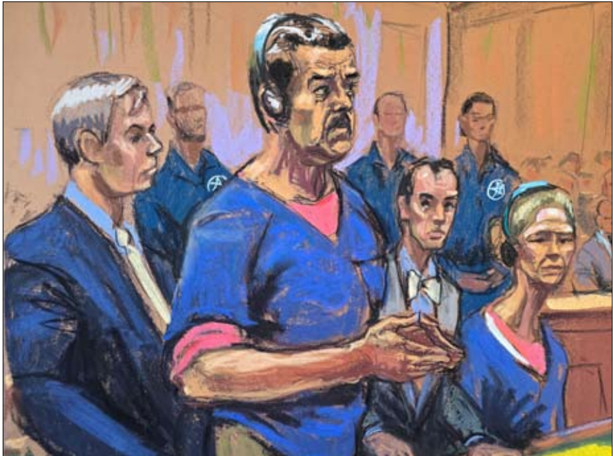
رسم تخطيطي لمحاكمة الرئيس الفنزويلي المخلوع في نيويورك

ترامب باستمرار، محل شك، وكذلك مسؤولية فنزويلا في أزمة الفنتانيل، التي تتبع أساساً من الصين والمكسيك. في مذكرة رُفعت عنها السرية في مايو 2025، خالف مجلس الاستخبارات الوطنية، الذي يضم وكالات الاستخبارات الأمريكية الرئيسية، الرئيس قائلاً: «على الرغم من أن البيئة المتساهلة في فنزويلا تسمح لشبكة ترين دي أراغوا بالعمل، إلا أن نظام مادورو على الأرجح لا يتبنى سياسة التعاون معها، ولا يوجه تحركاتها أو عملياتها نحو