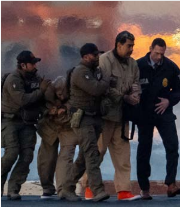
مادورو يواجه عقوبة السجن المؤبد بتهمة التآمر الإرهابي في تجارة المخدرات

– إلى الكثير حول نهج واشنطن في «الحرب على المخدرات». فعلى سبيل المثال، خُذلت جميع الإشارات تقريباً إلى هندوراس في هذه النسخة الأخيرة، بينما ذكرت الدولة بشكل مُفصل في النسخة الأولى. وفي الوقت نفسه، في الأول من ديسمبر-كانون الأول 2025، أصدر الرئيس الأمريكي دونالد ترامب عفواً عن خوان أورلاندو هيرنانديز. حُكم على