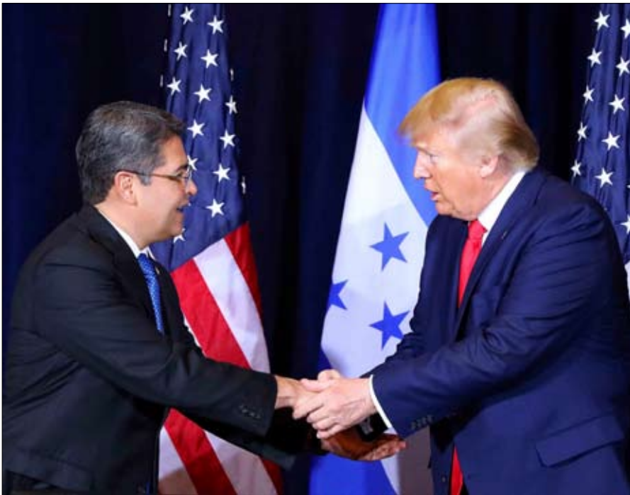
ترامب أصدر عفواً عن الرئيس الهندوراسي خوان أورلاندو هيرنانديز

وتذكر العصابة كجزء من المؤامرة، إلى جانب أربع منظمات أخرى: القوات المسلحة الثورية الكولومبية (فارك) –وهي جماعة حرب العصابات الكولومبية الرئيسية، التي تم حلها رسمياً عام 2017 – وجيش التحرير الوطني، الذي لا يزال نشطاً في البلاد، وعصابتان مكسيكيتان، هما كارتل سينالوا ولوس زيتاس. ويستمر النقاش بعرض الحقائق المادية الرئيسية المزعومة. تُروى عدة حوادث يُزعم فيها أن نيكولاس مادورو سهّل تهريب المخدرات، لا سيما من خلال بيع جوازات سفر دبلوماسية، وتتهم