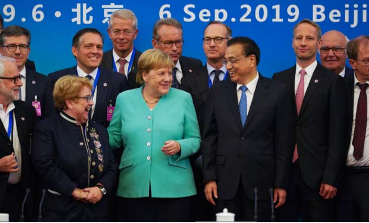
انجيليا ميركل ضعف في الداخل ينعكس على الخارج