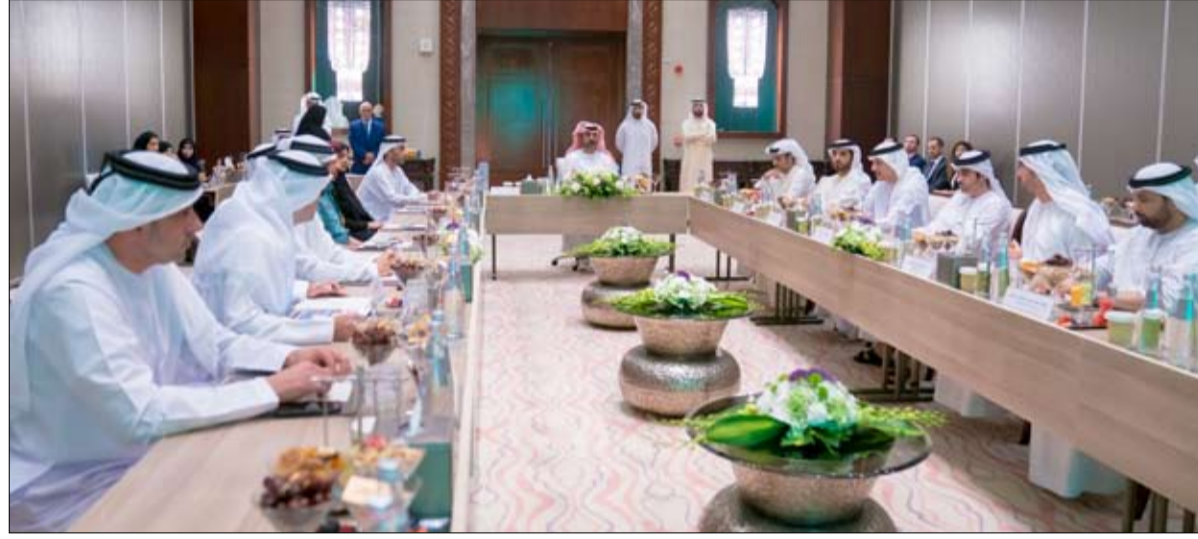
كما ناقش المجلس تحليل الفجوات ومبادرات التحسين في حكومة عجمان وفرص التطوير .

عجمان حيث وجه سموه الجهات بضرورة تصميم نظام مالي يعزز عملية التخطيط والإدارة المالية في الحكومة مبني على أساس تكامل التخطيط الاستراتيجي والمالية والاستقرار الاقتصادي. وأضاف سموه أننا نتطلع قريباً إلى رؤية نتائج إيجابية و تطورات في مؤشرات أداء الجهات الحكومية تعكس كفاءتها وفعاليتها في إدارة مواردها المالية وكيفية تسخيرها لخدمة أهداف الإمارة. واستعرض المجلس مستجدات وتطورات مستهدف التوظيف الذي قدمته دائرة الموارد البشرية ومؤشرات أداء الجهات الحكومية. عجمان حيث وجه سموه الجهات بضرورة تصميم نظام مالي يعزز عملية التخطيط والإدارة المالية في الحكومة مبني على أساس تكامل التخطيط الاستراتيجي والمالية والاستقرار الاقتصادي. وأضاف سموه أننا نتطلع قريباً إلى رؤية نتائج إيجابية و تطورات في مؤشرات أداء الجهات الحكومية تعكس كفاءتها وفعاليتها في إدارة مواردها المالية وكيفية تسخيرها لخدمة أهداف الإمارة. واستعرض المجلس مستجدات وتطورات مستهدف التوظيف الذي قدمته دائرة الموارد البشرية ومؤشرات أداء الجهات الحكومية.