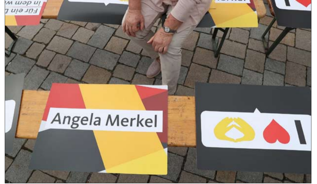
اقتصاد يهتز وحضور يهتز.. وصورة تشظى