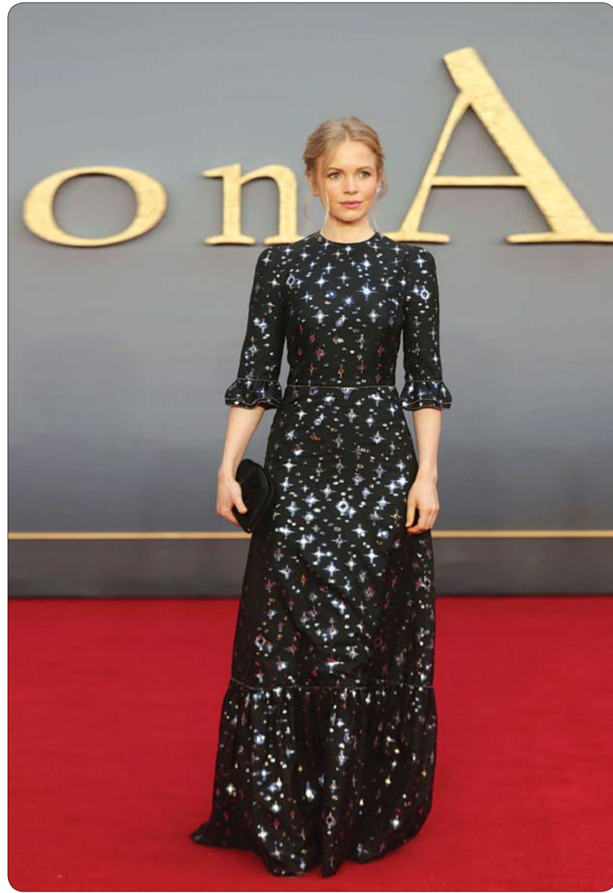
الممثلة كيت فيليبس خلال حضورها العرض العالمي الأول لـ «Downton Abbey» في لندن

وأضافت بوزين أنه بينما استمرت موجة الحر لعام 2003 لمدة 20 يوماً، استمرت هذه السنة 18 يوماً، في موجتي حر منفصلتين، غطت الثانية منهما جزءاً واسعاً من فرنسا. وقالت أن الإجراءات الوقائية التي اتخذتها السلطات ساعدت على إبقاء معدل الوفيات أقل بكثير من تلك الأعداد الكبيرة التي شهدتها عام 2003.