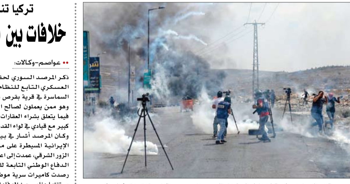
قوات الاحتلال تطلق قنابل الغاز باتجاه المتظاهرين والصحفيين في الضفة المحتلة