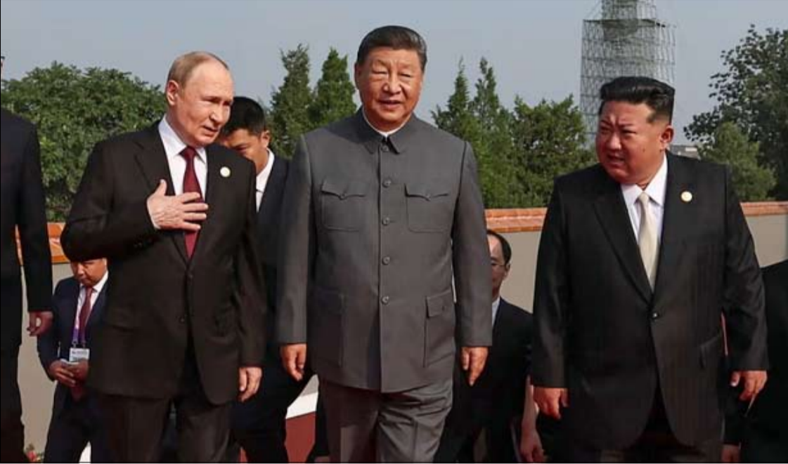
قادة الصين وكوريا الشمالية وروسيا