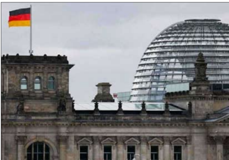
الممثل لوكاشينكو أو مجلس الولايات الممثل للولايات الألمانية، مشيراً إلى أن المسار يتطلب ملفاً قانونياً متماشياً يستند إلى أدلة مؤسسية على تعارض نشاط الحزب مع النظام الديمقراطي الديمقراطي.

من جانبها ذكرت شبكة «إيه آر دي» الألمانية، أن المساعي الرامية إلى الدفع بإجراء دستوري ضد حزب