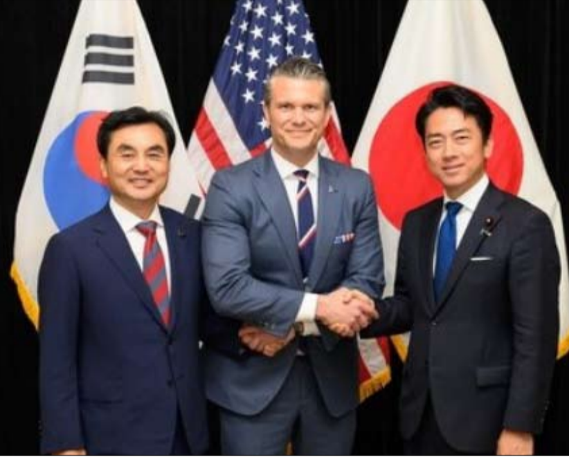
وزراء دفاع اليابان وكوريا الجنوبية والولايات المتحدة

تواجه نتالي هارب، المساعدة القربة من الرئيس الأمريكي دونالد ترامب البالغ من العمر 80 عاماً، انتقادات واسعة واتهامات بتغذية ما وُصف بـ«أوهام الرئيس»، وذلك إثر كشف تفاصيل مثيرة حول طبيعة علاقتها غير التقليدية في كتاب جديد بعنوان «تغيير النظام: داخل الرئاسة الإمبراطورية لدونالد ترامب، لصحفي «نيويورك تايمز»، ماغي هارمان وجوناثان سوان. وأشار التقرير إلى أن دور نتالي هارب البالغة من العمر 34 عاماً يتجاوز مهام المساعد التقليدي، حيث تلعب دوراً محورياً في إدارة حساباته على منصات التواصل الاجتماعي، لا سيما المنشورات المتأخرة، وتزويده بقصاصات مطبوعة من الإشادات عبر الإنترنت لتعزيز معنوياته وعزله داخل فقاعة معلوماتية. ووفقاً لما تناوله كتاب المؤرخين البارزين، فقد عثر موظفو البيت الأبيض على رسائل شخصية للغاية تركتها هارب في الأماكن الخاصة بترامب تؤكد فيها ولاها المطلق له بعبارة مثل «أنت كل ما يهم لدي»، وهو ما رد عليه ترامب بطمأنتها مؤكداً للمحيطين به أنها لن تتركه أبداً على عكس بقية المساعدين، وأشارت هذه المراسلات ذهول رئيسي موظفي البيت