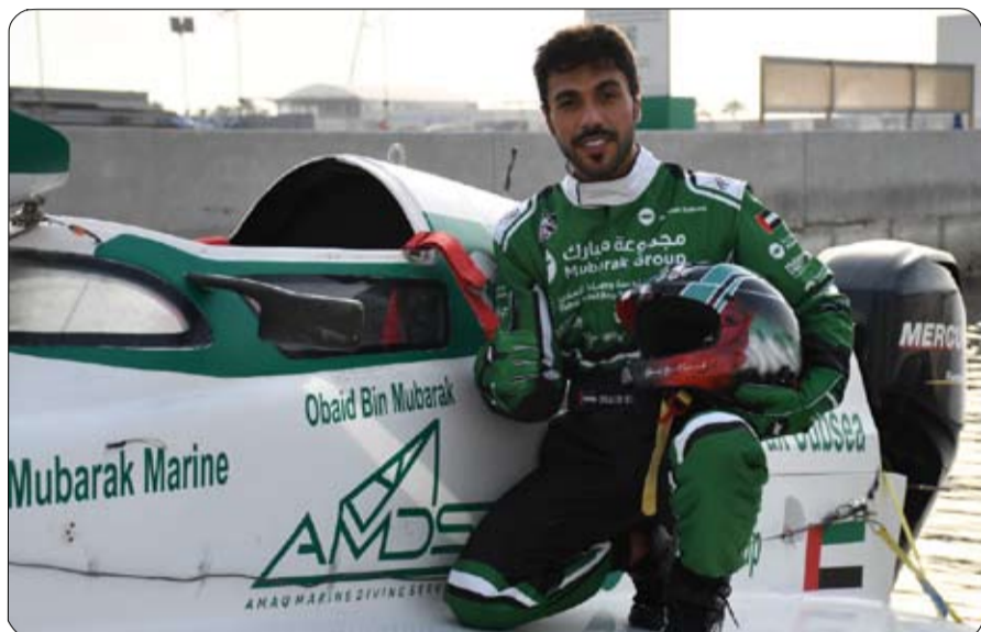
الإمارات 2023-2024 والتي تألق فيها من خلال جولتي أبوظبي والشارقة محققاً نجاحاً كبيراً حيث ليشجعه الأمر لخوض مشوار جديد نحو البطولات الأوروبية.