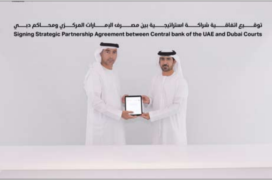
توقيع اتفاقية شراكة استراتيجية بين مصرف الإمارات المركزي ومحاكم دبي Signing Strategic Partnership Agreement between Central Bank of the UAE and Dubai Courts

وقّع مصرف الإمارات العربية المتحدة المركزي ومحاكم دبي بمقر المصرف المركزي في أبو ظبي، أمس، مذكرة تفاهم بشأن الربط الإلكتروني للخدمات المتعلقة بتنفيذ الأحكام والأوامر والقرارات الصادرة عن المحاكم بنظام إدارة قضايا المحاكم لدى المصرف المركزي. وقّع المذكرة، معالي خالد محمد العمي، محافظ مصرف الإمارات العربية المتحدة المركزي، وسعادة الدكتور سيف غانم السويدي، مدير محاكم دبي، بحضور المسؤولين من الطرفين. ويأتي توقيع المذكرة في إطار السعي المشترك في تنفيذ برنامج تطوير البيروقراطية الحكومية للارتقاء بأداء وكفاءة وفعالية الخدمات، واستراتيجية الدولة بشأن التحول الرقمي للخدمات المقدمة للأفراد وقطاع الأعمال، وترسيخ أواصر التنسيق