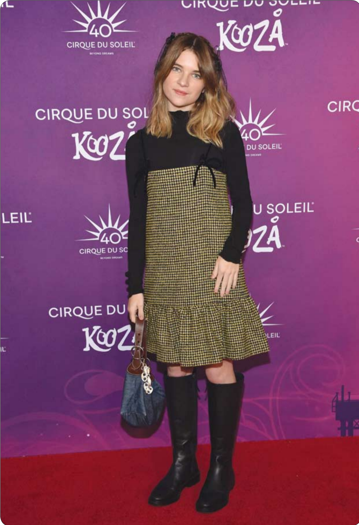
الممثلة الأمريكية ريغان ريفورد تحضر العرض الأول لفيلم KOOZA في ريفيف سانتا مونيكا، كاليفورنيا.

وأكد أن الباحثين استخدموا فقط الريش والطيور المحنطة المتوفرة في السوق، وعملوا مع فنانين التحنيط المحليين. وركز الباحثون على بطئتين محنطتين تم تصميمهما كطائرات مسيرة ترفرف وتطفو، ويقال إن الطائرات بدون طيار، التي تحاكي حركات أرجل البط، تمكن من الحركة الواقعية والطبيعية في الماء.