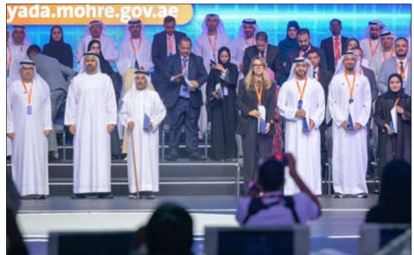
تقديرًا لدوره في التمكين والتدريب