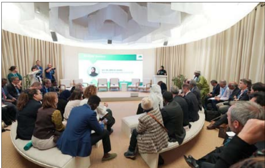
الإجازات المهمة التي حققتها مبادرة الابتكار الزراعي من أجل المناخ "AIM for Climate". وقالت معاليها إنه خلال مشاركتنا في مؤتمر الأطراف COP26 قبل ثلاث سنوات، أطلقت دولة