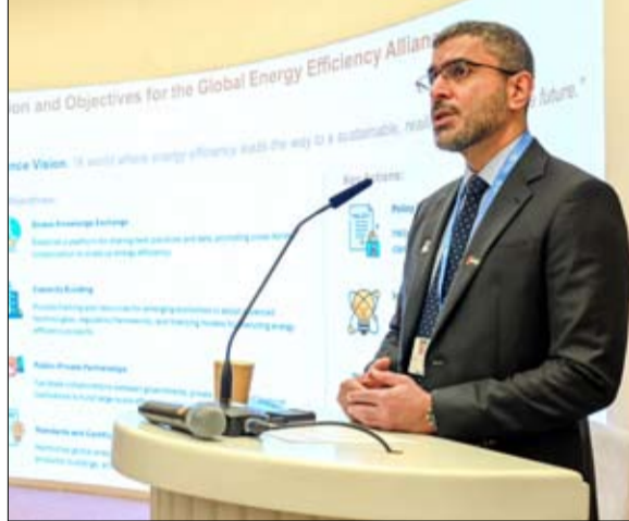
خلال التعاون بين الدول والمؤسسات والشركات بهدف مضاعفة معدلات كفاءة استهلاك الطاقة السنوي عالمياً بحلول عام 2030 دعماً للالتزام العالمي لضاعفه تحسين كفاءة الطاقة بحلول العام ذاته .

التي تحتاج إلى مثل هذا النوع من المبادرات التي تتضمن حلولاً تمويلية وتكنولوجية. وقال العلماء إن مشاركة الوزارة في فعاليات مؤتمر الأطراف تأتي بهدف مواصلة البناء على الإنجازات التي حققتها مؤتمر الأطراف COP28 وتعزيز التعاون الدولي بهدف تنفيذ "اتفاق الإمارات" التاريخي الذي أرسى مساراً جديداً للعمل المناخي الدولي. وأضاف العلماء أن وزارة الطاقة والبنية التحتية تشارك في COP29 بعدد من الجلسات الوزارية إضافة