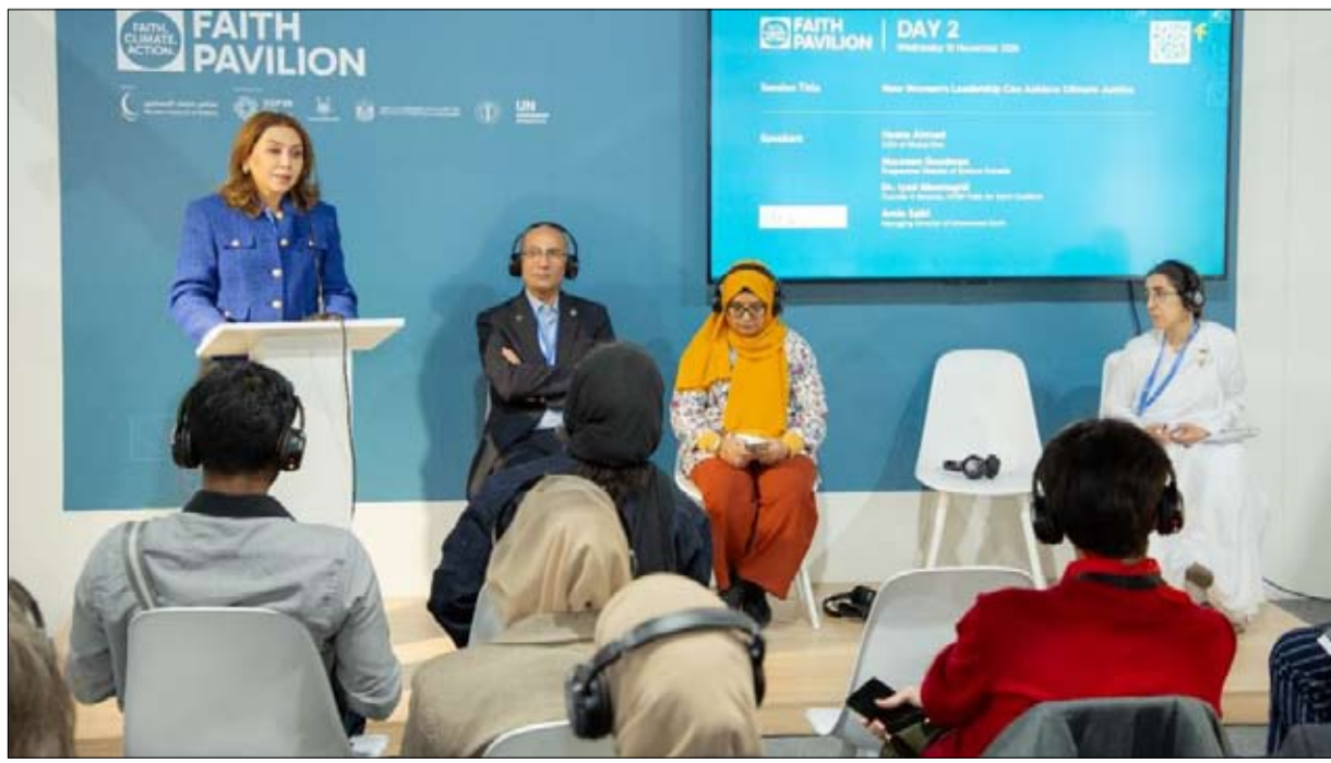
مواجهة التحديات المناخية، خاصة مجتمعات دول الجنوب العالمي الأكثر عرضة لتداعيات تغير المناخ، مشيداً بالجهود التي بذلتها منظمات دينية في أفريقيا لتشكل شبكات تعزيز العدالة المناخية، وجمع بيانات دقيقة حول الأضرار الناتجة عن تغير المناخ، بما في ذلك فقدان البنية التحتية والتأثيرات على الصحة النفسية والتنوع البيولوجي. وتناولت جلسة أخرى دور القيادات النسائية في دعم جهود تحقيق العدالة المناخية، وسلطت الضوء على مجموعة من القضايا المحورية المتعلقة بدور المرأة في مواجهة التحديات المناخية والبيئية. ويهدف جناح الأديان إلى البناء على النجاح الذي حققه في النسخة الأولى خلال "COP28"، التي استضافتها دولة الإمارات العام الماضي، وذلك من خلال تنفيذ مجموعة من الجلسات الحوارية تشمل أكثر من 40 جلسة نقاشية وحوارية تركز على ضرورة تعزيز التعاون بين الأديان لرعاية الأرض، ويحت أفضل الممارسات الجيدة للتخطيط لتكثيف استخدام من قبل الجهات الفاعلة في مجال الإيمان، وكيفية تشجيع أنماط الحياة المستدامة من خلال الدين، فضلاً عن استكشاف التأثيرات غير الاقتصادية لتغير المناخ من خلال وجهات نظر قائمة على الإيمان، وإمكانية الوصول إلى تمويل الخسائر والأضرار، والدعوة إلى آليات المساهمة المحلية والعدالة المناخية الشاملة للجميع.