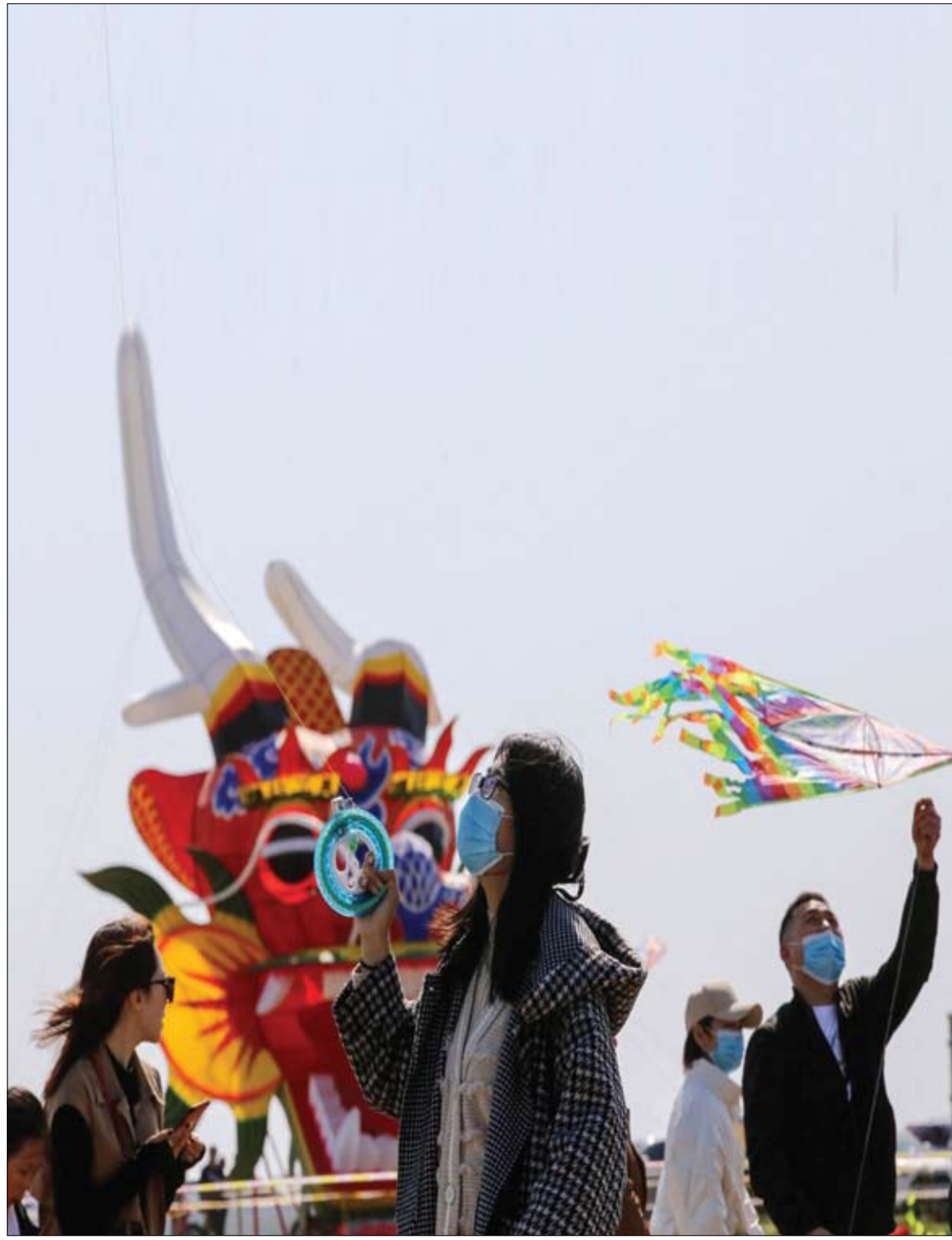
امرأة تحلق بطائرة ورقية خلال مهرجان ويفانغ الدولي للطائرات الورقية الثامن والثلاثين في مقاطعة شاندونغ شرقي الصين.

وقال غرانت: "بالإضافة إلى انسحاب هرمون الإستروجين، فإن اضطرابات النوم تقلل من استخدام الدهون. وهذا قد يزيد من احتمالية تخزين الدهون وبالتالي زيادة الوزن أثناء انقطاع الطمث".