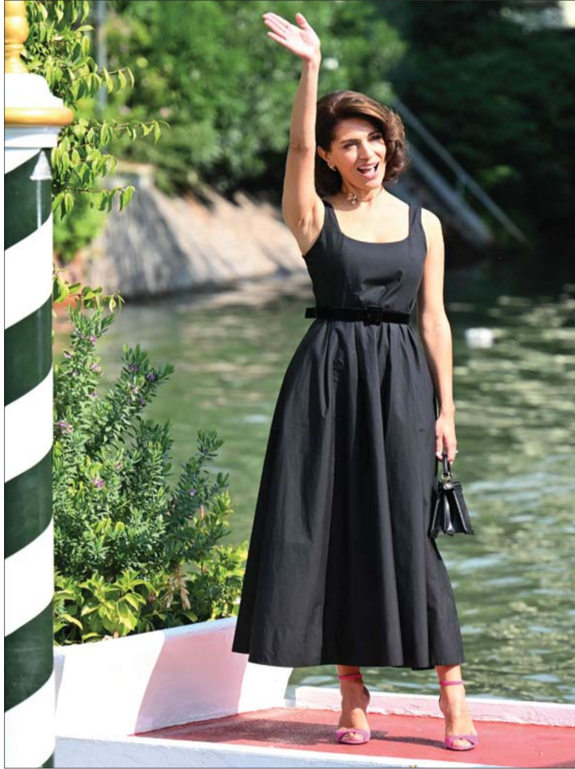
الممثلة الإيطالية كاترينا مورينو لدى وصولها إلى رصيف إكسلسيور خلال مهرجان البندقية السينمائي الدولي.