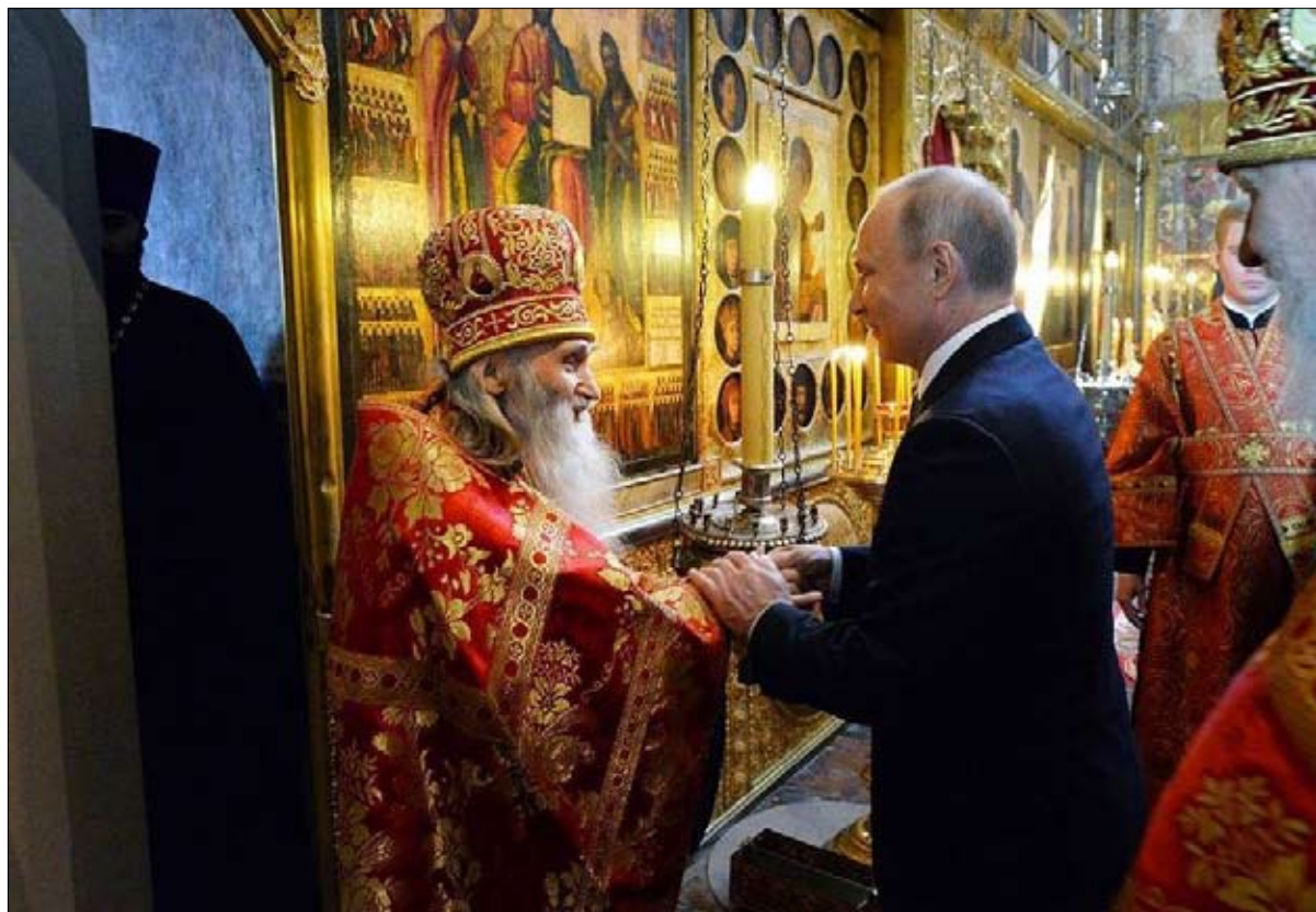
مقرب جدا من القيصر بوتين