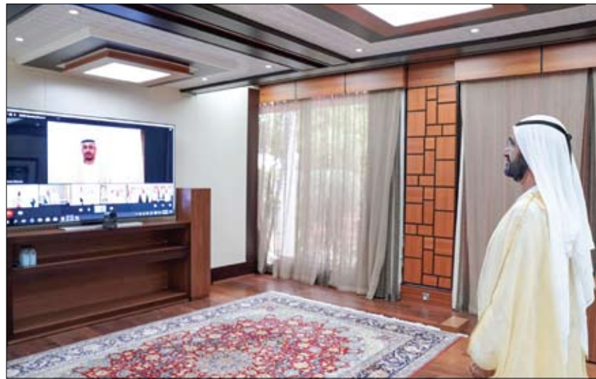
امام محمد بن راشد.. السفراء الجدد يؤدون اليمين القانونية (وام)

ساهمت دولة الإمارات في نقل شحنة تحتوي على 20 طنا من معدات الحماية الشخصية من شنغهاي إلى مخازن منظمة الصحة العالمية في المدينة العالمية للخدمات الإنسانية في دبي، وذلك لمساعدة المنظمة على تعزيز مخزونها الاستراتيجي في ضوء تفشي وباء كورونا المستجد، كوفيد-19، ودعم جهودها في مواصلة الاستجابة الإنسانية السريعة للدول المحتاجة. (التفاصيل ص2)