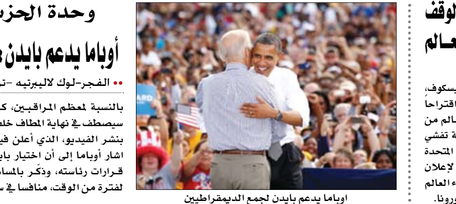
أوباما يدعم بايدن لجمع الديمقراطيين

الفجر-لوك لاليتيه - ترجمة خيرة الشيباني بالنسبة لمعظم المراقبين، كان من الواضح أن أوباما سيصطف في نهاية المطاف خلف نائبه السابق، ومع ذلك... بنشر الفيديو، الذي أعلن فيه دعمه لبايدن ومشيداً بفضائله، أشار أوباما إلى أن اختيار بايدن ككاتب للرئيس هو من أفضل قرارات رئاسته، وذكر بالمساهمات العديدة للرجل الذي كان لفترة من الوقت، منافساً في سباق الترشيح. (التفاصيل ص13)