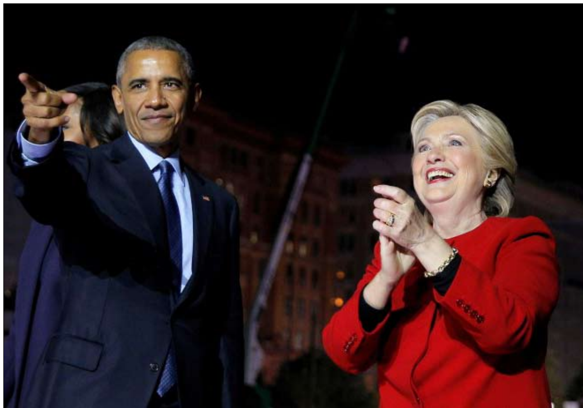
في 2016 فضل أوباما هيلاري على جو