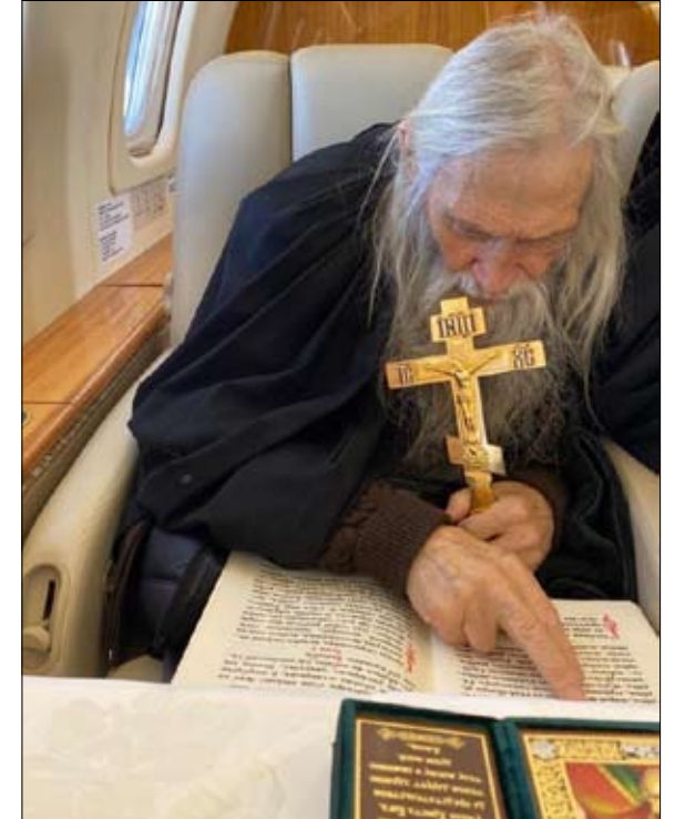
كل الطرق تؤدي إلى مقاومة الوباء

الرجل العجوز ذو اللحية الرمادية الطويلة والشعر المنساب الناعم يراجع كتاب الأديعية، جالساً على مقعد من الجلد الأبيض على متن طائرة خاصة وقد وزع من حوله مجموعة من الأيقونات. فجأة، يتطلع، يمسك صليبه الذهبي، يتردد للحظة، حتى يتأكد من أن المسيح قبالة النافذة، ثم ينحني متمتما صلاة، بينما تمر المباني تباعاً على الأرض.