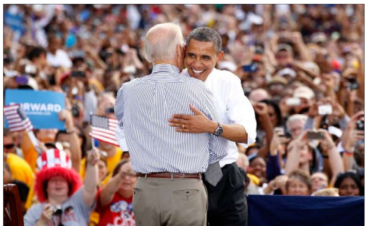
أوباما يدعم بايدن لجمع الديمقراطيين