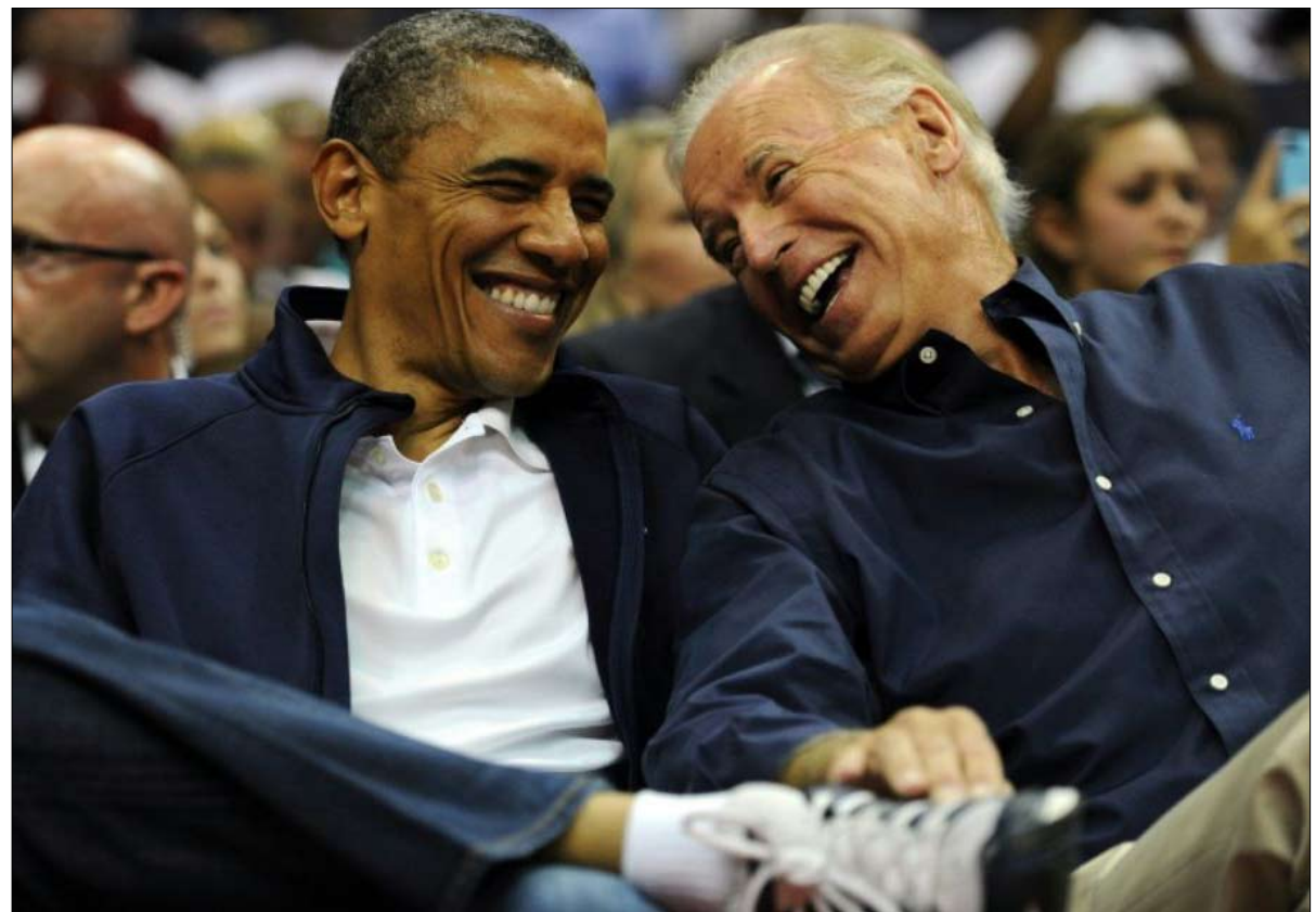
صداقة لا تحجب الخلاف والتباين

كانت أكبر. بالإضافة إلى ذلك، كان بايدن قد فقد حينها ابنه وخشي أوباما من أن يكون مضطرباً نفسياً للغاية لإدارة حملة طويلة.