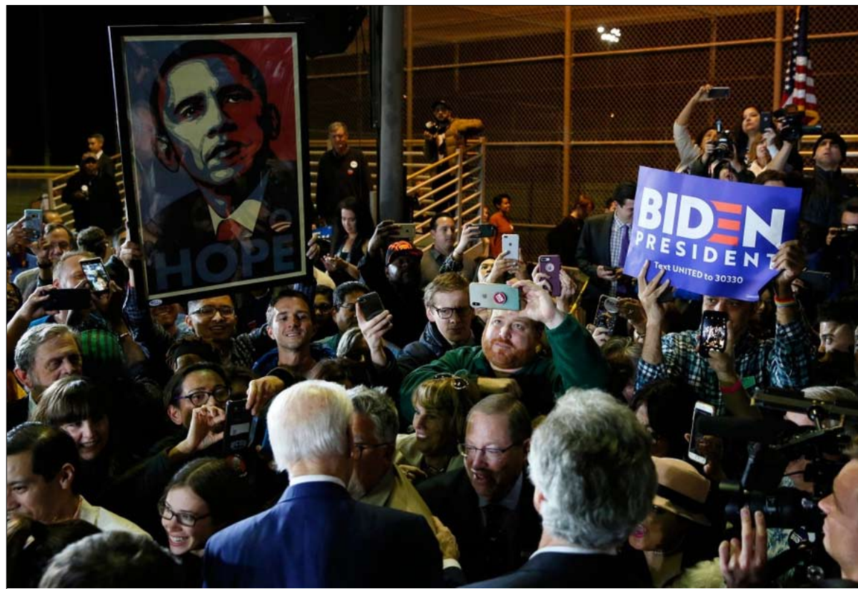
كان أوباما حاضراً كرمز في اجتماعات بايدن

للرئيس السابق أسباب جيدة للتردد منها مخاوف صادقة تتعلق بصحة بايدن