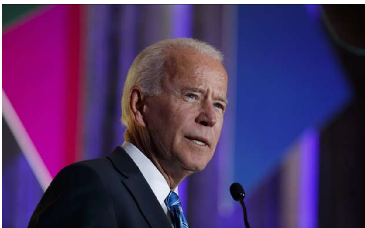
بايدن يحقق مكسباً جديداً