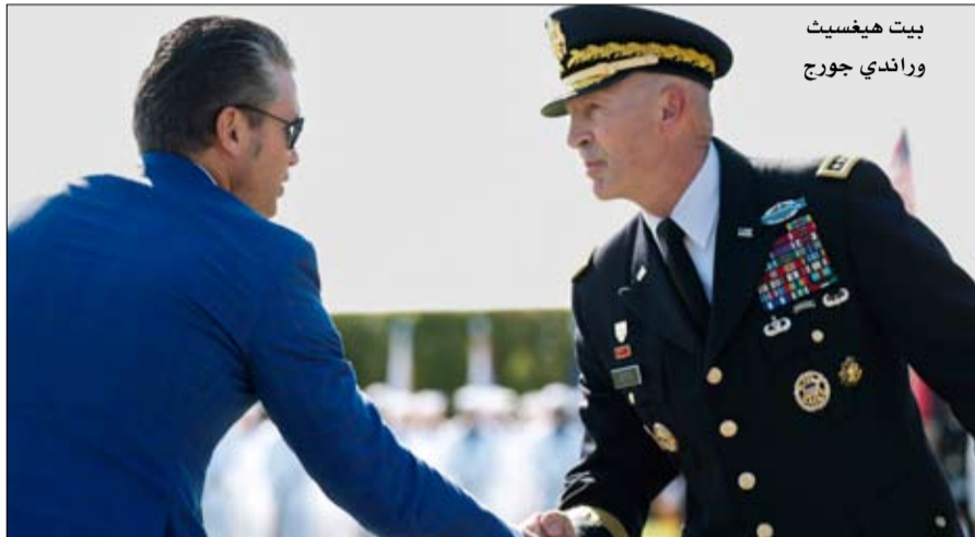
بيت هيغست و راندي جورج

الجيش الأمريكي، في 21 سبتمبر- 2023، وغادره قبل انتهاء ولايته، ليخلفه الجنرال كريستوفر لايف نائب رئيس الأركان والمساعد العسكري السابق للوزير هيغست. من هو راندي جورج؟ وُلد راندي جورج عام 1964 في الولايات المتحدة، وتخرج من الأكاديمية العسكرية الأمريكية عام 1988 كضابط مشاة، وتغيّب المعلومات حول نشأته وحياته الأسرية.