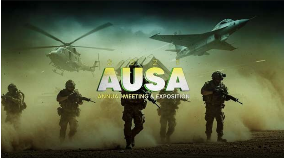
أبو ظبي - الفجر

أكدت دراسة بحثية حديثة صادرة عن مكتب تريندز «TRENDS» في الولايات المتحدة الأمريكية أن استراتيجية الأمن القومي الجديدة التي طرحها الرئيس دونالد ترامب، رغم ما يبدو عليها من طابع مغاير وتوجهات مختلفة، فإنها في الواقع تشترك في العديد من الموضوعات والسياسات والأساليب مع الإدارات الأمريكية السابقة، معتبرة أن لغته الصريحة واللفظية هي السبب في إعطاء انطباع مغاير للحقيقة. وأشارت الدراسة، التي أعدها بلال صعب، المدير التنفيذي الأول لمكتب «تريندز» في الولايات المتحدة، إلى مفهوم «السلام من خلال القوة» كنموذج بارز لهذه الاستراتيجية. وأوضحت الدراسة أن هذا المصطلح الذي يتصدر الاستراتيجية الجديدة ليس بالأمر المستحدث في فكر السياسة الخارجية الأمريكية؛ فبالرغم من افتراءه الشهير بالرئيس