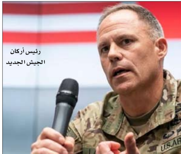
رئيس أركان الجيش الجديد

تصدر الجنرال راندي جورج رئيس أركان الجيش الأمريكي، واجهة الأحداث الأمريكية والعالمية، بعد كشف تفاصيل إقالته قسراً بقرار مفاجئ من وزير الحرب بيت هيغست، وأمريهغست، الخميس، جورج بالتحتيم، وتقديم تقاعد فوري، وسط صدمة هزت أوساطاً مختلفة في الولايات المتحدة، بسبب حساسية توقيت القرار الذي يأتي وسط حرب الجيش الأمريكي ضد إيران. تولى جورج، وهو ضابط مشاة مخضرم، رئاسة أركان