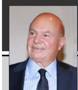
إيران تمارس إرهاب الدولة لتهدد استقرار المنطقة

مساعدة الولايات المتحدة في وقت الحاجة، بما في ذلك عدم تقديم المساعدة المباشرة بشأن مضيق هرمز وتقييد استخدام الولايات المتحدة لبعض الطائرات والمجال الجوي. وصرح مسؤولون أمريكيون بأن حلف شمال الأطلسي لا يمكن أن يكون «طريقاً ذاهباً واحداً، ويريد مسؤولون أوروبيون بأنهم لم يتلقوا طلبات أمريكية لتوفير أصول محدودة لأي مهمة لفتح المضيق ويتكون من تضارب مواقف واشنطن بشأن ما