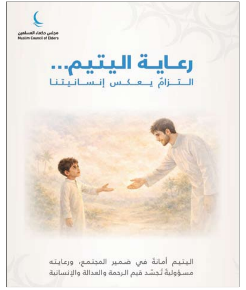
اليتيم أمانة في ضمير المجتمع، ورعايته مسؤولية تُجسد قيم الرحمة والعدالة والإنسانية

•• أبوظبي-وام: أكد مجلس حكماء المسلمين، برئاسة فضيلة الإمام الأكبر الأستاذ الدكتور أحمد الطيب، شيخ الأزهر الشريف، على حق الأيتام في الرعاية الكريمة، والاحتضان المجتمعي، وتقديم الدعم النفسي والتعليمي والاجتماعي لهم، بما يعينهم على بناء مستقبل آمن ومستقر، ويكفل لهم الاندماج الفاعل في مجتمعاتهم. وقال المجلس في بيان له بمناسبة يوم اليتيم، الذي يوافق أول جمعة من شهر أبريل من كل عام، إن رعاية اليتيم ليست مجرد عمل خيري أو التزام اجتماعي عابر، بل واجب ديني وإنساني أصيل، يعكس جوهر الرسالات السماوية، ويجسد أسس معاني الرحمة والتكافل والترامح بين الناس. وأوضح أن الاهتمام باليتيم يبدأ من صون كرامته الإنسانية، وتلبية احتياجاته الأساسية، وتهئية بيئة آمنة وحضرة لنموه النفسي والفكري والاجتماعي، بما يمكنه من تجاوز