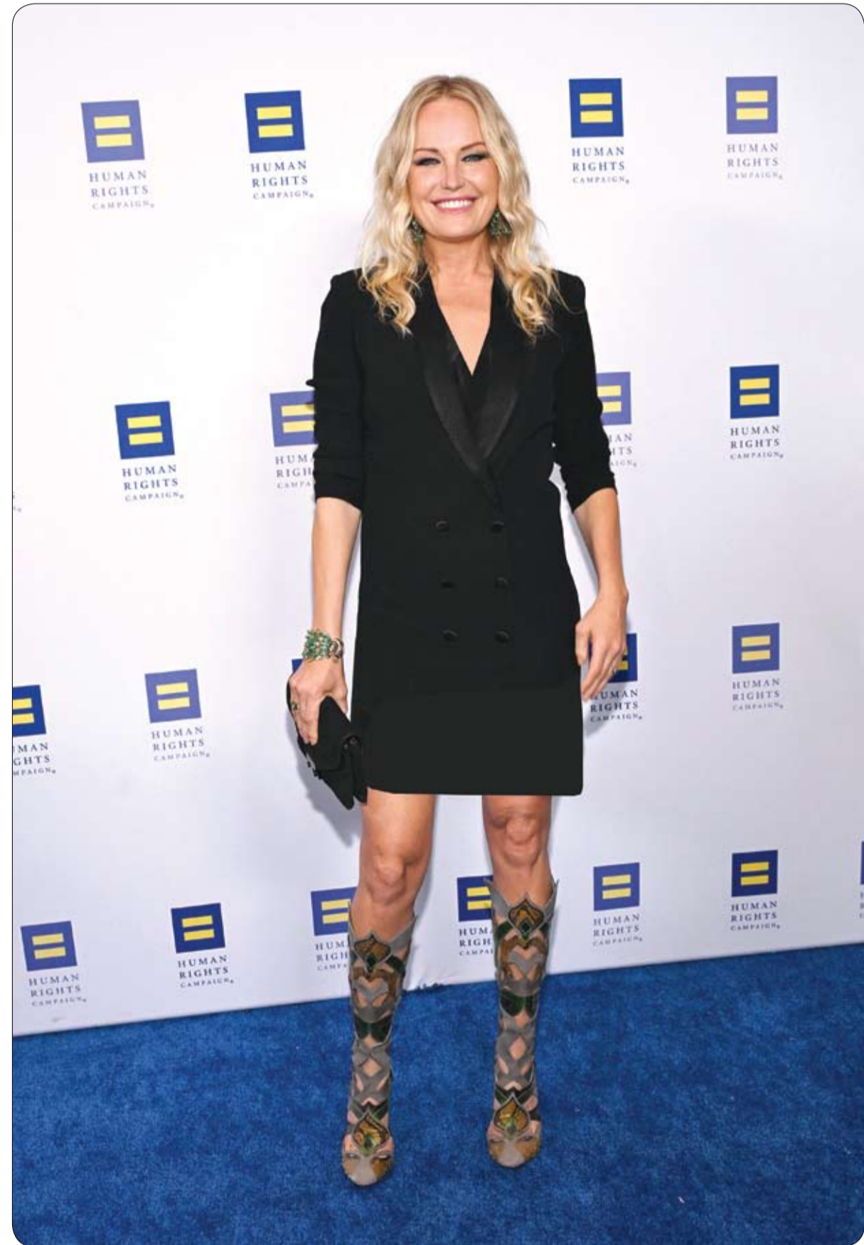
الممثلة السويدية الأمريكية مالفين أكرمان لدى حضورها حفل عشاء حملة حقوق الإنسان لعام 2026 في نوس أنجلوس

لقي مسن تركي مصرعه على دراجة هوائية بحادث لم يكن طرفاً فيه، عندما صدمت شاحنة عمود كهرباء أسمنتياً، ليقسط فوق الرجل المسكين ويقتله على الفور. وكان نيازيف زين (72 عاماً) على درجته الهوائية متوقفاً وينتظر الضوء الأخضر لإشارة مرور حمراء، في تقاطع طرق بمدينة أيدن غربي تركيا، عندما وقع الحادث.