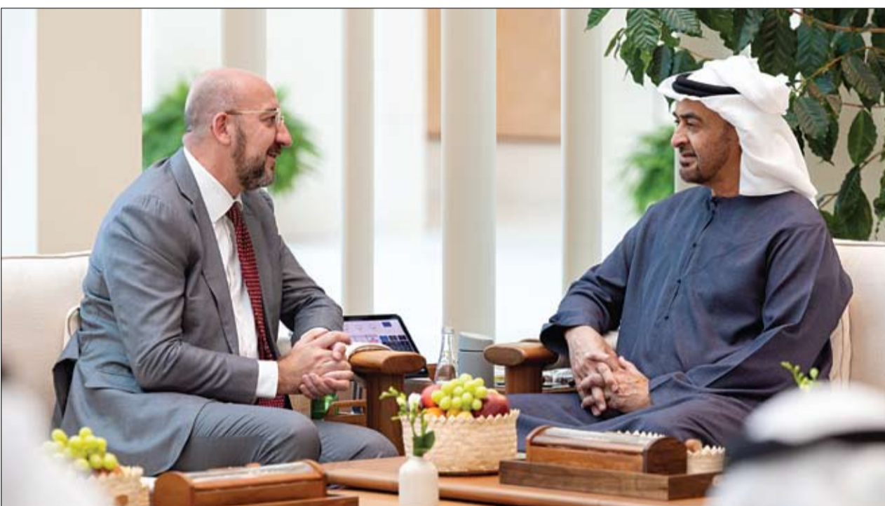
رئيس الدولة خلال مباحثاته مع رئيس مجلس الاتحاد الأوروبي

جاء ذلك خلال استقبال صاحب السمو رئيس الدولة لعمالي شارل ميشيل امس في قصر الشاطيء، حيث رحب سموه ببعاليه مؤكدا عمق العلاقات التي تربط دولة الإمارات والاتحاد الأوروبي، والحرص على تعزيز هذه العلاقات بما يدعم مصالحهما المتبادلة ويخدم السلام والتنمية على المستويين الإقليمي والعالمي. وتطرق اللقاء إلى قمة مجلس التعاون لدول الخليج العربية والاتحاد الأوروبي عقدها خلال شهر أكتوبر المقبل في بروكسل، وأهمية هذه القمة في دفع علاقات الجانبين إلى الأمام خاصة في المجالات الاقتصادية والتنموية ووضع الأسس لمزيد من التطور النوعي في مسار هذه العلاقات خلال السنوات المقبلة. كما استعرض سموه ورئيس المجلس الأوروبي عدداً من القضايا الإقليمية والدولية محل الاهتمام المشترك وفي مقدمتها المستجدات في منطقة الشرق الأوسط، مؤكداً في هذا الإطار أهمية التوصل إلى اتفاق بشأن وقف عاجل لإطلاق النار في قطاع غزة ما يتيح تقديم الدعم الإنساني الكلي لسكان القطاع وتخفيف معاناتهم، إضافة إلى ضرورة العمل على خفض التوتر في الضفة الغربية والدفع في اتجاه مسار للسلام الدائم والمستقر الذي يقوم على حل الدولتين. (التفاصيل ص2)