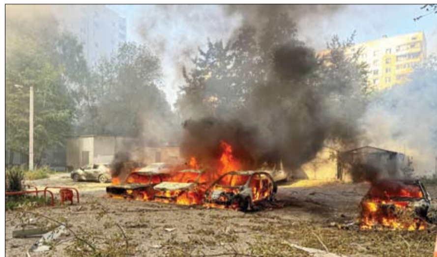
سيارات تحترق بعد غارة جوية روسية، في خاركيف، أوكرانيا.

وقالت الوزارة في بيان لها: خلال ليلة الخميس، تم إحباط محاولات نظام كييف لتنفيذ هجمات إرهابية باستخدام طائرات مسيرة ضد أهداف على الأراضي الروسية، وفقاً لوكالة أنباء سبوتنيك الروسية. وأضافت أن أنظمة الدفاع الجوي المناوية دمرت 18 طائرة مسيرة أوكرائية. تم إسقاط 11 طائرة مسيرة فوق أراضي منطقة بريانسك، و4 فوق منطقة كالوغا، وتم تدمير طائرتين سميرتين فوق أراضي جمهورية القرم، وواحدة في تصريحات تزيد حدة التوتر بين الاتحاد الأوروبي وروسيا، أعلن مسؤول السياسة الخارجية