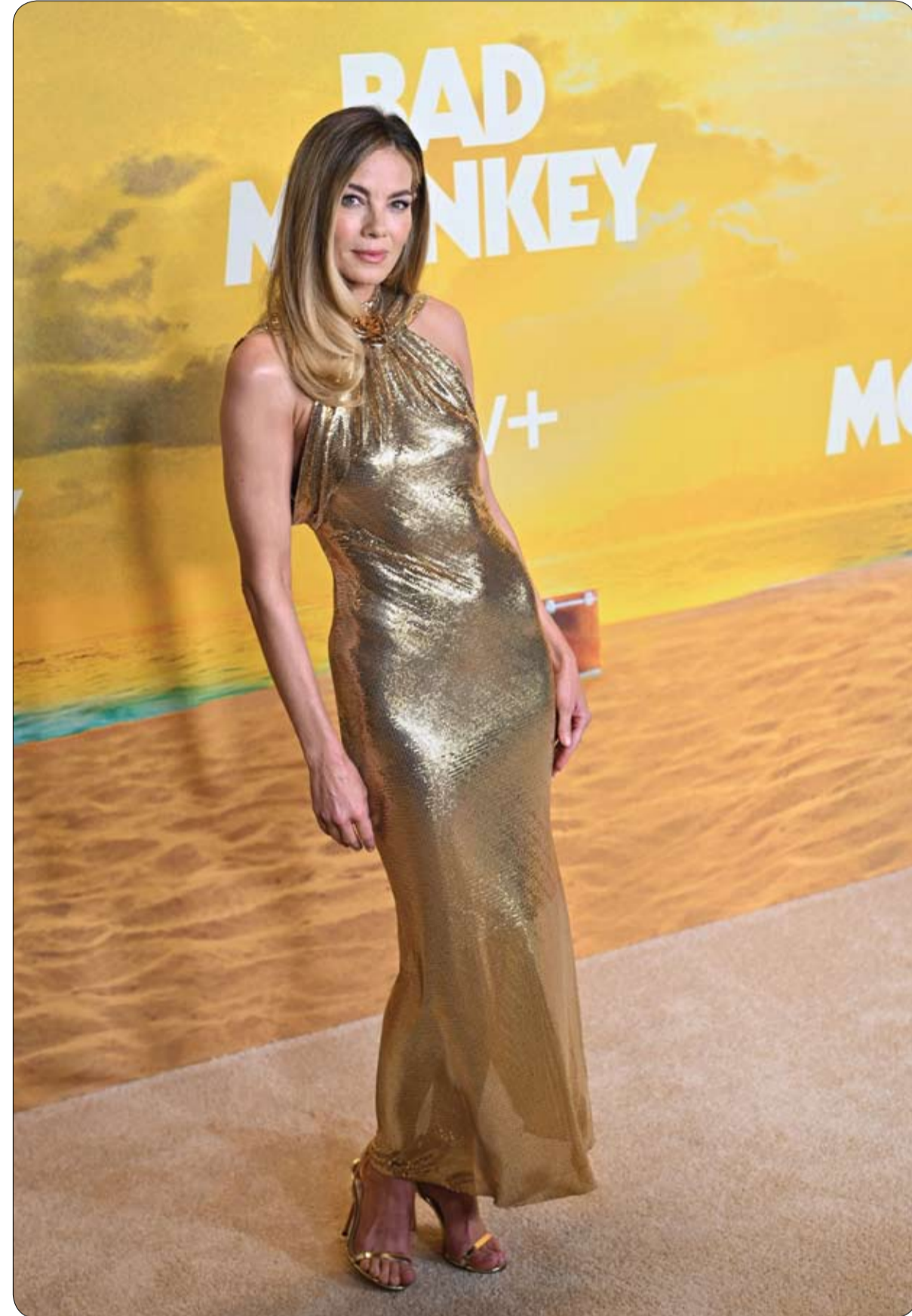
الممثلة الأمريكية ميشيل موناجان لدى حضورها العرض الأول لسلسل Bad Monkey في لوس أنجلوس.

وعادة ما تشكل الطرق الوعرة في المنطقة الجبلية تحدياً للسائقين، لأنها غالباً ما تكون ضيقة وخطيرة، ما يجعل من الصعب قيادة المركبات الكبيرة عبر المنحنيات الضيقة. وقال المتحدث باسم الشرطة شايليندرا تابا إن الحافلة المسجلة في الهند كانت متجهة إلى العاصمة كاتمندو من مدينة بوكارا السياحية، وعلى متنها نحو 40 هندياً. وأضاف أن رجال الإنقاذ انتشلوا 16 شخصاً من مياه نهر مازسانجدي في منطقة تانا هون، على بعد نحو 118 كيلومتراً من العاصمة.