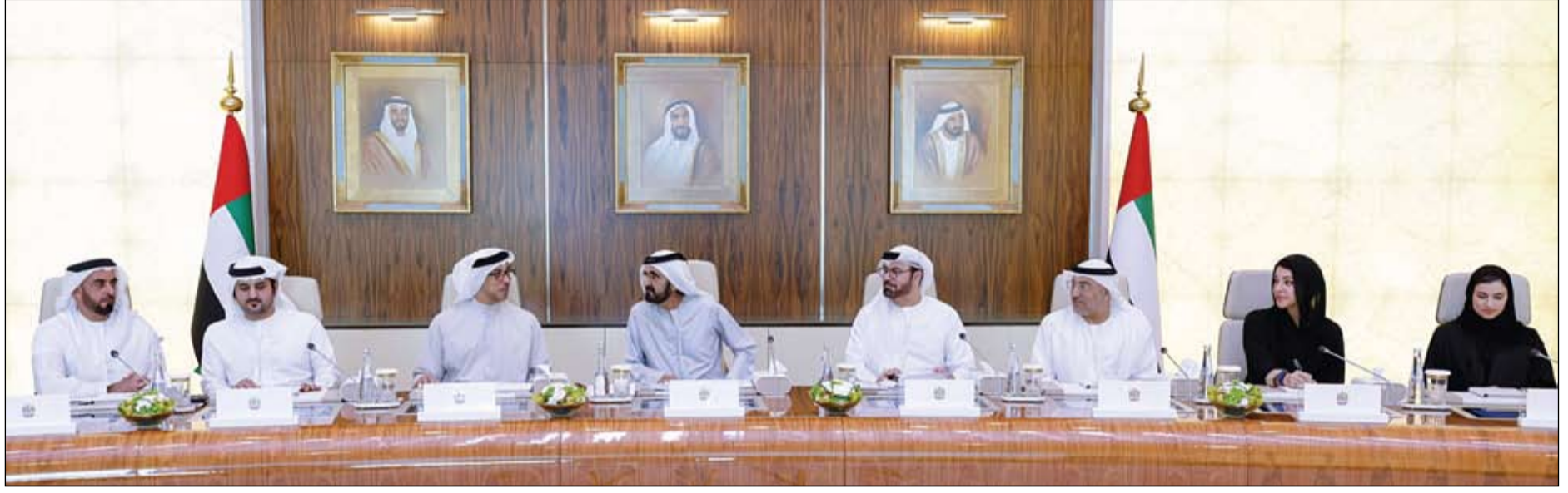
محمد بن راشد خلال ترؤسه اجتماع مجلس الوزراء

تحت رعاية كريمة من سمو الشبيخة فاطمة بنت مبارك (أم الإمارات) رئيسة الاتحاد النسائي العام رئيسة المجلس الأعلى للأمومة والطفولة الرئيسة الأعلى مؤسسة التنمية الأسرية.. يطلق الاتحاد النسائي العام الدفعة الرابعة من مبادرة الشبيخة فاطمة بنت مبارك لتمكين المرأة في السلام والأمن بالتعاون مع وزارة الدفاع وبالتنسيق مع مكتب الاتصال لهيئة الأمم المتحدة للمرأة في أبو ظبي. (التفاصيل ص6)