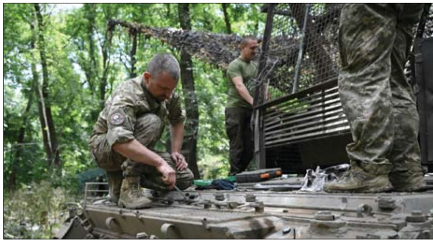
جنود أوكرانيون يقومون بصيانة دبابة T-72 في منطقة دوبيتسك.

المنطقة. هذا وقال ضابط بارز بالجيش الأوكراني، الاثنين، إن أوكرانيا قد تحتفظ ببعض الطائرات المقاتلة من طراز إف 16 التي من المقرر أن تتسلمها من حلفائها الغربيين في قواعد أجنتية، من أجل حمايتها من الضربات الروسية.