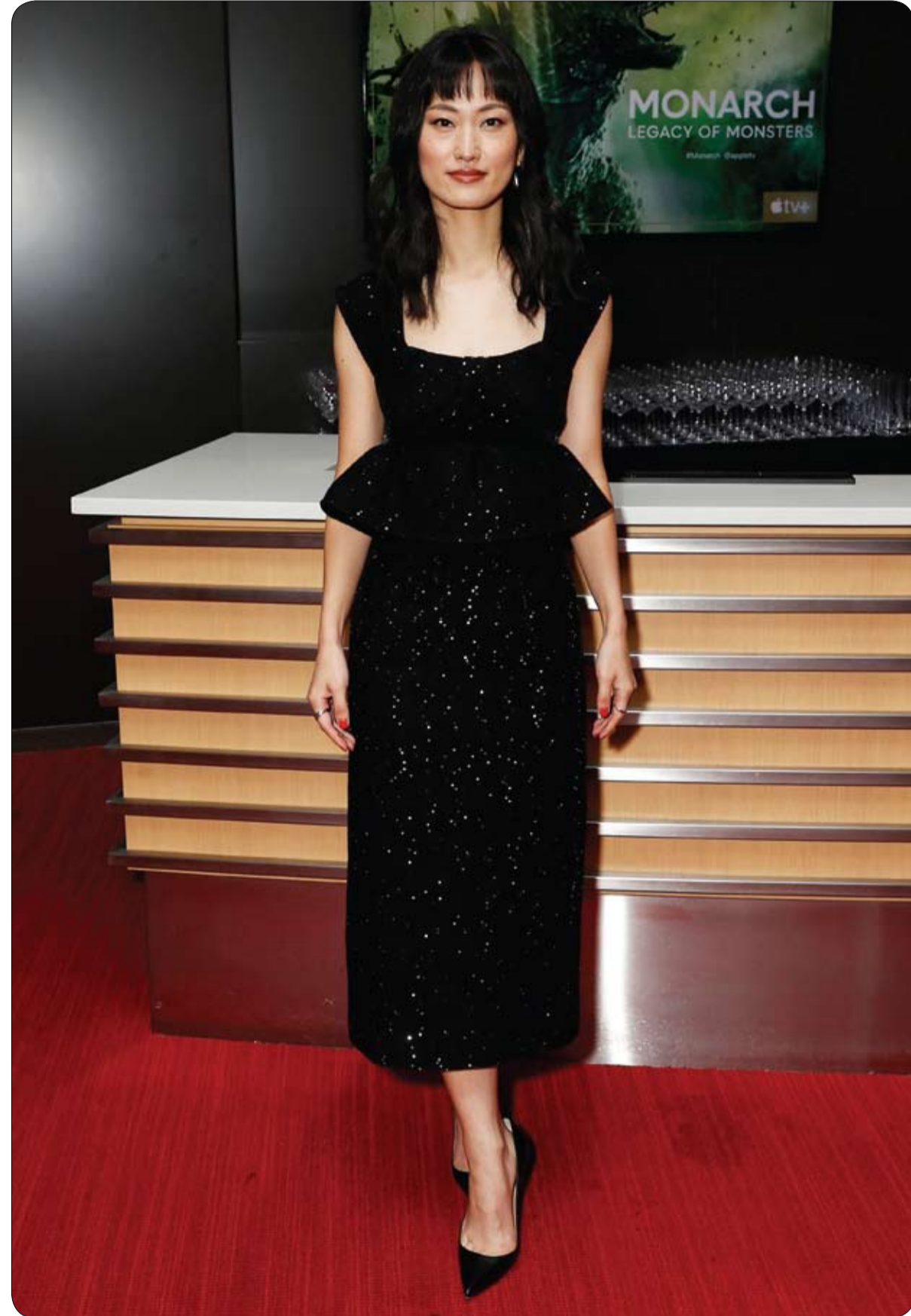
الممثلة اليابانية ماري ياماموتو لدى حضورها حدث Monarch, Legacy of Monsters في شمال هوليوود، كاليفورنيا.

أمسك الموظف بيد واحدة الرجل بقوة وأنقذه من السقوط في الشارع، حيث مرت شاحنة مسرعة كادت أن تؤدي بحياته لولا الإنقاذ.