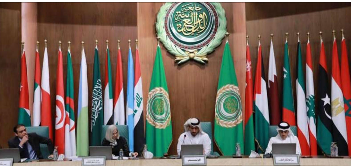
عدداً من مقترحات وتجارب والأنشطة التعليمية ومحو الأمية، في ضوء أهداف التنمية المستدامة 2030.