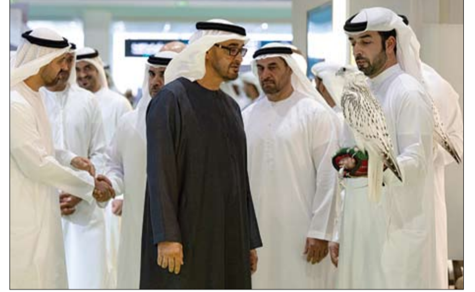
رئيس الدولة خلال زيارته معرض أبوظبي الدولي للصيد والفروسية

الذي جرى في قصر الشاطئ في أبوظبي - تحيات أخيه صاحب السمو الشيخ مشعل الأحمد الجابر الصباح أمير الكويت وتمنياته لدولة الإمارات دوام التقدم والرخاء. فيما حمل صاحب السمو الشيخ محمد بن زايد آل نهيان معاليه تحياته إلى أخيه سمو أمير الكويت وأطيب تمنياته لبلده وشعبه الشقيق مزيداً من النماء والازدهار في ظل قيادته الحكيمة. (التفاصيل ص3)