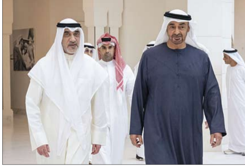
رئيس الدولة خلال استقباله الشيخ فهد يوسف سعود الصباح

تلقت صاحب السمو الشيخ محمد بن زايد آل نهيان رئيس الدولة حفظه الله، رسالة خطية من فخامة الدكتور محمد مويزو رئيس جمهورية المالديف تتصل بالعلاقات الثنائية بين البلدين. تسلم الرسالة، سمو الشيخ عبدالله بن زايد آل نهيان نائب رئيس مجلس الوزراء وزير الخارجية، لدى استقباله في أبوظبي، معالي موسى زمير وزير خارجية جمهورية المالديف. وجرى خلال اللقاء بحث العلاقات الثنائية بين البلدين وسبل تعزيزها، إضافة إلى مناقشة عدد من القضايا ذات الاهتمام المشترك. (التفاصيل ص2)