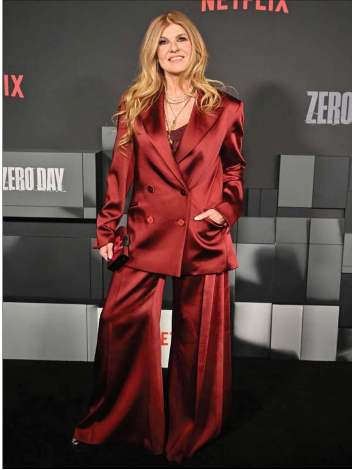
الممثلة الأمريكية كوني بریتون لدى حضورها العرض الأول لفيلم Zero Day على Netflix في مدينة نيويورك.