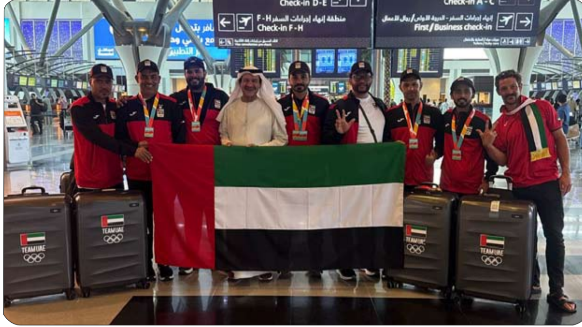
وكما هو معروف فان وفدنا الأولمبي رياضياً ورياضية يمثلون الإمارات المدرجة بالدورة وهي كرة القدم القوي والتقاط الأوتاد والشراع يشارك بوفد رياضي مكون من 77 في الرياضات الشاطئية الـ 8 وكرة اليد وكرة الطائرة وألعاب والسباحة والطيران الشراعي.

إهداء الإنجاز الذهبي إلى قيادتنا الرشيدة