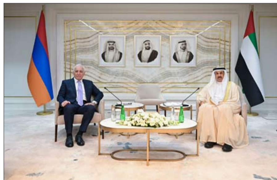
تنتقل الزيارات الثنائية بالعلاقات إلى مستوى أوسع وأرحب في مجالات كافة، وأن تفتح مسارات جديدة لتوثيق التعاون مما يعود بالنفع على البلدين والشعبين الصديقين.

وأشاد معالي بمستوى العلاقات البرلمانية التي تربط المجلس الوطني الاتحادي بالجمعية الوطنية الأرمينية وأهميتها في تنسيق المواقف والرؤى والتوجهات حيال مختلف القضايا ذات الاهتمام المشترك والاستفادة من التجربة الرائدة لدى البرلمانيين في مجال الاختصاص التشريعي والرقابي. ومن جهته أكد فخامة فاهاجن خاتشاتوريان رئيس جمهورية أرمينيا على أهمية العلاقات الثنائية والبرلمانية ودورها في تعزيز العلاقات الثنائية، لاسيما الاقتصادية والثقافية، آملاً أن