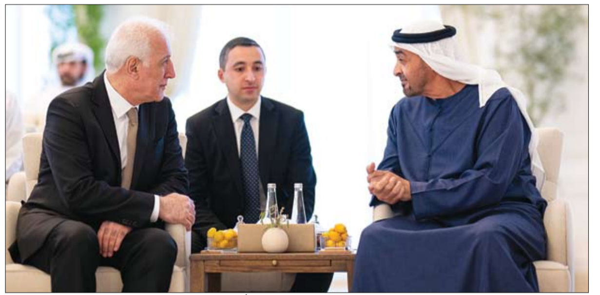
رئيس الدولة خلال مباحثاته مع رئيس أرمينيا

ترأس سمو الشيخ منصور بن زايد آل نهيان، نائب رئيس الدولة، نائب رئيس مجلس الوزراء، رئيس ديوان الرئاسة، رئيس مجلس إدارة صندوق أبو ظبي للتنمية، الاجتماع الأول لمجلس إدارة الصندوق لعام 2025، والذي عقد بقصر الوطن في أبو ظبي، بحضور أصحاب المعالي والسعادة أعضاء المجلس.