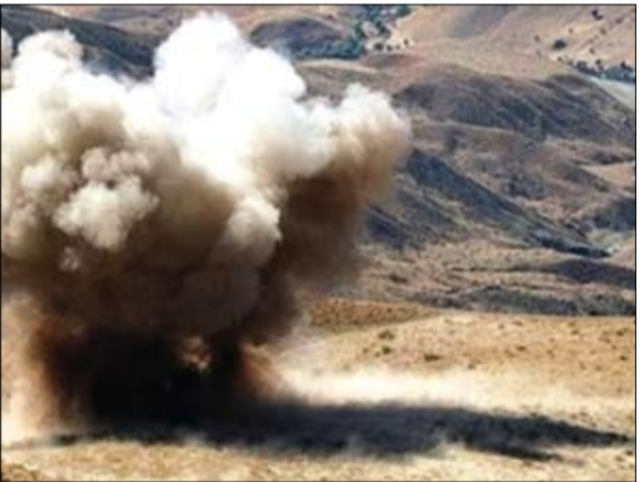
عملية إرهابية جديدة