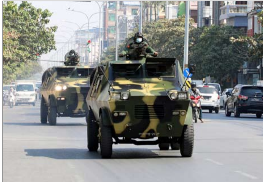
واشنطن تتهم رسمياً العسكريين بتنفيذ «انقلاب»

عاشت منذ استقلالها العام 1948 تحت حكم ديكتاتورية عسكرية على مدى خمسين عاما. واعتبر فرنسيس وايد وهو مؤلف كتب عن البلاد أن "الشعب يدرك إلى أي حد يمكن أن يستخدم الجيش العنف وعدم اكرامه بالسلمة الدولية، وهذا يمكن أن يكبح الرغبة في التعتية". الأربعاء نشرت صحيفة "غلوبال نيوليت أوف ميانمار" الخاضعة لسيطرة الدولة، تحذيرا من المنظمات وسائل الإعلام ينشر شائعات على شبكات التواصل الاجتماعي. "وحذرت من القيام بمثل هذه الأعمال، داعية السكان إلى "التعاون". عاشت منذ استقلالها العام 1948 تحت حكم ديكتاتورية عسكرية على مدى خمسين عاما. واعتبر فرنسيس وايد وهو مؤلف كتب عن البلاد أن "الشعب يدرك إلى أي حد يمكن أن يستخدم الجيش العنف وعدم اكرامه بالسلمة الدولية، وهذا يمكن أن يكبح الرغبة في التعتية". الأربعاء نشرت صحيفة "غلوبال نيوليت أوف ميانمار" الخاضعة لسيطرة الدولة، تحذيرا من المنظمات وسائل الإعلام ينشر شائعات على شبكات التواصل الاجتماعي. "وحذرت من القيام بمثل هذه الأعمال، داعية السكان إلى "التعاون".