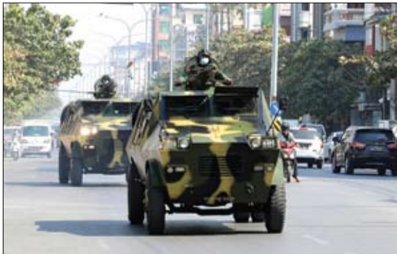
دوريات مستمرة لقوات الجيش في بورما

رهن الاحتجاج بعد اعتقالهم يوم الاثنين، وكذلك عدد غير معروف من المسؤولين من ذوي الرتب الدنيا والنشطاء السياسيين في أنحاء البلاد. وفي وقت سابق من الأربعاء، قال الحزب إن مكاتبه في عدة مناطق من البلاد تعرضت للمهاجمة، وتمت مصادرة وثائق وأجهزة كمبيوتر وأجهزة كمبيوتر محمولة.