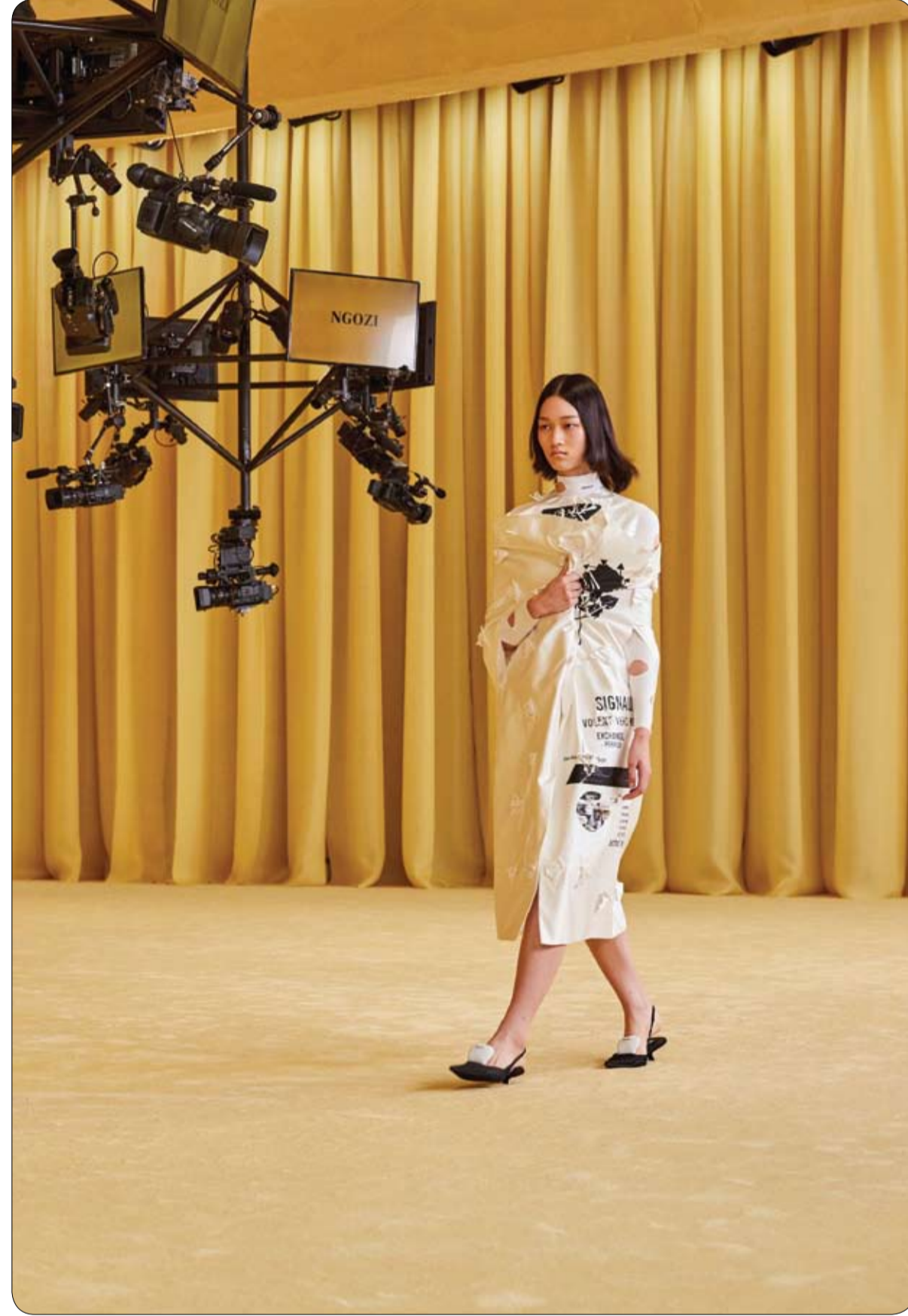
عارضة أزياء تقدم إبداعاً من مجموعة Prada لربيع وصيف 2021 النسائية في ميلانو، إيطاليا.