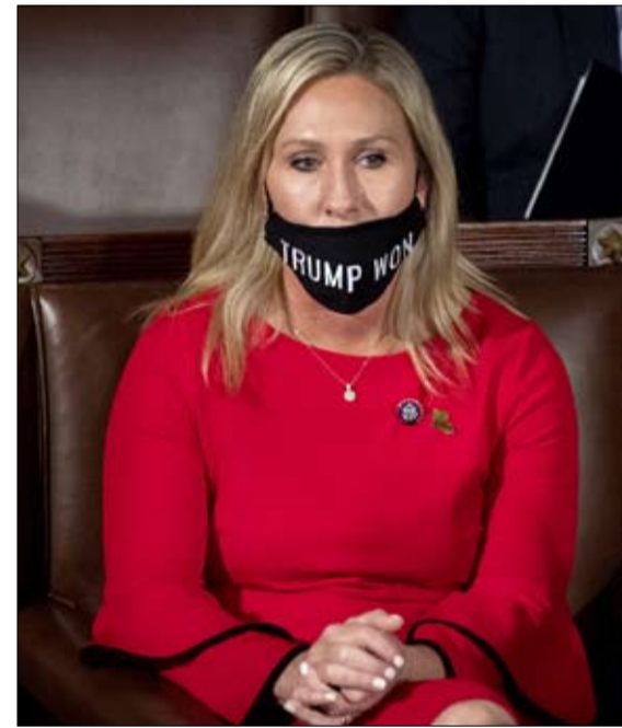
ماجوري تايلور جرين مشكلة للجمهوريين

ومندذت أكدت سيدة الأعمال أن الحركة لا "تتملأ". الجمهورية المنتخبة حديثاً، ليست المعجبة الوحيدة بـ "كيو" التي تجلس في الكونجرس. فقد تم انتخاب لورين بوبيرت، وهي سيدة أعمال، 34 عاماً، في نوفمبر الماضي، وهذه المرة في الدائرة الثالثة في كولورادو. وقد صرحت، على وجه الخصوص، في برنامج حوارى على الإنترنت، إنها تتمنى أن تكون نظريات المؤامرة لحركة كيو انون حقيقية لأن ذلك سيعني أن "أمريكا أصبحت أكبر وازدادت قوة".