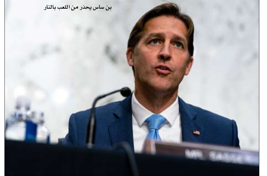
بن ساس يحذر من اللعب بالنار

لكن سيدة الأعمال، 46 عاماً، والتي ورثت شركة إنشاءات عن والدها، عُرفت من قبل في عالم السياسة بدعمها لحركة كيو انون، "فرصة العمر" في رأيها. تمثل حركة كيو انون مجموعة من نظريات المؤامرة الوهمية، وتعتقد أن الرئيس السابق دونالد ترامب كان يواجه سراً شبكة من الديمقراطيين المنتخبين وهوليوود ونجوم الإعلام المتخرفين في طائفة شيطانية تتحرش جنسياً بالأطفال. وقالت ماجوري تايلور غرين في مقطع فيديو عام 2017 لم يعد من الممكن مشاهدته، وفقاً لصحيفة واشنطن بوست: "أعتقد أن لدينا الرئيس الذي سيقوم بذلك".