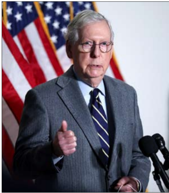
ميتش مكنويل وحديث عن سرطان

بالنار من أجل جمع الأصوات: "اعتقد العديد من قادة الحزب والمستشارين أنهم يستطيعون التبشير بالدستور والعزم إلى كيو