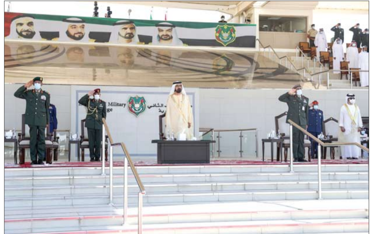
رعى حفل تخريج الدورة الـ 45 من المرشحين الضباط في كلية زايد الثاني العسكرية بالعين