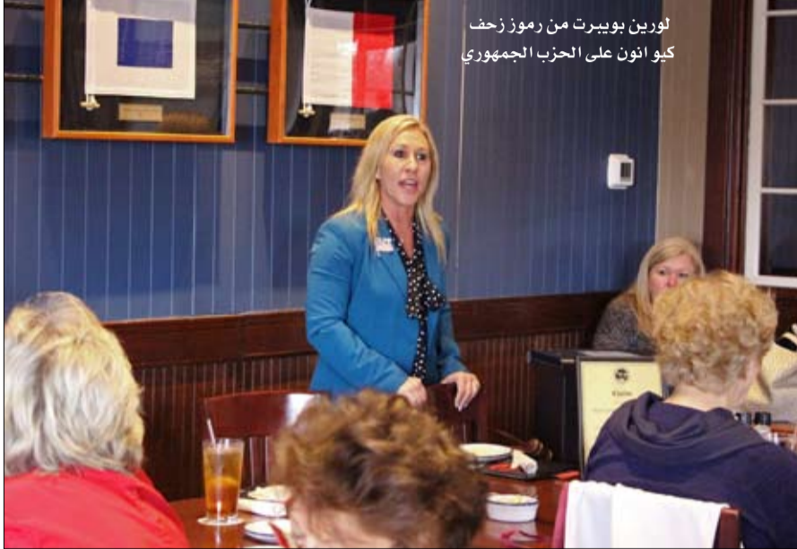
لورين بوبيرت من رموز زحف كيو انون على الحزب الجمهوري

وقال ميتش مكنويل، زعيم الأقلية الجمهورية في مجلس الشيوخ، لصحيفة ذي هيل الثلاثة، إن "الأكاذيب الغربية ونظريات المؤامرة" كانت "سرطاناً للحزب الجمهوري"، دون ذكر ماجوري تايلور غرين. ومع ذلك، ربما تكون قيادة الحزب قد فقدت السيطرة على هؤلاء