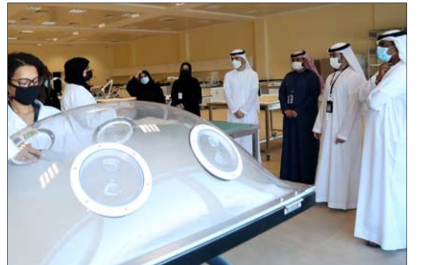
أشاد بالدور الذي يؤديه في حفظ ذاكرة الوطن