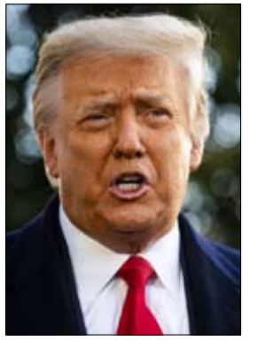
على قطب التعدين الإسرائيلي دان جيرتار.

على قطب التعدين الإسرائيلي دان جيرتار. كانت وزارة الخزانة قد فرضت العقوبات في ديسمبر كانون الأول 2017 ويونيو حزيران 2018 متهمه جيرتار باستغلال صداقته