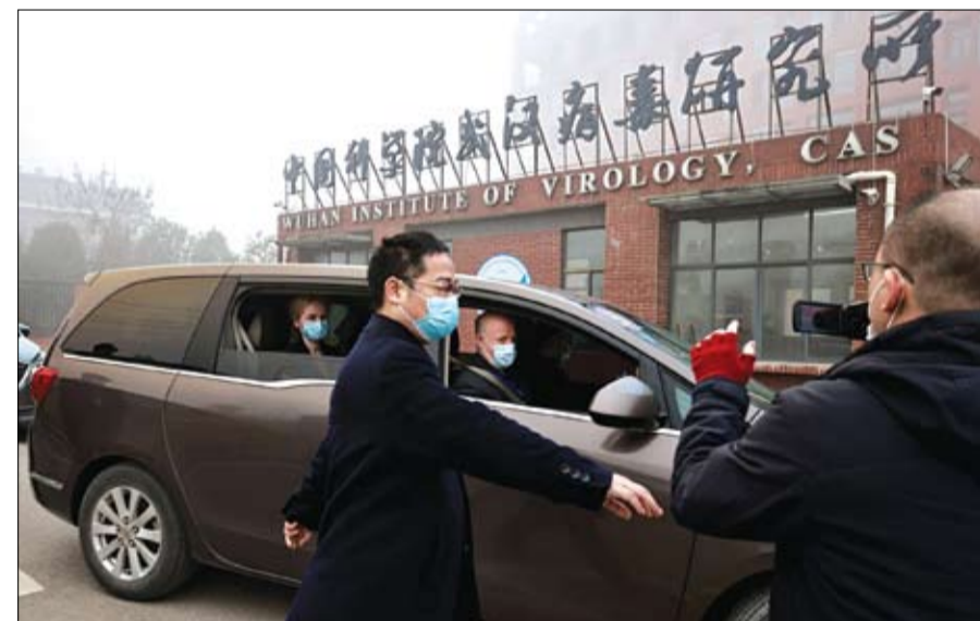
أعضاء فريق منظمة الصحة العالمية لدى وصولهم إلى معهد ووهان لعلم الفيروسات

إلى ذلك، قال فريق منظمة الصحة العالمية في ووهان الذي يحقق في أصول كورونا إنهم حصلوا على بيانات لم يرها أحد