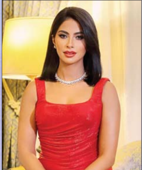
قانون الوصاية بعد وفاة الأب أو الزوج.

أيام قليلة تفصلنا عن انطلاق الماراثون الرمضاني المقبل ٢٠٢٣، وحرصت الشركة المتحدة للخدمات الإعلامية هذا العام على مشاركة عدد كبير من النجمات في أعمال متنوعة ما بين الاجتماعية والصعيدية والكوميديا، وذلك سواء في الأعمال الـ ٣٠ حلقة أو ذات الـ ١٥ حلقة، منهم يسرا، منى زكي، ياسمين عبد العزيز، ودنيا سمير غانم.