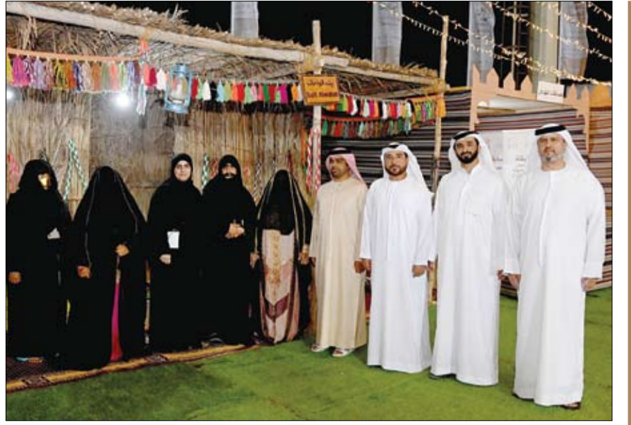
ينظمه نادي تراث الإمارات