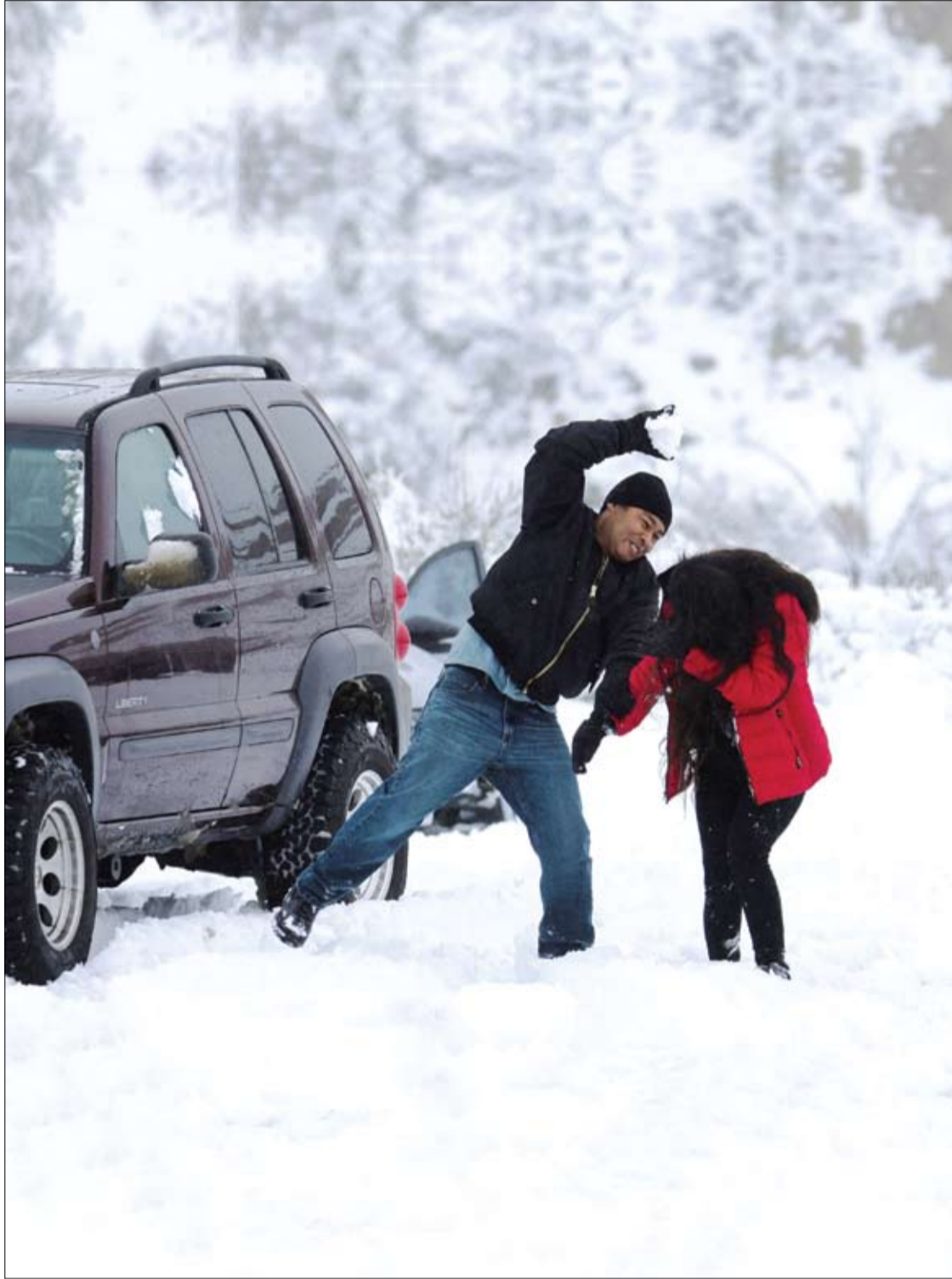
رجل وامرأة يلعبان كرة الثلج في فيلان، كاليفورنيا، الولايات المتحدة.

يمكن أن يؤدي انخفاض تناول السوائل والكافيين إلى انخفاض حجم البول وزيادة تركيز البولي، مما يساهم في تكوين الحصوات. منعت الفيئات هو مركب مضاد للأكسدة موجود في الحبوب الكاملة والمكسرات والأطعمة الأخرى التي يمكن أن تؤدي إلى زيادة امتصاص الكالسيوم وإفراز الكالسيوم في البول. يقول الدكتور رول: "قد يكون تغيير نظامك الغذائي للوقاية من حصوات الكلى أمراً صعباً للغاية، وبالتالي، فإن معرفة العوامل الغذائية الأكثر أهمية لمنع تكرار حصوات الكلى يمكن أن يساعد المرضى ومقدمي الخدمات على معرفة ما يجب تحديده أو تجنبه".