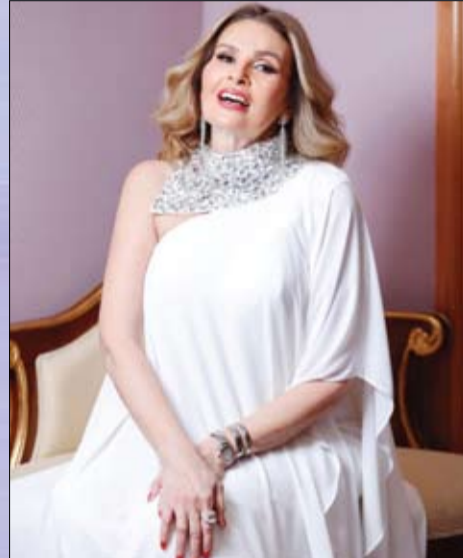
أحداثه حول نادرة السيدة الصعيدية التي تخوض صراعا شرسا مع عائلة زوجها بعد وفاته وترفض الاستسلام لحرمانها من الميراث، وتخوض حربا من أجل الحصول على حقوقها.

مسلسل "عملة نادرة" تأليف مدحت العدل وإخراج مائدو العدل وإنتاج شركة العدل جروب للمنتج جمال العدل وبطولة نبلي كريم، جمال سليمان، جومانا مراد، أحمد عيد، كمال أبو رية، فريدة سيف النصر، ندا موسى، محمد لطفي، على الطيب، مريم الخشت، نهى صالح، ومحمد فهم، رمزي العدل، وهشام عاشور، بالإضافة إلى عدد كبير من الفنانين الشباب.