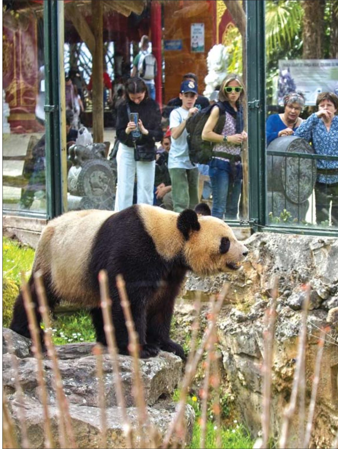
زوار ينظرون إلى ذكر الباندا يوان منغ الذي يقف داخل حظيره في حديقة حيوان بوفال وسط فرنسا حيث سيغادر إلى الصين في 4 يوليو.