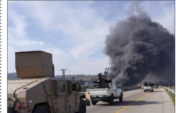
الدخان يتصاعد بينما تتجه القوات السورية نحو المعركة ضد المتطرفين.

قوات الأمن السورية تدفع بمزيد من التعزيزات إلى جبلة عمليات تشييط ضد فلول نظام الأسد في اللاذقية وطرطوس •• دمشق-وكالات: أفادت سلطات الأمن السوري، الجمعة، ببدء عمليات تشييط واسعة ضد فلول النظام السابق في اللاذقية وطرطوس. فيما سيطرت القوات السورية على مركز محافظة طرطوس واللاذقية وتستعد لدخول الأرياف، مضيفاً أن القوات السورية بسطت سيطرتها على مركز محافظة اللاذقية. ودفعت قوات الأمن السورية بمزيد من التعزيزات إلى جبلة، فيما الاشتباكات لا تزال مستمرة في مناطق عدة بجبلة بالساحل السوري. وأشار مراسلنا إلى أن هجمات فلول النظام السوري السابق والكمائن كانت منسقة ومخطط لها، مؤكداً أن الحملة الأمنية الحالية في سوريا ضد فلول الأسد هي الأكبر. ويعتقد هذه التطورات، نقلت وكالة الأنباء السورية سانا، عن مصدر أمني، بفرص حظر للتجوال في مدن محافظة طرطوس واللاذقية وطرطوس. إلى ذلك شهدت الساعات الماضية