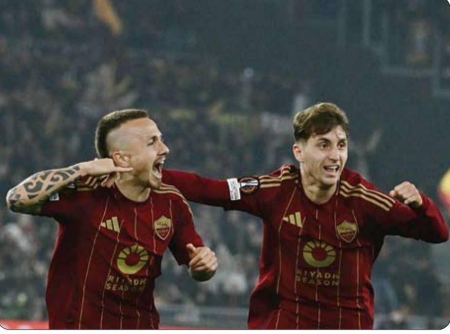
حافظ نادين فقط على شباهما وبودو جليمت النرويجي، كما نظيفة خلال مباريات هذا الدور شهد هذا الدور تسجيل هدفين أشهر قضاة الملاعب 23 بطاقة وهما أي زاد الكمار الهولندي، عكسين، وهدفا واحدا من علامة صفراء، و3 بطاقات حمراوات من