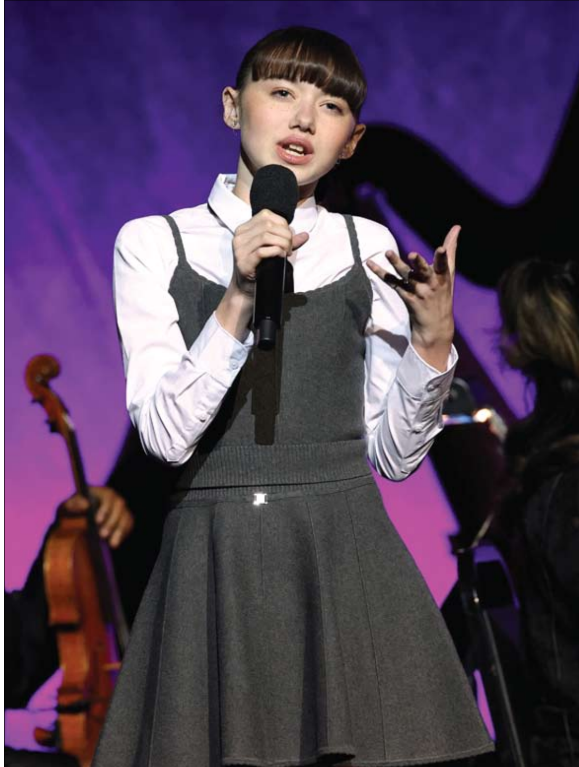
الممثلة الأمريكية فيوليت ماكجرو تتحدث على خشبة المسرح خلال عرض سينماكون 2025 بقصر سينرز في لاس فيجاس.

تشير الدكتورة تاتيانا بوبروفا أخصائية الطب العام إلى أن فصل الربيع يرتبط بالنسبة للعديد من الناس، بفترة تفاقم الأمراض المزمنة. ووفقا لها، تتفاقم في هذا الوقت، أمراض الجهاز الهضمي، مثل التهاب المعدة، والتهاب المرارة، وقرحة المعدة وقرحة الاثني عشر. ويرجع ذلك إلى الطبيعة الدورية للأمراض نفسها، والتغيرات في طول اليوم، والنظام الغذائي، بالإضافة إلى العوامل الداخلية، وفي مقدمتها نقص الفيتامينات والمعادن بعد فصل الشتاء. وتصحح الطبيبة للحفاظ على الجسم، بتناول كميات صغيرة من الطعام، وتجنب الصيام والإفراط في تناول الطعام، والحد من الأطعمة الحارة والدهنية والمقلية والمدخنة، والمشروبات الكحولية والغازية. مشيرة إلى أنه من الأفضل اتباع نظام غذائي يحتوي على الخضروات والفاكهة الطازجة والحبوب والأسماك واللحوم الخالية من الدهون. ويجب مراجعة الطبيب في حال ظهور أعراض تفاقم المرض. وقد تتفاقم أمراض القلب والأوعية الدموية نتيجة لتغيرات الطقس، وتغير مستوى الضغط الجوي، والعواصف المغناطيسية مثل ارتفاع مستوى ضغط الدم، وعدم انتظام ضربات القلب، والذبحة الصدرية. وإذا كان الشخص يعاني من مشكلات في القلب والأوعية الدموية فعليه مراقبة مستوى ضغط الدم وتجنب الإرهاق والتوتر كلما أمكن ذلك. كما عليه الحصول على قسط كاف من النوم والتجوال في الهواء الطلق. وتقول: "تتفاقم في الربيع أمراض الجهاز العضلي الهيكلي أيضا - التهاب المفاصل، وهشاشة العظام، وداء العظم الغضروفي. قد يكون هذا بسبب انخفاض حرارة الجسم (طقس الربيع خادع)، وتقلبات الضغط الجوي، وانخفاض النشاط البدني في الشتاء. كما أن مستوى فيتامين D، ينخفض جدا في فصل الشتاء، وهذا يلعب دورا أيضا".