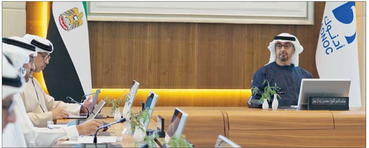
رئيس الدولة خلال ترؤسه اجتماع مجلس إدارة أدنوك السنوي (وام)

أكد صاحب السمو الشيخ محمد بن راشد آل مكتوم نائب رئيس الدولة رئيس مجلس الوزراء حاكم دبي رعاه الله، أن دبي تواصل اليوم ترسيخ دورها كلاعب رئيس وشريك مؤثر في تشكيل ملامح مستقبل التجارة العالمية برصيد كبير من الخبرة واستثمار متواصل في تطوير قدرات بنية تحتية قوية ومنظومة