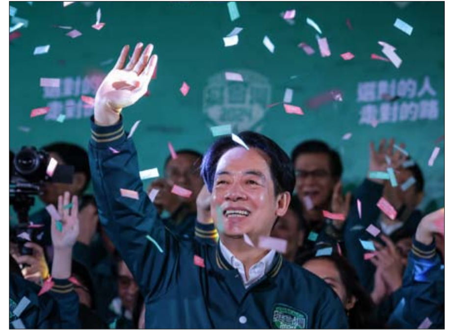
رئيس تايوان الجديد المؤيد بشدة للانفصال

الدخول في علاقات مع الدول الأخرى. من خلال استيفاء المعايير الأربعة التي حددتها اتفاقية مونتيبيديو لعام 1933، أن تكون مأهولة بالسكان بشكل دائم، وأن تسيطر على منطقة محددة، وأن تتمتع إلى الفاتيكان. لكن في القانون