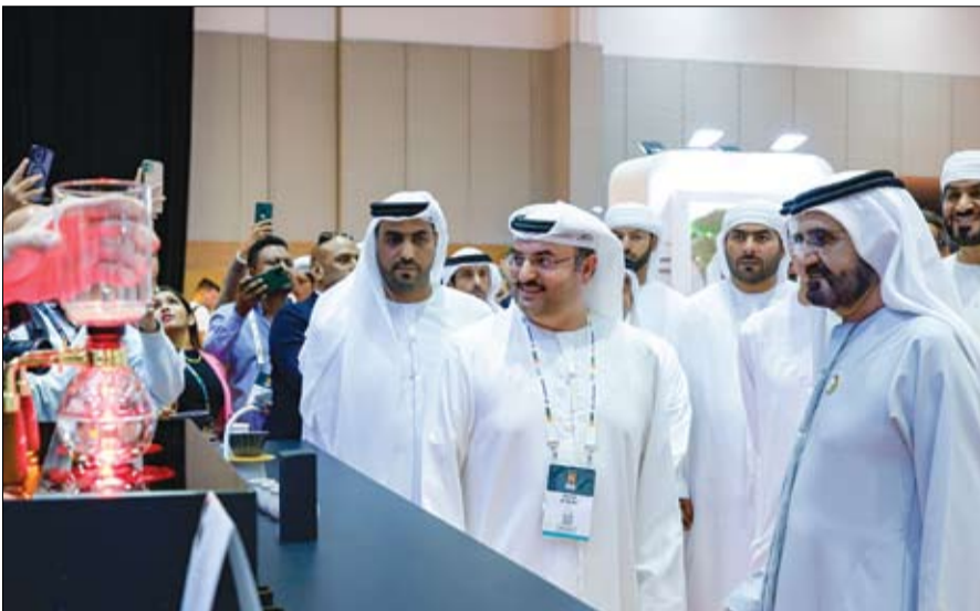
محمد بن راشد خلال زيارته معرض «عالم القهوة» (وام)

28 صفحة - الثمن درهمان أسسها عام 1975 عبيد حميد المزروعى