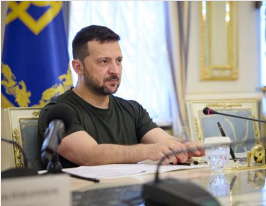
زيلينسكي يجري تغييراً وزارياً كبيراً