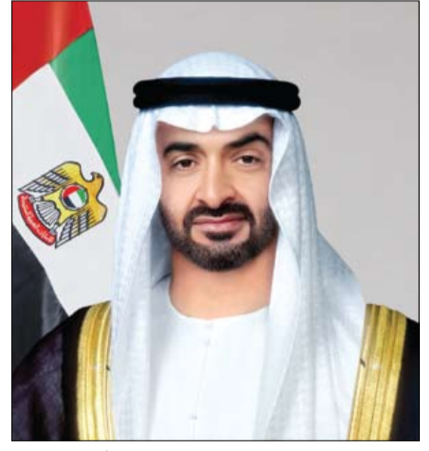
بدء العمليات التشغيلية للمحطة الرابعة في براكة

محمد بن راشد: الاستثمار في الإنسان الإماراتي هو استثمار بالمستقبل •• أبوظبي-وام: أكد صاحب السمو الشيخ محمد بن راشد آل مكتوم نائب رئيس الدولة رئيس مجلس الوزراء حاكم دبي رعاه الله، أن دولة الإمارات بقيادة صاحب السمو الشيخ محمد بن زايد آل نهيان رئيس الدولة حفظه الله، أصبحت مركزاً عالمياً لتطوير التجارب المبتكرة، ومنصة للتكنولوجيا المتقدمة وحلول الذكاء الاصطناعي، انطلاقاً من رؤية مستقبلية تتبنى استدامة التطوير والاستثمار في الإنسان الإماراتي بقيادة التغيير، والارتقاء بمستويات العمل الحكومي ونقلها إلى مراحل متقدمة. جاء ذلك خلال لقاء سموه، الرؤساء التنفيذيين للذكاء الاصطناعي في حكومة دولة الإمارات، وتكريم سموه خريجي برنامج قيادات حكومة الإمارات 2023، وذلك في قصر الوطن بالعاصمة أبوظبي، بحضور سمو الشيخ منصور بن زايد آل نهيان نائب رئيس الدولة نائب رئيس مجلس الوزراء رئيس ديوان الرئاسة، وسمو الشيخ حمدان بن محمد بن راشد آل مكتوم ولي عهد دبي، نائب رئيس مجلس الوزراء، وزير الدفاع.