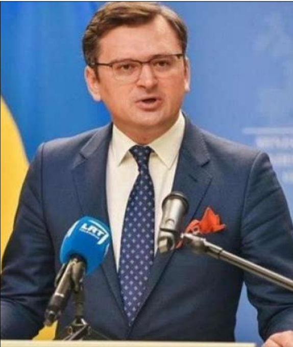
دميترو كوليبا أهم شخصية حكومية أعلنت استقالته