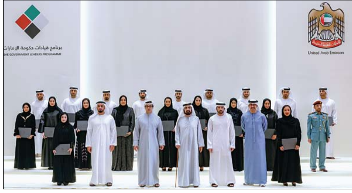
التقى الرؤساء التنفيذيين للذكاء الاصطناعي في الحكومة الاتحادية.. وشهد تخريج برنامج قيادات الحكومة

برئاسة منصور بن زايد.. الوزاري للتنمية يطالع على عدد من المشاريع والسياسات الحكومية •• أبوظبي-وام: ترأس سمو الشيخ منصور بن زايد آل نهيان نائب رئيس الدولة نائب رئيس مجلس الوزراء رئيس ديوان الرئاسة، اجتماع المجلس الوزاري للتنمية الذي عُقد في قصر الوطن في أبوظبي، واستعرض المجلس عدداً من المشاريع والسياسات الحكومية المقدمة من الوزارات والجهات الاتحادية. وناقش المجلس، خلال اجتماعه، عدداً من المشاريع الهادفة إلى تنظيم قطاعي الإعلام والتعليم في الدولة، والسياسات الجديدة في قطاع الطيران المدني، إضافة إلى مشاريع قوانين وقرارات تنظيمية في مجال المشتريات الحكومية والمنظومة الضريبية والقطاع المصرفي والاقتصادي في الدولة. الإمارات تصدر المشهد الإنساني في اليوم الدولي للعمل الخيري بدعم لا محدود لغزة •• أبوظبي-وام: في إطار احتفائها باليوم الدولي للعمل الخيري الذي يصادف 5 سبتمبر، تواصل دولة الإمارات العربية المتحدة تأكيد دورها الريادي في دعم القضايا الإنسانية حول العالم، وعلى رأسها (عملية الفارس الشهم 3) في قطاع غزة. وتجسد قيم العطاء الإماراتية من خلال المساعدات الإغاثية والطبية التي تقدمها الفرق التطوعية على مدار الساعة لدعم الأشقاء الفلسطينيين.