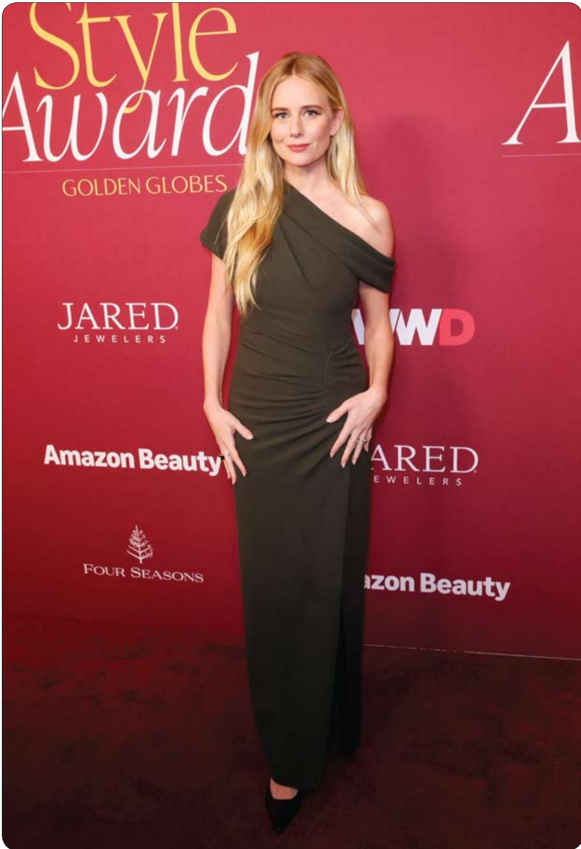
الممثلة الأمريكية جوستين لوب تحضر حفل توزيع جوائز WWD Style للفولدن غلوب في لوس أنجلوس.

وفي مقابلة مع قناة كيه.سي.أي.إل نيوز التلفزيونية قال إنه غير متأكد مما إذا كان حديثه مع خدمة عملاء وايمو كان مع إنسان حقيقي أم مع إنسان آلي يعمل بالذكاء الاصطناعي التوليدي، وشعر أنه لم يحصل على أي دعم من جانب الشركة في مواجهة ذلك الموقف الغريب.