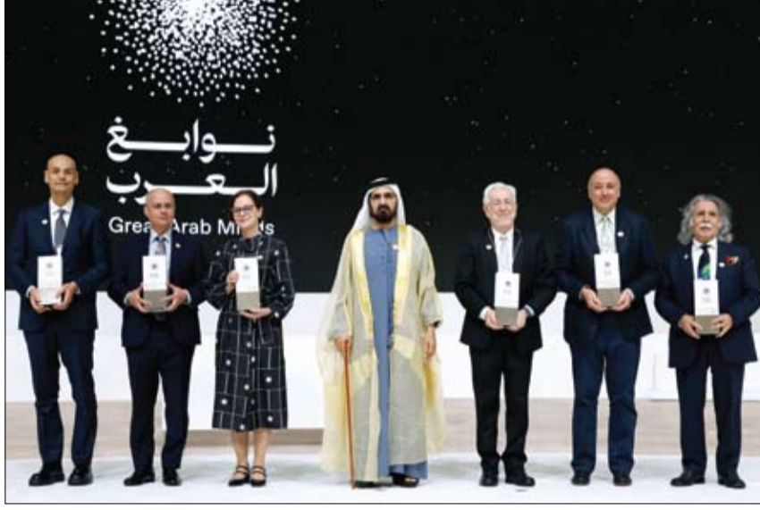
محمد بن راشد خلال تكريمه الفائزين بجائزة «نوابغ العرب» (وام)

حضر اللقاء معالي خلدون خليفة المبارك، رئيس جهاز الشؤون التنفيذية؛ ومعالي سيف سعيد غباش، الأمين العام للمجلس التنفيذي لإمارة أبوظبي؛ وريما المقرب المهيري، عضوة مجلس أمناء جامعة زايد، المديرية التنفيذية للشؤون الاستراتيجية بجهاز الشؤون التنفيذية لإمارة أبوظبي. (التفاصيل ص5)