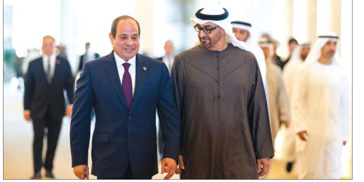
رئيس الدولة خلال استقباله الرئيس المصري

كرم صاحب السمو الشيخ محمد بن راشد آل مكتوم، نائب رئيس الدولة رئيس مجلس الوزراء حاكم دبي، رعاه الله، في متحف المستقبل بدبي، الفائزين الستة بلقب جائزة نوابغ العرب 2024، المبادرة الأكبر من نوعها عربياً لتكريم العقول العربية المتميزة ودعمها (التفاصيل ص2)