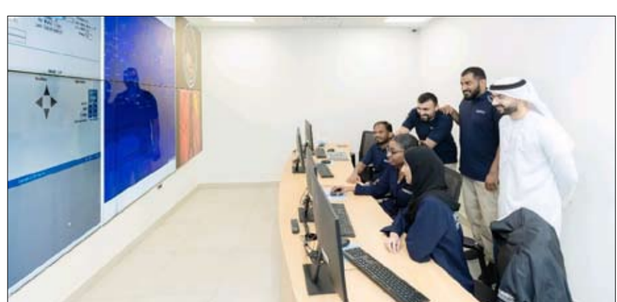
للمختبرات التي تلزم بمطابقات صارمة وتظهر تميزاً في ممارساتها

مشروع "العين سات-1"، المشروع المشترك بين المركز وجمعية "GRSS" التابعة لمعهد مهندسي الكهروإلكترونيات، حيث أن القمر عبارة عن مقعب بحجم 3 وحدات متطورة، سيعزز من قدرات الجامعة في الاستعمار عن بُعد ويوفر بيانات دقيقة تساهم في دعم مشاريع التنمية المستدامة في مختلف القطاعات. يذكر أن المركز الوطني لعلوم وتكنولوجيا الفضاء، يلعب دوراً محورياً في تعزيز المبادرات الفضائية، وسد الفجوات بين القطاعات الأكاديمية والتقنيات المستخدمة في صناعة الفضاء. ويظهر هذا الالتزام والطموح في