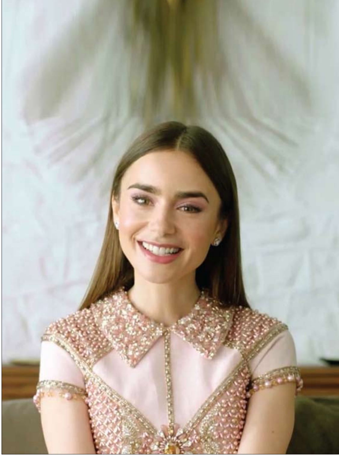
الممثلة ليلي كولينز في لقطة من حفل توزيع جوائز نقابة ممثلي الشاشة السنوي السابع والعشرين في لوس أنجلوس.

وقال البروفيسور: "ليس بإمكاننا إلى حد الآن الخروج باستنتاجات حول فاعلية اللقاح، لكنه استعرض نتائج ملحوظة. وفي حال تأكيدها في المرحلة الثانية للاختبار السريري يمكن أن نطبق علاجنا ليرتقي إلى صف العلاجات الكيميائية والإشعاعية".