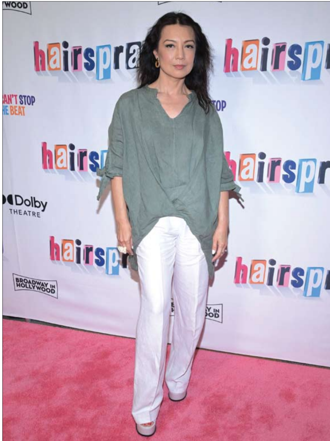
الممثلة مينج نا وين لدى حضورها العرض الليلي الافتتاحي للمسرحية الموسيقية «مشتبات الشعر» في لوس أنجلوس.