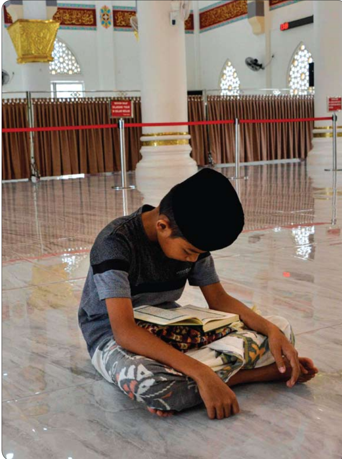
طفل يقرأ القرآن خلال شهر رمضان المبارك بمسجد في باندا آتشيه الأندونيسية.

سيكون الأطفال متحمسين للعب مع الحروف في مواد وأحجام مختلفة، قومي بشراء مجموعات من الرغوة والحروف المغناطيسية وبطاقات الحروف وكتل الحروف، واطلبي الوصول إليها بسهولة لطفلك للمس، والتنقل، والفرز، والترتيب. اصنعي الحروف بنفسك من عصي المصاصة، أو ورق الصنفرة، أو الستائر وقوم، أو لوازم الحرف الأخرى إذا كنت على ميزانية.