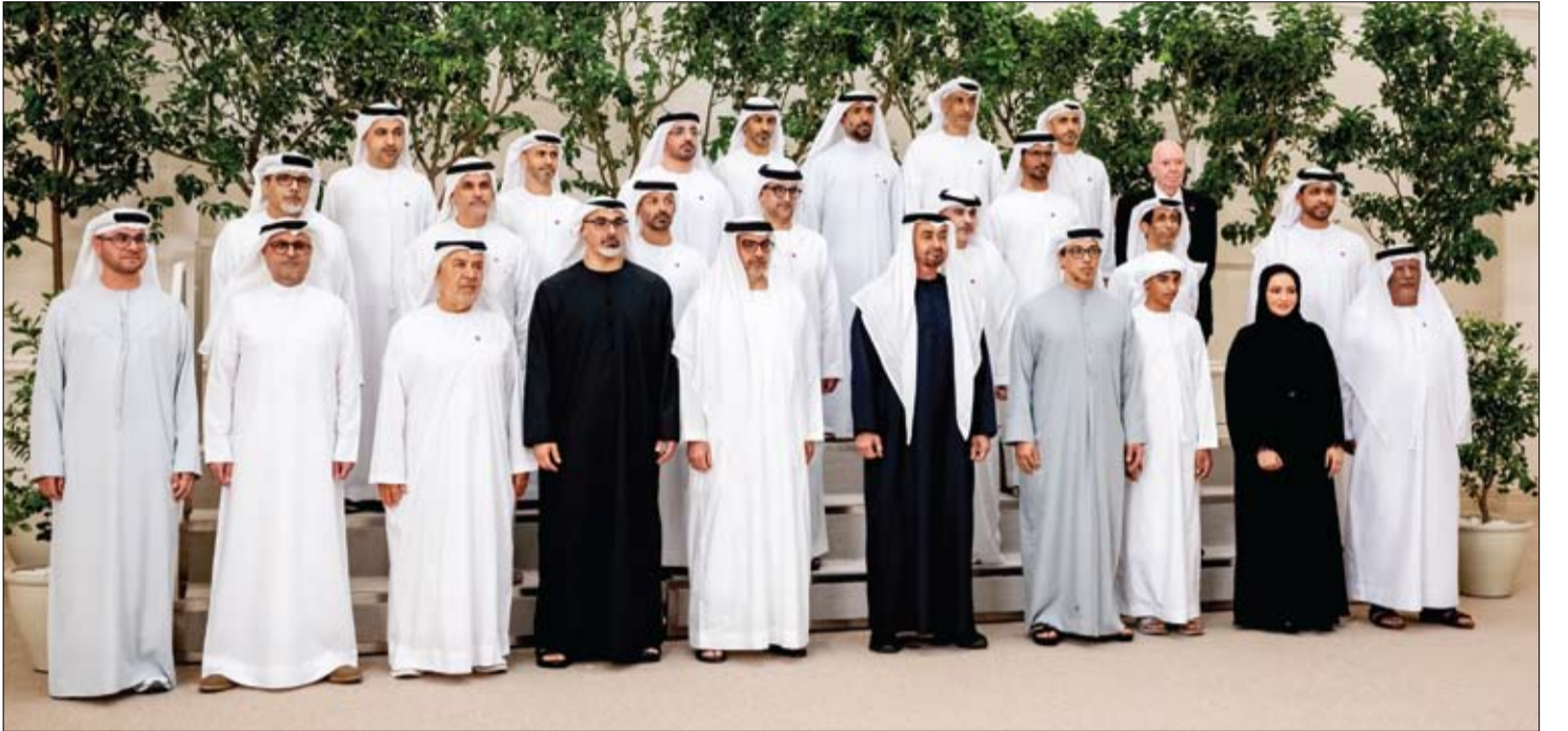
رئيس الدولة خلال استقباله وفد جهاز أبوظبي للاستثمار بمناسبة احتفاء الجهاز هذا العام بمرور 50 عاماً منذ تأسيسه بحضور منصور بن زايد وخالد بن محمد بن زايد (وام)

•• أبوظبي- وام: استقبل صاحب السمو الشيخ محمد بن زايد آل نهيان رئيس الدولة «حفظه الله» الفريق الركن خالد درج الشريعان رئيس الأركان العامة للجيش الكويتي في إطار العلاقات والتعاون العسكري بين البلدين الشقيقين. وجرى خلال اللقاء بحث عدد من الموضوعات ذات الاهتمام المشترك، واستعراض أوجه التعاون والتنسيق العسكري بين الجانبين، إلى جانب تبادل وجهات النظر حول المستجدات والقضايا ذات الصلة بالشأن العسكري والأمني. (التفاصيل ص ٢)