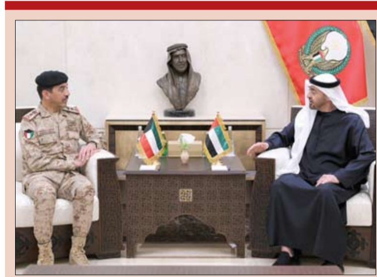
رئيس الدولة خلال استقباله رئيس الأركان العامة للجيش الكويتي (وام)