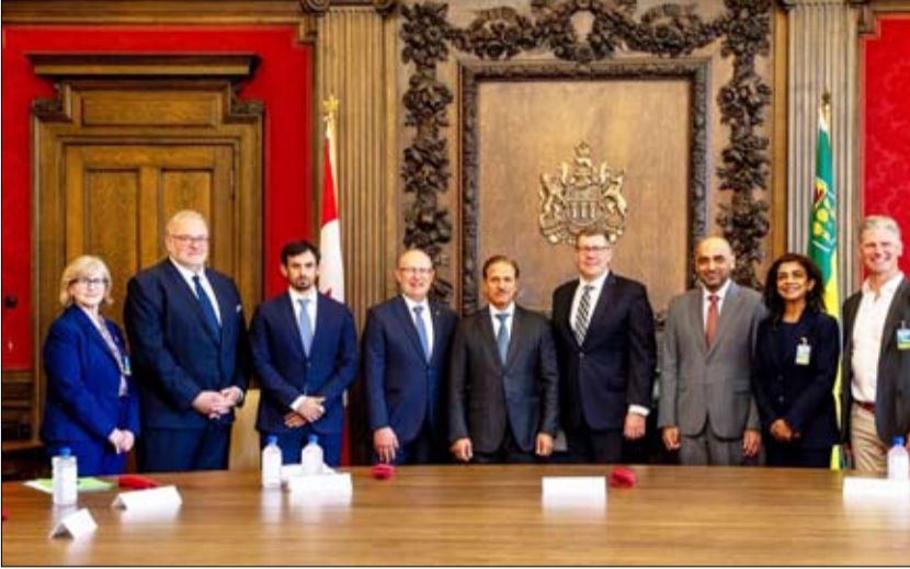
والتي تهدف إلى تعزيز آفاق التعاون التجاري والاستثماري بين دبي والأسواق العالمية الواعدة.

الطاقة النظيفة والبطاريات، مستفيدة من موقع دبي مركزاً عالمياً للتجارة وإعادة التصدير إلى أسواق الشرق الأوسط وأفريقيا وآسيا. وتندرج الزيارة ضمن سلسلة البعثات التجارية الدولية التي تنظمها غرف دبي في إطار مبادرة «ممرات النمو»