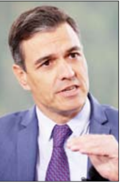
•• مدريد- أ ف ب:

في دورته العادية المستأنفة الـ165، أمس الأول في العاصمة الأردنية عمان. وأوضح أنه تم خلال الاجتماع الترحيب بالتوقيع على مذكرة التفاهم بين الولايات المتحدة الأمريكية والجمهورية الإسلامية الإيرانية، والتأكيد على دعم جهود الوساطة والتهدئة، وأن يسهم هذا التوقيع إلى الوصول إلى اتفاق نهائي وشامل يعزز الأمن والاستقرار في المنطقة والعالم. وأشار إلى أن الاجتماع بحث كذلك مخرجات وتوصيات الاجتماع الوزاري الـ167 الذي عقد مطلع يونيو الجاري، في إطار جهود التكامل بين دول مجلس التعاون، ومكتسيات المسيرة المباركة للمجلس.