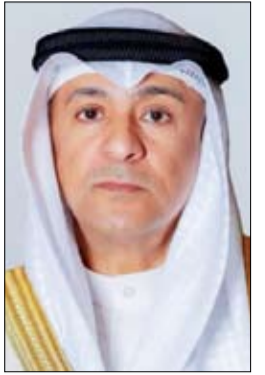
•• عمان - وام:

قال معالي جاسم محمد البيديوي الأمين العام لمجلس التعاون لدول الخليج العربية، إن الاجتماع الوزاري الخليجي التنسيقي بحث آخر التطورات والمستجدات والجهود الدولية والإقليمية للتهدئة وتعزيز الأمن والاستقرار في المنطقة، إضافة إلى مناقشة مخرجات الاجتماع الوزاري الـ167. جاء ذلك خلال تصريح معاليه بمناسبة انعقاد الاجتماع الوزاري التنسيقي لأصحاب السمو والمعالي والسعادة وزراء الخارجية بدول المجلس، على هامش اجتماع جامعة الدول العربية على المستوى الوزاري