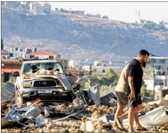
•• بيروت- وام:

ها هي البيئة تدفع مجدداً ثمن العدوان الإسرائيلي على القرى والمناطق اللبنانية، ومن أكثر الأضرار خطورة تلك التي لحقت بالأراضي الزراعية ولاسيما أشجار الزيتون جراء القنابل الفوسفورية التي تعمد جيش العدو إلقاءها لحرق المواسم، ناهيك عن التلوث الناتج عن الغارات التي لا تعد ولا تحصى والتي بنت سموها عن أرجاء الوطن، فحيا هذا التلوث ليزيد ملفاً إضافياً على ملفات بيئية كثيرة تحتاج إلى معالجة فورية وحل جذري ومنها أزمتا النفايات والقمامات والكسرات وغيرها من الملفات التي كانت وزارة البيئة تسعى جاهداً إلى معالجتها، ولكنها توقفت بسبب تداعيات العدوان. منذ توليها مهامها في فبراير 2025، وضعت وزيرة البيئة الدكتورّة نمارا الزين، ملف التعافي البيئي في صدارة أولويات الوزارة، انطلاقاً من قناعة مفادها أن إعادة تأهيل النظم البيئية المتضررة ليست مسألة تقنية فحسب، بل جزء لا يتجزأ من مسار التعافي الوطني وإعادة الإعمار.