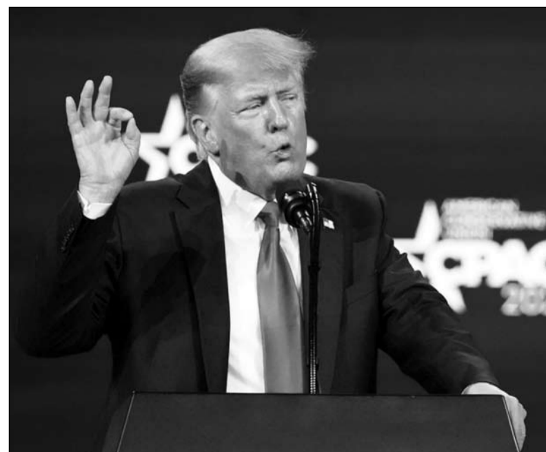
الانتقام من الجمهوريين الذين خذلوه