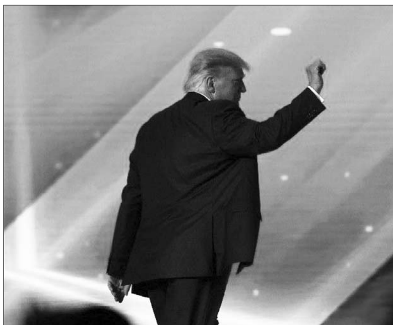
الرئيس الأمريكي السابق دونالد ترامب يغادر المسرح بعد خطاب أورلاندو

إذا لم يكن يخطط لتأسيس حزب جديد، فإنه في المقابل، يخطط لإطلاق منصة اجتماعية جديدة