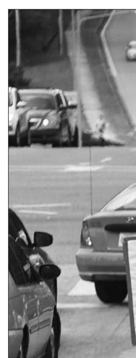
الرهان على الاوفياء من انصاره

مجموعة الدعم الرسمية، لجنة العمل السياسي أُنشئت في أمريكا، جمع التبرعات التي يرسل من أجلها رسائل بريد إلكتروني إلى مؤيديه والتي نقرأ "لا أموال لـ الجمهوريين بالاسم فقط، أرسلوا تبرعاتكم إلى لجنة العمل السياسي أُنشئت في أمريكا، على موقع DonaldJTrump.com. سنعود أقوى من أي وقت