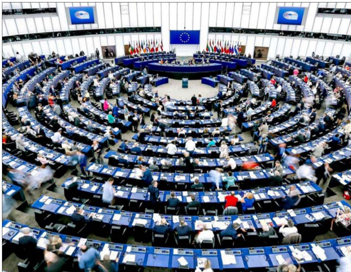
البرلمان الأوروبي كتلة جديدة في الأفق

لتوحيدهم في ربيع عام 2019، كسر ستيف بانون، المستشار السابق للرئيس الأمريكي دونالد ترامب، أسنانه.