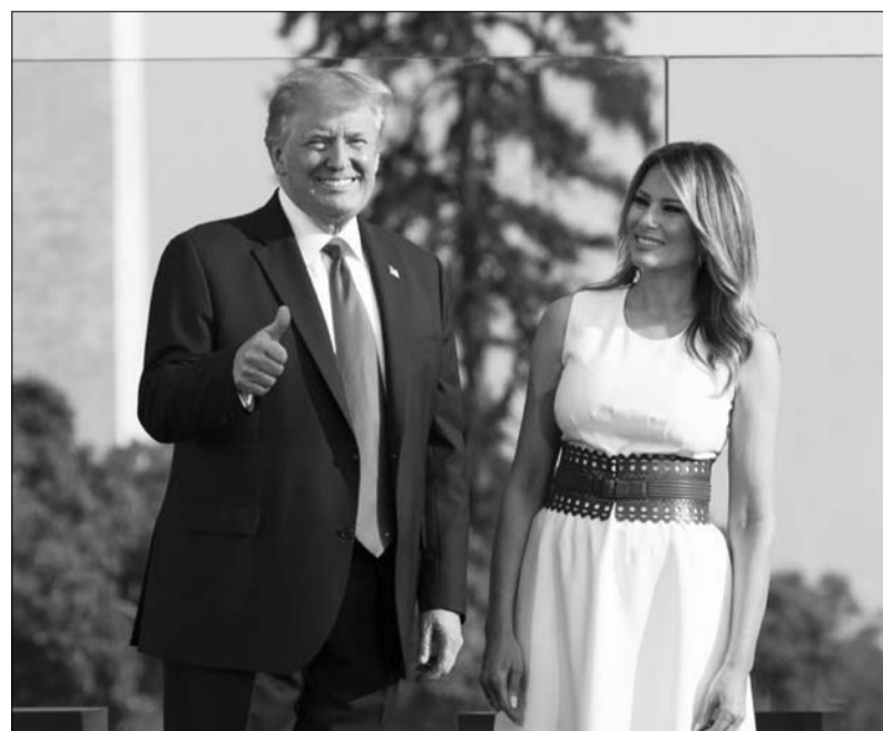
العودة الى الاعمال