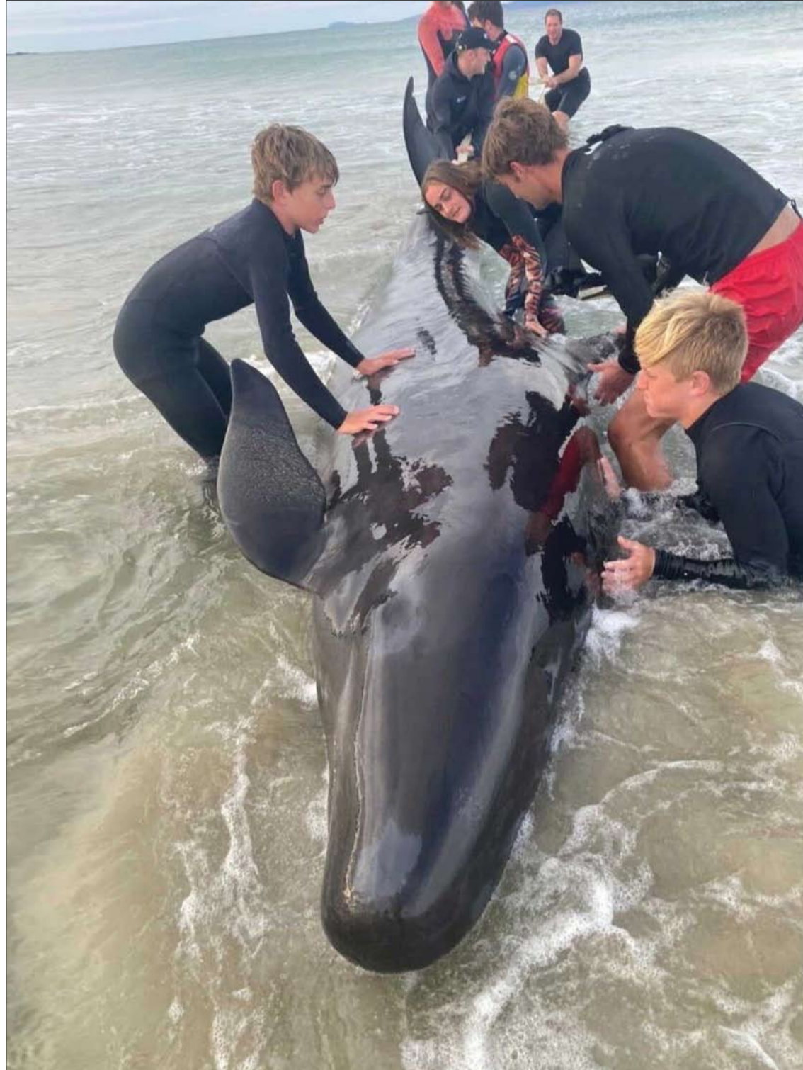
مجموعة من الأشخاص تساعد ويليامز، وثيك مويراي، مؤسس زورو، في إنقاذ حوت على الشاطئ في نيوزيلندا.