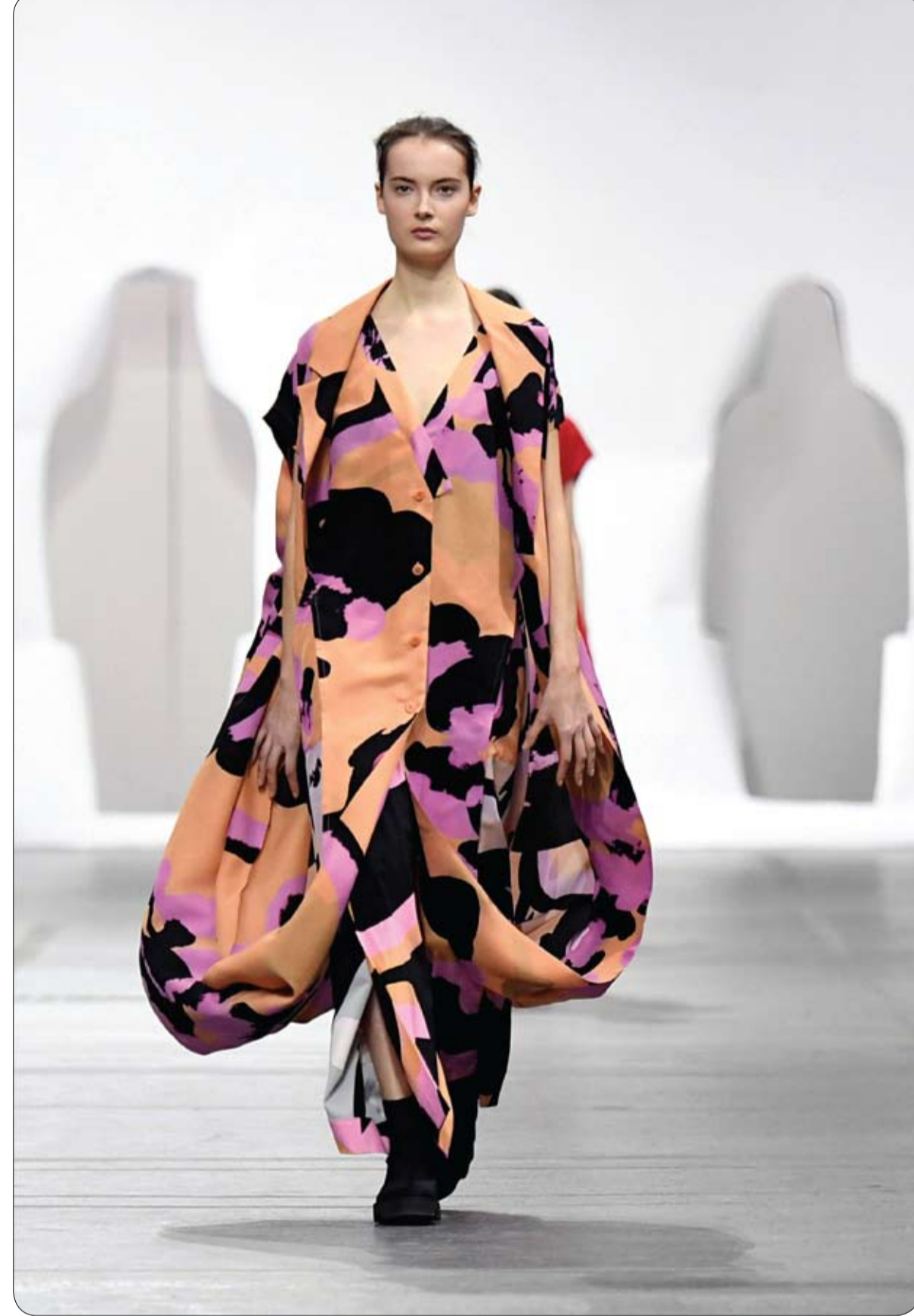
عارضة أزياء تقدم ابتكارا للمصمم ساتوشي كوندو كجزء من عرضه النسائي خلال أسبوع الموضة في باريس.

أغلق متحف اللوفر الشهير في باريس أبوابه لليوم الثاني أمس الاثنين فيما أجرت الإدارة محادثات مع العاملين فيه لبحث الخواوف المتعلقة بفيروس كورونا. ووضعت كتى المدخل الرئيسي للمتحف لافتة بلغات متعددة كتب عليها "تأجل اليوم فتح اللوفر. سنبلغكم بموعد محتمل لفتح في أقرب وقت ممكن. شكرا على تفهمكم". وأغلق المتحف الشهير الذي يضم لوحة الموناليزا للفنان ليوناردو دافنشي أبوابه أمس الأحد بعد أن عجزت الإدارة عن طمأنة العاملين على اعتواء مخاطر العدوى مما دفعهم للعزوف عن العمل.