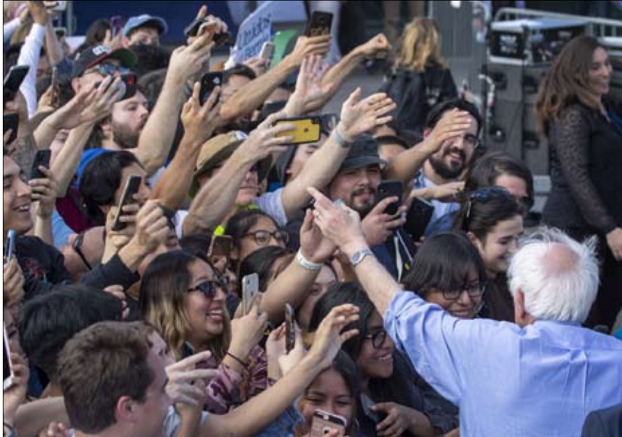
ساندرز لقمعة سائفة لترامب