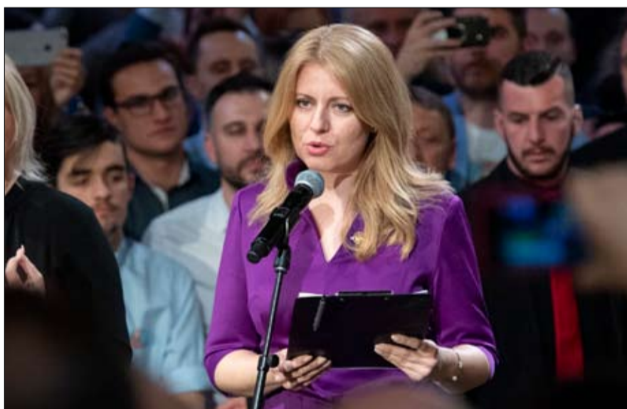
حزب الرئيسة خارج البرلمان