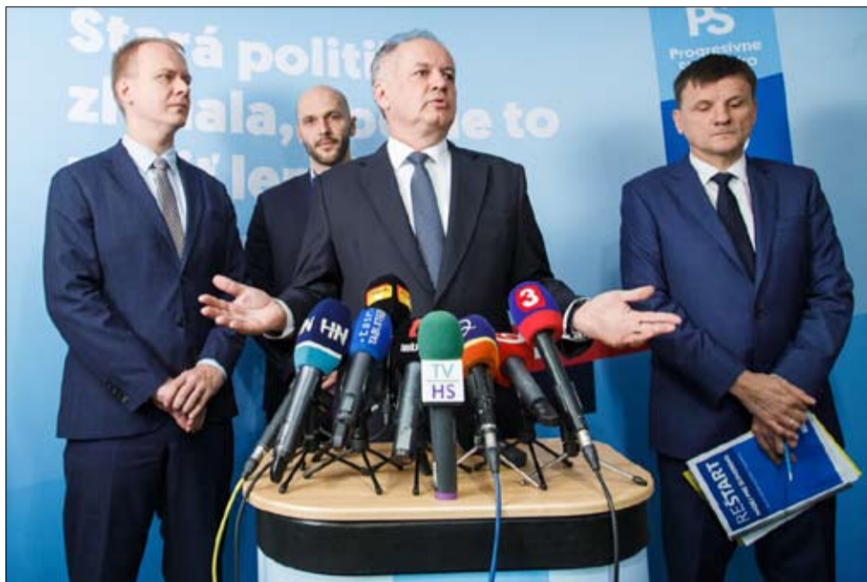
كيسكا قد يكون طرفا في الحكومة الجديدة