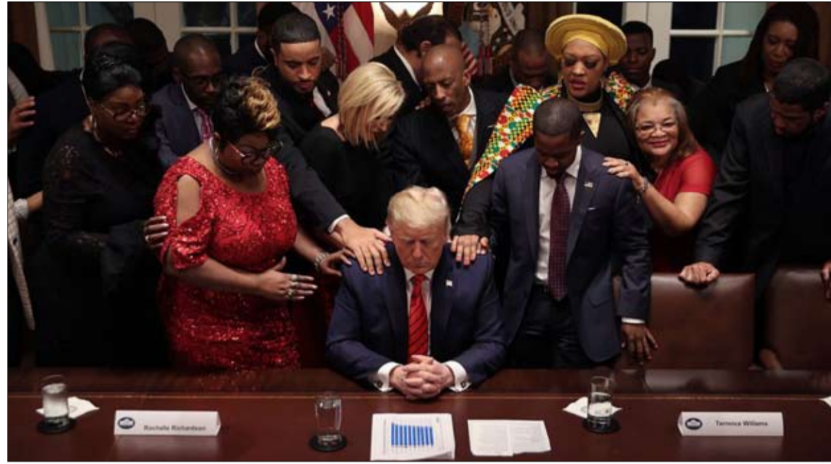
ترامب يخشى بايدن