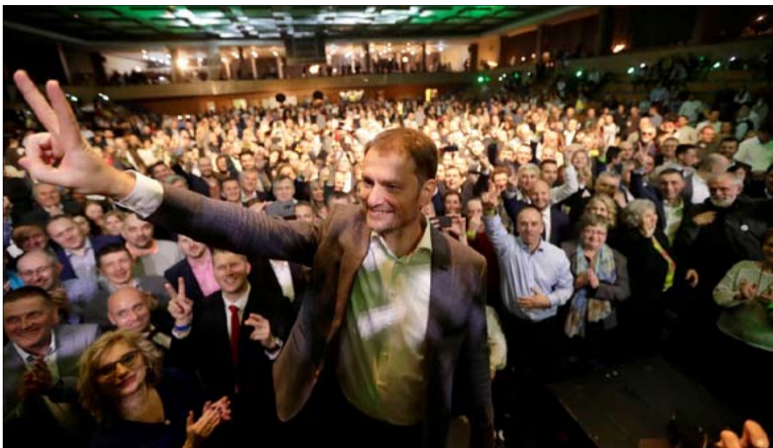
سيكلف إيغور ماتوفيتش بتشكيل الحكومة