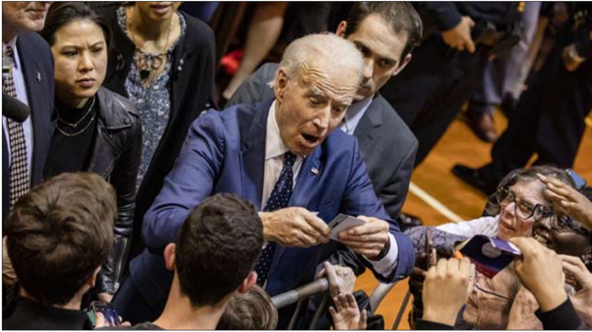
بايدن... أمل الديمقراطيين

كان حفل عشاء جمع 600 شخص، في استاد أرلينغتون الضخم الذي يتسع لمائة ألف، في منتصف الطريق بين دالاس وهورت وورث، المدينتين المتنافستين في شمال تكساس. في تلك