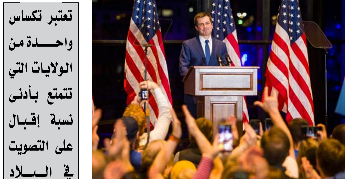
بيت... وانتهى المشوار

لم تصوت تكساس لمنافس ديمقراطي على البيت الأبيض منذ جيمي كارتر عام 1976