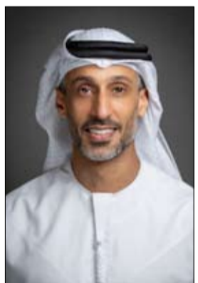
الإسكان يساهم بتحقيق نتائج مثمرة وفوائد ملموسة للمجتمع.