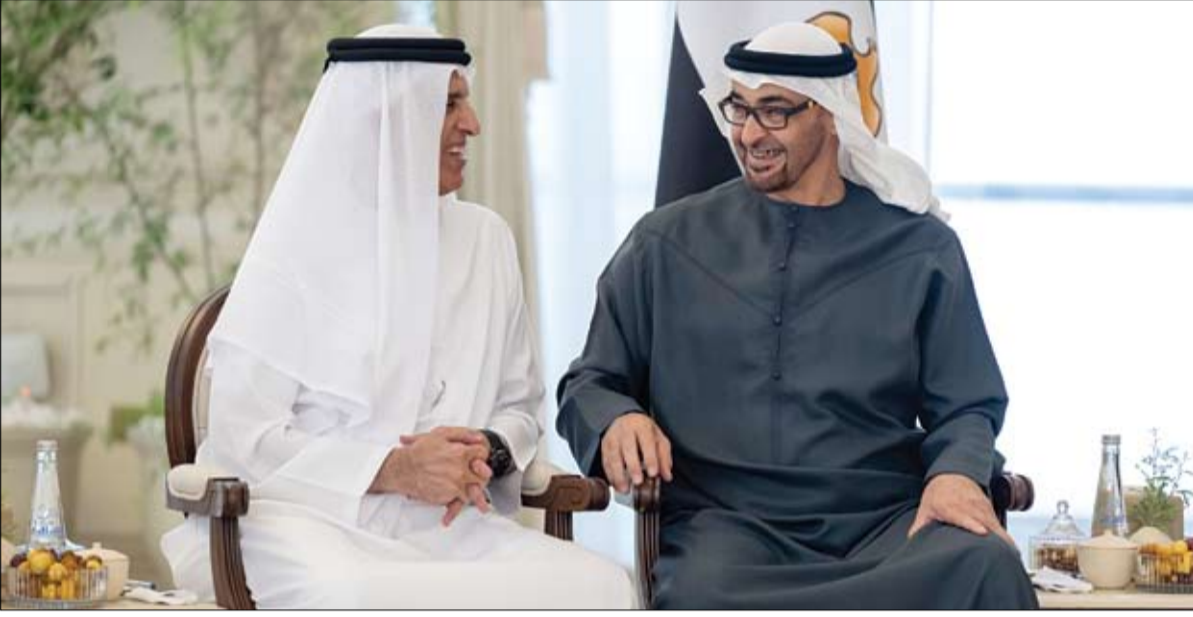
رئيس الدولة خلال استقباله حاكم رأس الخيمة

يومية - سياسية - مستقلة www.alfajrnews.ae