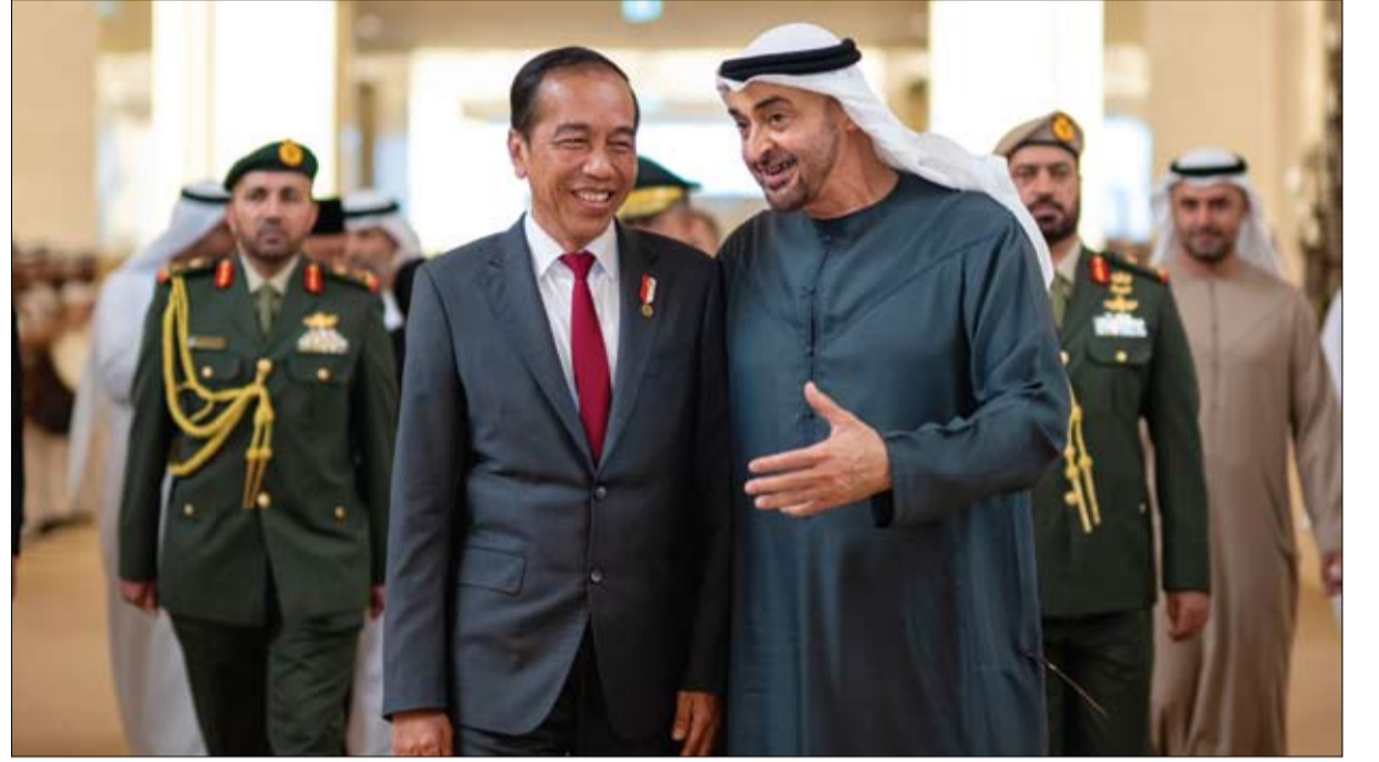
رئيس الدولة خلال استقباله الرئيس الإندونيسي (وام)