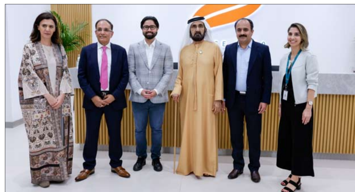
مرافق ومكونات المركز العالمي المقام على مساحة 55.000 قدم مربع، ويعمل من خلاله على ابتكار مجموعة واسعة من المنتجات تقوم بتصدير الجانِب الأكبر منها إلى أكثر من 100 دولة حول العالم انطلاقاً من دبي، بما يتماشى مع «برنامج

أكد صاحب السمو الشيخ محمد بن راشد آل مكتوم نائب رئيس الدولة رئيس مجلس الوزراء حاكم دبي «رعاه الله»، أن قطاع البحث والتطوير يعد أحد أهم القطاعات الحيوية التي تحيطها الدولة بكل العناية والاهتمام، وتعمل على إيجاد المحفزات اللازمة والبيئة الملائمة التي تكفل مؤسساته النمو والأزدهار، لما لهذا القطاع من قيمة نوعية كركيزة أساسية من ركائز التنمية المستدامة والاقتصاد الإبداعي، ورافعة مهمة للارتقاء بأداء وقدرات مختلف القطاعات، ما يؤكد قيمته كوسيلة بالغة الأهمية لتشكيل ملامح المستقبل. جاء ذلك خلال زيارة سموه