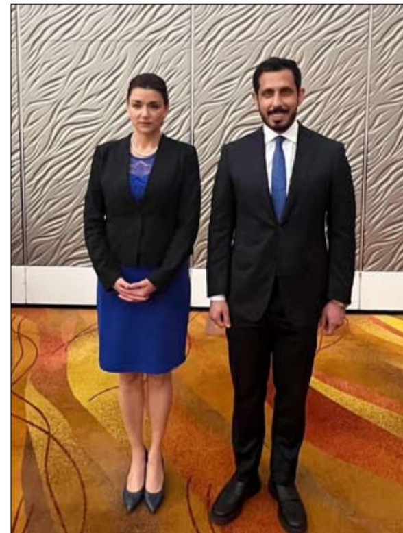
المحلق في سفارة المكسيك في واشنطن العاصمة، وركزت جهودها على تعزيز العلاقات الثنائية مع الولايات المتحدة في

رحب سعادة حامد الزعابي، مدير عام المكتب التنفيذي لمواجهة غسل الأموال وتمويل الإرهاب، بتولي إيسا دي أندرا رئاسة مجموعة العمل المالي «فاتف» للفترة من يوليو 2024 حتى يونيو 2026. وبدأت إيسا دي أندرا، مهامها كرئيسة لمجموعة العمل المالي «فاتف» ضمن ولايتها الرئاسية التي تمتد حتى يونيو من عام 2026، وذلك بعد انتخابها من قبل الهيئة العامة للمجموعة في فبراير الماضي.