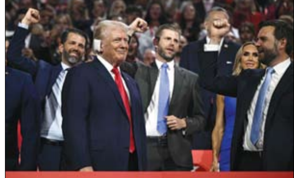
ترامب وخلفه ابناهما بينما يهتف له السيناتور جيه دي فانس في منتدى فيسيفر بظلالها في الولايات المتحدة.

وقد أعلن الرئيس الأمريكي السابق على جمهورية لأول مرة منذ الحادثة في مؤتمر الحزب في ميلواكي بولاية ويسكونسن. ووصل ترامب إلى مؤتمر الحزب الجمهوري مضجداً أنه وسط حشد وتصفيق جعله بطلاً في أعين ناخبيه في ولاية ويسكونسن. إلا أن الرئيس السابق لم يبدو على غير العادة - بإطلالته المشعة التي طالما بدت عليه في كل ظهور علني سابق له.