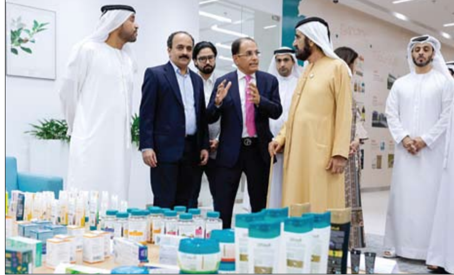
محمد بن راشد خلال زيارته مركز هيمالايا المتطور للأبحاث

أكد صاحب السمو الشيخ محمد بن راشد آل مکتوم نائب رئيس الدولة رئيس مجلس الوزراء حاكم دبي رعاه الله، أن قطاع البحث والتطوير يعد أحد أهم القطاعات الحيوية التي تحيطها الدولة بكل العناية والاهتمام، وتعمل على إيجاد الحفزات اللازمة والبيئة الملائمة التي تكفل لإسسهات النمو والازدهار، لما لهذا القطاع من قيمة نوعية كركيزة أساسية من ركائز التنمية المستدامة والاقتصاد الإبداعي، ورافعة مهمة للارتقاء بأداء وقدرات مختلف القطاعات، ما يؤكد قيمته كوسيلة بالغة الأهمية لتشكيل ملامح المستقبل.