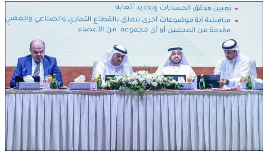
تعيين مدقق الحسابات وتحديد أنصابه مناقشة أية موضوعات أخرى تتعلق بالقطاع التجاري والصناعي والمهني مقدمة من المجلس أو أي مجموعة من الأعضاء

•• الفجيرة-وام: أكد سعادة الشيخ سعيد بن سرور الشرقي، رئيس مجلس إدارة غرفة تجارة وصناعة الفجيرة أن أعمال الغرفة خلال السنة الأولى من الدورة الخامسة عشرة لمجلس الإدارة جاءت متوائمة مع روح القانون رقم 1 لسنة 2023 بشأن إعادة تنظيم الغرفة الذي أصدره صاحب السمو الشيخ حمد بن محمد الشرقي عضو المجلس الأعلى حاكم الفجيرة. جاء ذلك في كلمته خلال اجتماع الجمعية العمومية للغرفة بمناسبة انتهاء السنة الأولى من الدورة الـ 15 لمجلس الإدارة الذي عقد بمن حضر بموجب المادة 14 من القانون رقم 1 لسنة 2023 بعد الاجتماع الذي كان مقرراً عقده في الرابع من الشهر الحالي وتم تأجيله لعدم