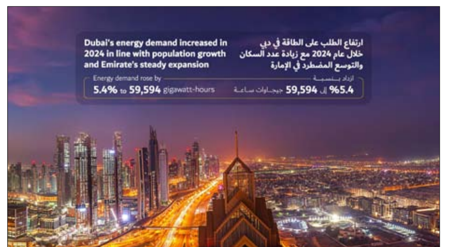
ارتفع الطلب على الطاقة في دبي خلال عام 2024 مع زيادة عدد السكان والتوسع الحضري في الإمارة Energy demand rose by 5.4% to 59,594 gigawatt-hours أردت بنسبة 5.4% إلى 59,594 جيجاوات ساعة