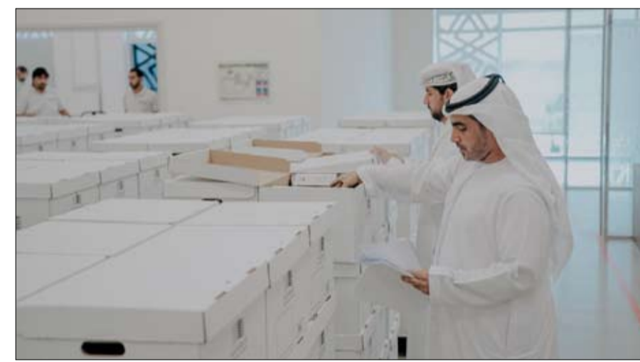
القانون، والتعاون يضمن الحفاظ على القيمة التاريخية الكبيرة لهذه الوثائق.

الوثائق بالمحافظة عليها لأطول فترة ممكنة في جهة وطنية ذات خبرة عالمية متخصصة في هذا المجال، ويدعم المشروع أيضاً معيار التكامل بين المؤسسات الحكومية والذي يعتبر ركيزة أساسية في منظومة التميز الحكومي الإماراتية في إصدارها الأخير 2024 والتي تركز على المخرجات والنتائج والشراكة والتكامل. وقال سعادة المستشار أحمد محمد الخاطري رئيس دائرة محاكم رأس الخيمة: إن هذا المشروع يأتي لضمان حفظ الملفات الورقية لمعاملات دائرة محاكم رأس الخيمة القديمة نادرة بجودة عالية، وإمكانية استعادتها بسهولة، وضمان ترميم النصف