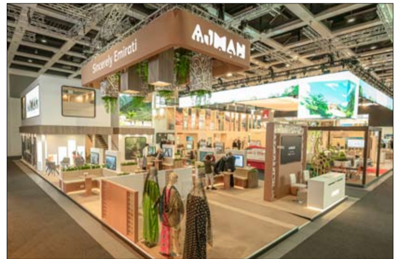
خلال معرض بورصة برلين الدولي لعام 2025