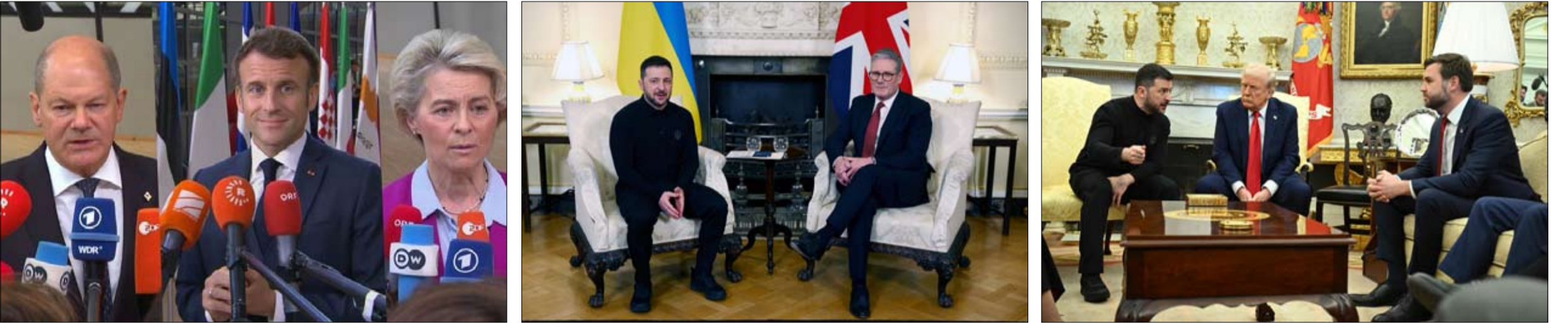
بعد المشادة الحادة بين ترامب والرئيس الأوكراني :

الأسرى. •• تل أبيب-وكالات: قالت صحيفة "يديעות أحرونوت" العبرية الخاصة، إن رئيس الوزراء الإسرائيلي بنيامين نتنياهو، أرسل سكرتيره العسكري اللواء رومان جوفمان إلى موسكو، خلال الأيام الأخيرة، لإجراء سلسلة من الاجتماعات الأمنية والسياسية مع مسؤولين روس. وأشارت الصحيفة إلى أنه وفي سياق هذه الزيارة، تهدف تل أبيب للحفاظ على النفوذ الروسي في سوريا. ووفقا لـ "يديעות أحرونوت"، فإن الهدف من الزيارة هو تعزيز التنسيق الأمني بين البلدين، بالإضافة إلى حث روسيا على ممارسة ضغوط على حماس عبر الوسطاء، لدفع المفاوضات بشأن صفقة