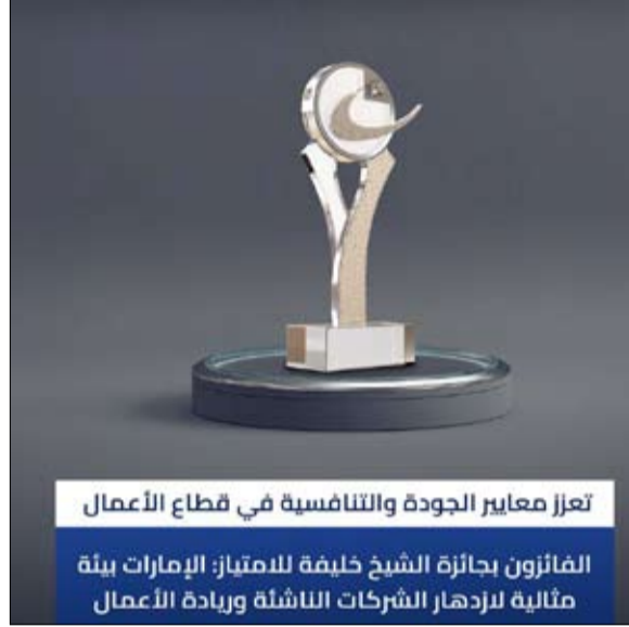
تعزز معايير الجودة والتنافسية في قطاع الأعمال الفائزون بجائزة الشيخ خليفة للامتياز، الإمارات بيئة مثالية لازدهار الشركات الناشئة وريادة الأعمال

من هذا المجال الحيوي مع الجهات المختصة، لافتاً إلى أن الشركة تعمل بشكل وثيق مع جهات مثل هيئة البيئة - أبوظبي، وغيرها الدولة.