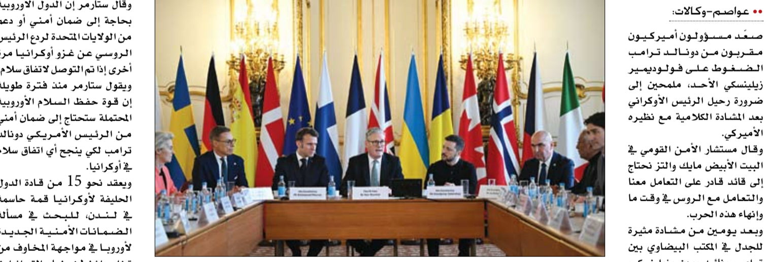
قادة الدول الأوروبية خلال قمتهم في لندن (ا ف ب)

لم يمثل زيلينسكي للمطالب الأمريكية. وقال زعيم الجمهوريين في الكونجرس ليرنامج ميت دابرس على شبكة إن.بي.سي يجب أن يتغير شيء ما، إما أن يعود إلى رصده ويعود إلى الطاولة بامتنان، أو ستكون هناك حاجة إلى قائد آخر للبلاد للقيام بذلك. وفي لندن أكد رئيس الوزراء البريطاني كير ستارمر، أمس الأحد، أن بلاده وفرنسا تعلان معا على خطة لوقف القتال بين أوكرانيا وروسيا، وذلك قبل ساعات من عقد قمة حاسمة في لندن مع عشرات المسؤولين الأوروبيين. وقال ستارمر لهيئة الإذاعة البريطانية (بي بي سي)، ستعمل المملكة المتحدة، إلى جانب فرنسا وربما دولة أو دولتين أخريين، مع أوكرانيا على خطة لوقف القتال، وبعد ذلك سنناقش هذه الخطة مع الولايات المتحدة، نقلا عن فرانس برس.