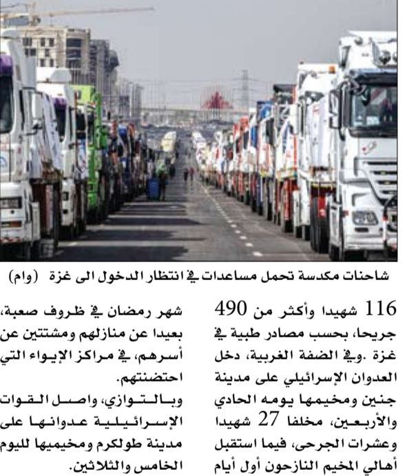
شاحنات مكدسة تحمل مساعدات في انتظار الدخول الى غزة