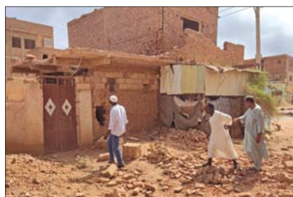
أشخاص يتفقدون منزلاً مدمراً في جنوب الخرطوم مع استئناف القصف السودان يجب أن تتوقف، مؤكداً أن الأزمة تهدد المنطقة بأكملها. جاء ذلك عقب قمة إفريقية مصغرة استضافتها جيبوتي، وشارك فيها رؤساء جنوب السودان وكينيا وجيبوتي. من جانبه، قال رئيس جيبوتي إن دول إيفاد ستدرس سبل إقناع الجيش وقوات الدعم السريع بإجراء حوار كئيل بوقف إطلاق النار بشكل فعلي في المرحلة المقبلة.

تبادل الجيش وقوات الدعم السريع، أمس، الاتهامات بشأن المسؤولية عن تجدد المعارك في السودان، بعد انتهاء هدنة إنسانية استمرت لمدة 24 ساعة فقط، صباح الأحد. وقال الجيش في بيان، الإثنين، إن قوات الدعم السريع درجت على استهداف المناطق السكنية بالأزهرى والسلمة بالقصف المدفعي والصاروخي، مما أدى إلى مقتل شخص وإصابة 3 أطفال. وردت قوات الدعم السريع ببيان آخر، جاء فيه تأكيد الالتزام بالإنسان والقانون جده لحماية المدنيين والتبديد المطلق بقوانين حقوق الإنسان والقانون الدولي الإنساني، والاستعداد الكامل للانخراط في المباحثات بما يحقق الاستقرار لشعبين. وعلى وقع التصعيد في السودان بين الجيش والدعم السريع، عقدت الهيئة الحكومية للتنمية إيفاد قمة في جيبوتي لإقناع طرفي الأزمة بإجراء حوار ينهي القتال بينهما ويضع حدا للحرب الدائرة. وحذر رئيس مفوضية الاتحاد الإفريقي موسى فيكي من أن استمرار الصراع في السودان يهدد بجر البلاد إلى حرب أهلية واسعة النطاق. وأضاف فيكي خلال قمة إيفاد جيبوتي، أن الأزمة السودانية تتطلب حلاً سريعاً وموحداً من دون تأجيل. وأشار إلى أن المفوضية الإفريقية تشجع على حوار شامل يقوده السودانيون بأنفسهم لحل الأزمة. وشدد على أن عملية الدمار الذاتي المستمرة في