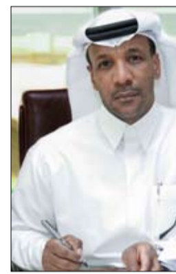
شخصاً و7 شركات إلى محكمة غسل الأموال المختصة بمحاكمة دبي الجزائية، لتورطهم في ارتكاب جرائم غسل الأموال والاحتيال عبر

دبي - وام: قضت محكمة غسل الأموال بمحكمة دبي الجزائية بإدانة تشكيل عصابي مكون من عدد 30 شخصاً "طبيعياً" وعدد 7 شخصيات "اعتبارية" لارتكابهم جرائم غسل أموال واحتيال عبر شبكة الإنترنت حيث استولى أعضاء التشكيل العصابي، المكون من أفراد وشركات، على مبالغ منقولة تزيد قيمتها على 32 مليون درهم. وقضت المحكمة بمعاينة الأشخاص الطبيعيين بالسجن لمدد إجمالية بلغت 96 عاماً برعاية أدوارهم في الواقعة بالإضافة إلى إبعادهم عن