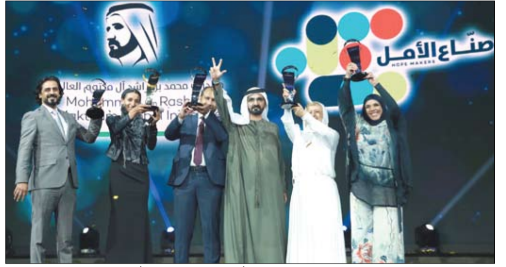
محمد بن راشد خلال تكريمه صناع الأمل في الدورة السابقة (أرشيفية)

204 فلل سكنية جديدة للمواطنين في منطقة سويحان. واستمع سموه خلال مراسم التدشين، إلى شرح مفصل عن مواصفات البناء المعتمدة في المشروع ومزايا التصميم الخارجية والداخلية إضافة إلى مكونات نموذج الفلل وتفاصيله، والتي شيدت وفق أرقى المعايير لمشروع سويحان السكني، الذي يقام ضمن مشاريع الحي الإماراتي المتكامل، بتكلفة تصل إلى 572.1 مليون درهم، لتوفير