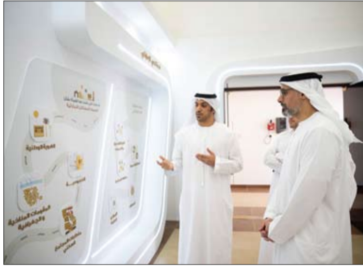
خالد بن محمد بن زايد يطالع على مواصفات البناء المعتمدة في مشروع سويحان السكني (وام)

أرسلت دولة الإمارات طائرة تحمل على متنها 51 طناً من الإمدادات الإغاثية والغذائية لمساعدة الآلاف من المتضررين من بركان مايون في إقليم ألباي في الفلبين، والذي تسبب في حدوث انهيارات أرضية وتدفقات للحمم البركانية، ونزوح الآلاف من السكان، معظمهم من الأطفال والنساء وكبار السن. وتعد استجابة دولة الإمارات السريعة لتقديم الدعم الإغاثي في إقليم ألباي في الفلبين أول استجابة دولية لدعم السكان المتضررين من البركان. (التفاصيل ص3)