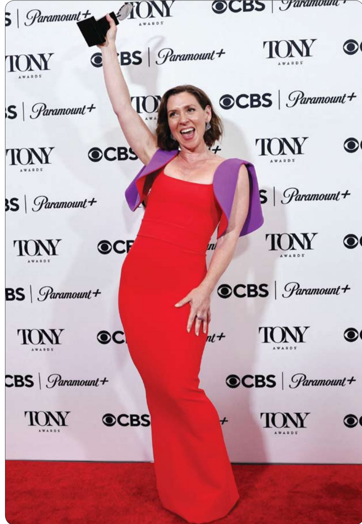
ميريام سيلفرمان لدى حصولها على جائزة في حفل توزيع جوائز توني السنوي السادس والسبعين في نيويورك

يبدو أن فوز فريق مانشستر سيتي لم يكن مؤلماً لنادي إنتر ميلان وجماهيره فحسب، بل المذبح برازيلي. فقد انتشر على منصات التواصل الاجتماعي، ومن بينها تويتر، فيديو يظهر فيه حارس مرمى منتخب البرازيل ونادي مانشستر سيتي إيدرسون وهو يحلق شارب مذبح برازيلي على الهواء. وفي وقت لاحق ظهر المذبح وهو يحلق لحية الحارس البرازيلي، الذي أبدع في إنقاذ مرمى فريقه من هدفين محققين في نهائي بطولة التشارمبيونز ليغ، التي جرت على ملعب أتاتورك في مدينة إسطنبول التركية وانتهت بفوز السيتيزز بهدف دون مقابل.