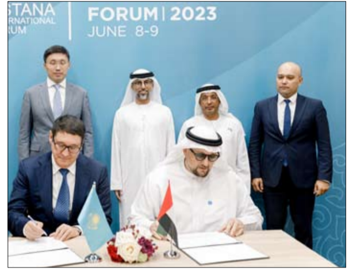
بقدرة إنتاجية تصل إلى واحد جيجاوات