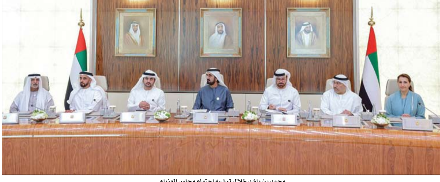
محمد بن راشد خلال تروسه اجتماع مجلس الوزراء

•• بغداد - وكالات: أعلنت قيادة عمليات بغداد وخلية الإعلام الأمني العراقية أمس الأربعاء مقتل أربعة عناصر من تنظيم داعش، أحدهم قيادي بارز، في عملية أمنية بشمال العاصمة العراقية. وأفادت السلطات العراقية بأن قوة من الجيش والحشد الشعبي تمكنت من قتل عدنان اللهيبي والي شمال بغداد في تنظيم داعش. وذكر قائد عمليات بغداد الفريق الركن أحمد سليم في بيان أنه: بعملية نوعية استندت إلى معلومات استخباراتية دقيقة تمكنت قوة من لواء المشاة الثالث والعشرين الفرقة السادسة وفوج حشد الطارمية، من نصب كمين محكم لتصيבת داعش وقتل 4 إرهابيين، من ضمنهم ما يسمى والي شمال بغداد وذلك في قضاء الطارمية شمال العاصمة. وذكر بيان لخلية الإعلام الأمني أن وكالة الاستخبارات والتحقيقات الاتحادية في وزارة الداخلية تمكنت من خلال المعلومات الاستخباراتية الدقيقة وتعاون المواطنين من إلقاء القبض على أربعة متهمين مطلوبين وفق أحكام المادة أربعة إرهاب في محافظة نينوى.