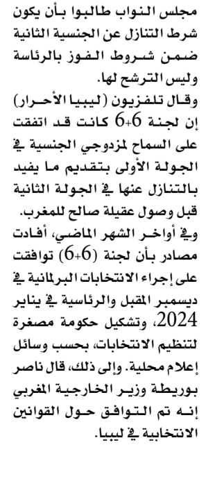
وزير الخارجية المغربي وممثلو الوفدين الليبيين

•• بوزنيقة - وكالات: فشلت الأطراف الليبية في التوقيع على إعلان بوزنيقة بشأن الانتخابات الليبية، فيما توقع وزير الخارجية المغربي ناصر بوريطة أن يتم التوقيع على الإعلان خلال أيام، مشدداً على أهمية أن توكب هذه التفاهات إرادة سياسية حقيقية لتنظيم الانتخابات وإقامة مؤسسات الدولة. أفاد تلفزيون المسار الليبي، نقلاً عن جمال الشويهي عضو لجنة (6+6)، أن رئيس مجلس النواب الليبي عقيلة صالح غادر مكان التوقيع على إعلان بوزنيقة الخاص بقوانين الانتخابات بعد خلافات حول بعض التعديلات. وقال الشويهي إن رئيس مجلس الدولة خالد الشري اشترط أيضاً أن تكون الانتخابات الرئاسية على جولتين، أي كانت نتيجة الجولة الأولى. وتشكلت لجنة (6+6) من ممثلين لمجلس النواب والأعلى للدولة بموجب التعديل الدستوري لوضع قوانين الانتخابات، التي تعذر إجراؤها في ديسمبر 2021 في ظل وجود حكومتين بالبلاد. وفي وقت سابق نقلت وسائل إعلام ليبية عن مصادر قولها إن خلافاً حول شرط التنازل عن الجنسية الثانية تسبب في تأجيل إعلان بوزنيقة الخاص بالقوانين الانتخابية. وذكرت أن صالح ووفد