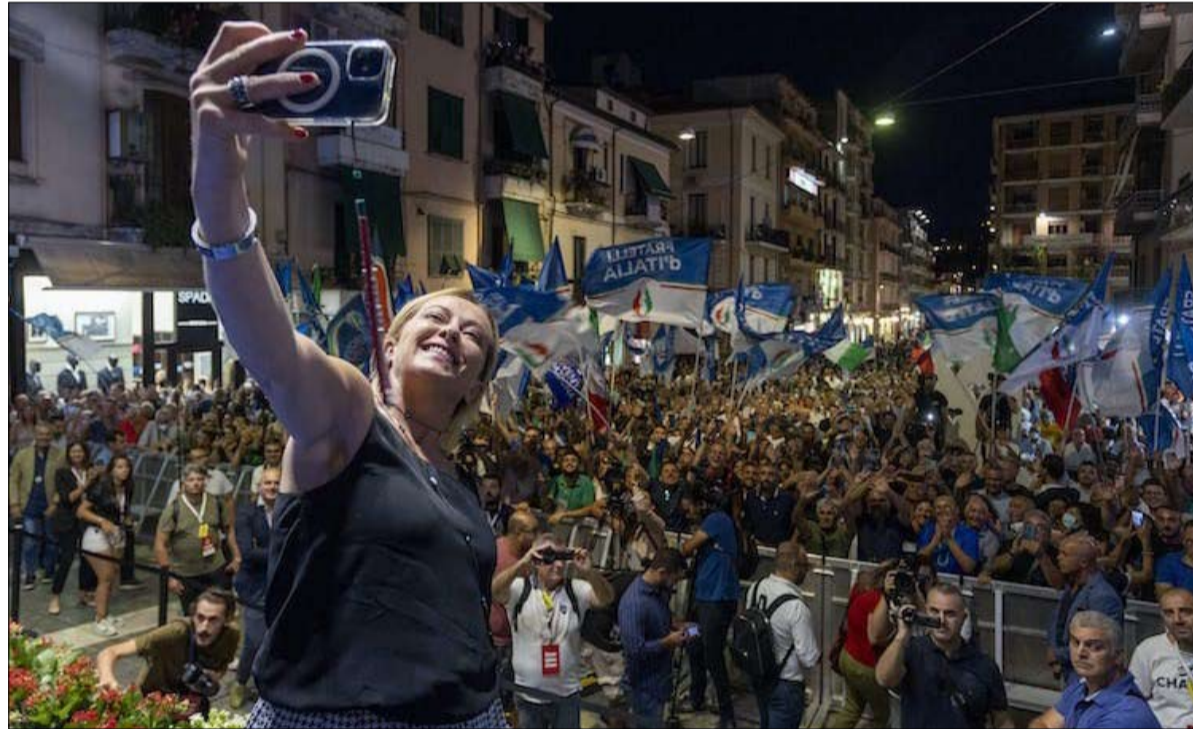
تخاطب ميلوني جمهوريين متميزين خلال الحملة الانتخابية