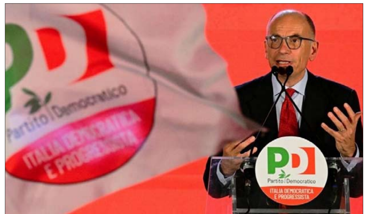
الحزب الديمقراطي يسار في عملية انتخابية