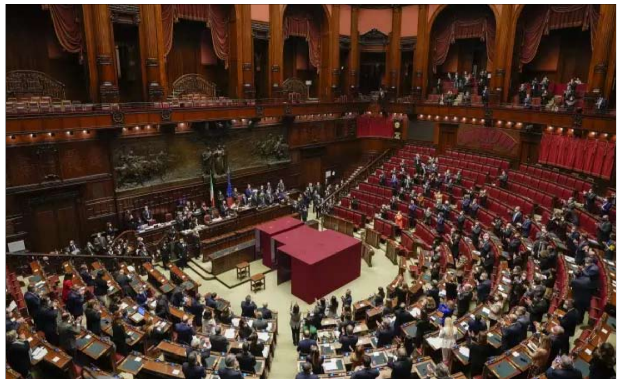
أغلبية جديدة في البرلمان الإيطالي بعد 25 سبتمبر

على سبيل المثال لا الحصر. وستكون هذه الانقسامات حاسمة عند تشكيل الحكومة. بشكل عام، فيما يتعلق بالقضايا الدولية، فإن التحالف منقسم.