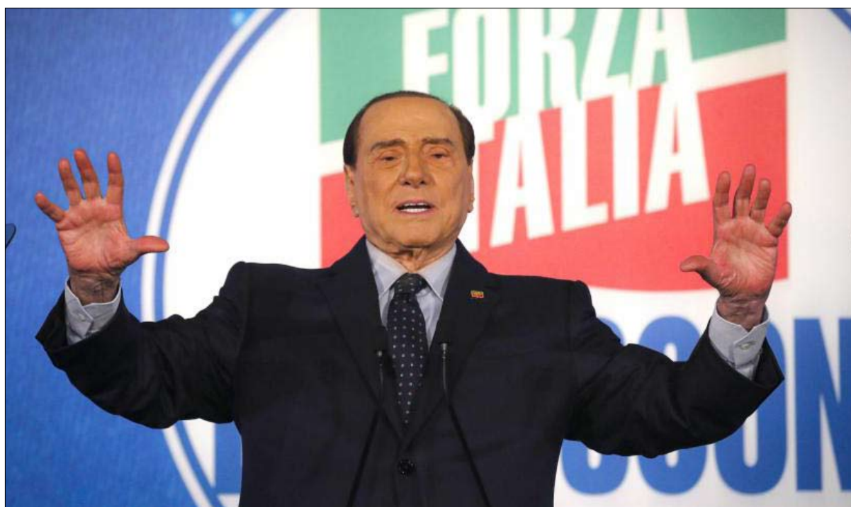
برلسكوني ثالث ثلاثة في الائتلاف اليميني