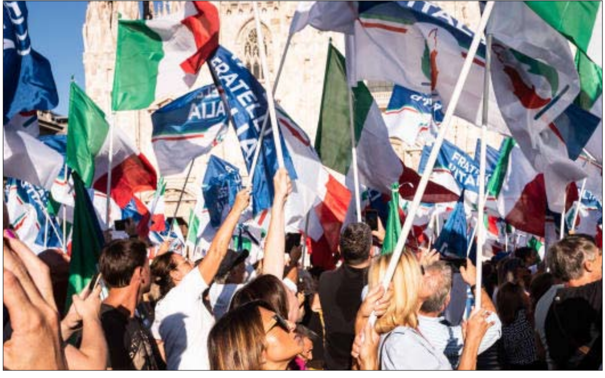
اليمين المتطرف على شتية الحكم