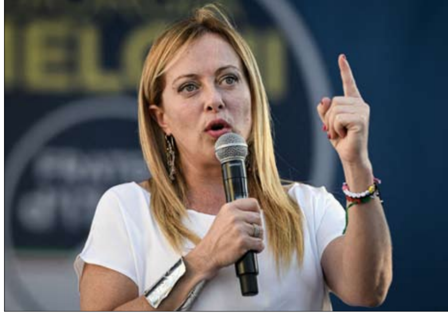
جيورجيا ميلوني، هي الأوفر حظا لمنصب رئيس الوزراء

- أولا: قد يقوم الناتو بتزويد أوكرانيا بصواريخ استراتيجية بعيدة المدى، ولكن مع ضرورة الرقابة على هذه الصواريخ بحيث يتم استخدامها ضمن هذه المقاطعات، لأن الدول الغربية لن تعترف بها أراض روسية، فإن عملية شد الحبل هذه ستستمر على ما كانت عليه، ولكن روسيا ستزيد من ضغطها العسكري وزخم عملياتها العسكرية. - ثانيا: أما إذا استخدمت القوات الأوكرانية هذه الصواريخ لتصف العمق الروسي، فقد تلجأ روسيا إلى ذلك العاصمة كييف بشكل عنيف، ويصبح بذلك ضرب دول الناتو التي تزود أوكرانيا بالأسلحة هدفا مشروعا لروسيا، وعندها جميع الاحتمالات مفتوحة، فقد تنزلق المعارك وتتسع مساحتها وتصبح أمام حرب عالمية ثالثة بكل معنى الكلمة، وقد يتم استخدام السلاح النووي. - ثالثا: إذا استغفرت قوات حلف الناتو وشاركت بشكل مباشر مع القوات الأوكرانية في هذه المعارك، فإن روسيا ستستخدم السلاح النووي بدون أدنى شك. اعتقد أن السيناريو الأول هو الأقرب إلى الواقع، وستشهد الأسابيع القليلة المقبلة معارك عنيفة جدا، وخاصة في مقاطعة خاركوف، لأن الأنباء الواردة من هناك في غاية البشاعة.