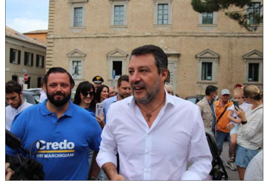
ماتيو سالفيني تحالف هش في جوهره

في الانتخابات التشريعية الإيطالية الأخيرة، التي أجريت في مارس 2018، تحصل حزب "فرايتلي ديتاليا" على 4 فاصل 4 بالمائة فقط من الأصوات. بعد أربع سنوات ونصف، أصبح تشكيل اليمين المتطرف، وفقا لجميع استطلاعات الرأي، في طريقه إلى تحقيق نصر تاريخي في 25 سبتمبر. وإذا تم تأكيد الاتجاهات التي أعلنتها استطلاعات الرأي، فسيكون حزب فرايتلي ديتاليا، اعتبارا من يوم الاثنين، الحزب الأول في البلاد، وسيشكل حكومة مع شركائه في التحالف: الرابطة، بزعامة ماتيو سالفيني، وفورزا إيطاليا، بقيادة سيلفيو برلسكوني، وستصبح زعيمة "فرايتلي ديتاليا"، جيورجيا ميلوني، 46 سنة، رئيسة للوزراء.