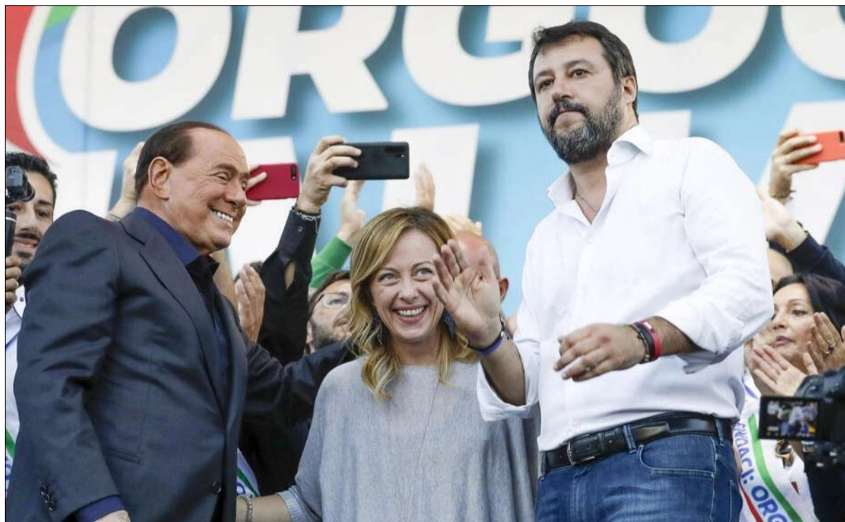
الثلاثي الأوفر حظا