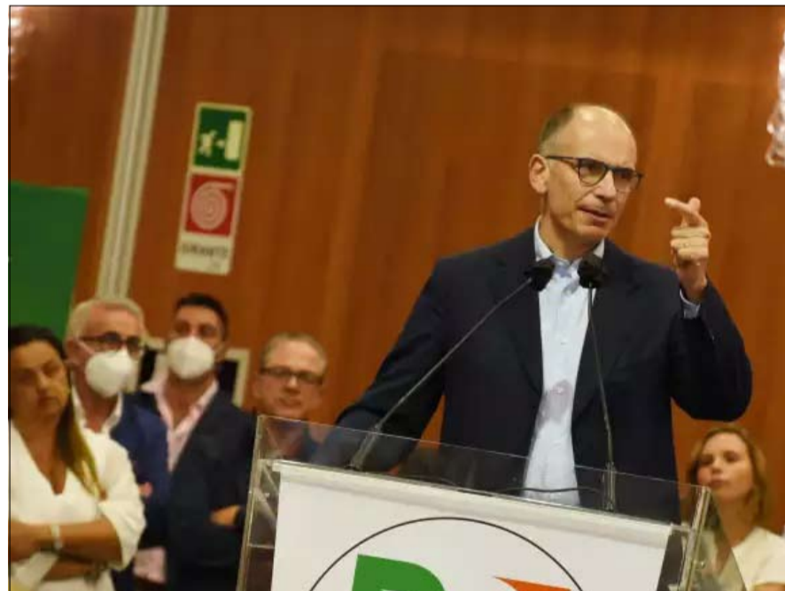
إنريكو ليتا الحزب الديمقراطي يحتاج معجزة