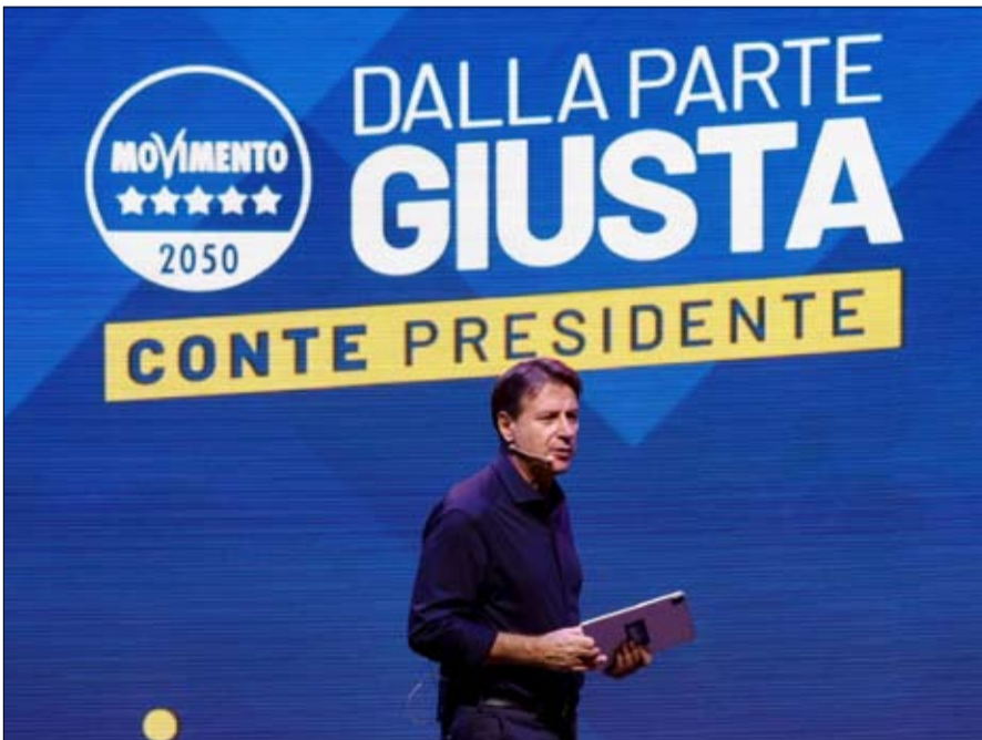
حركة 5 نجوم تستعيد بعض انقسامها