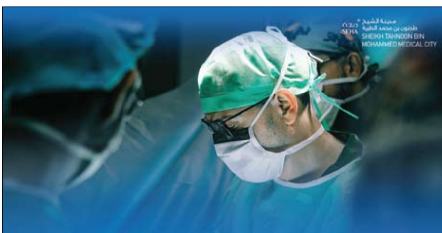
بن محمد الطبية التابعة لشركة «صحة»، في جراحات الجهاز الهضمي العلوي والعمليات متعددة قائمة على الابتكار والتميز الطبي.