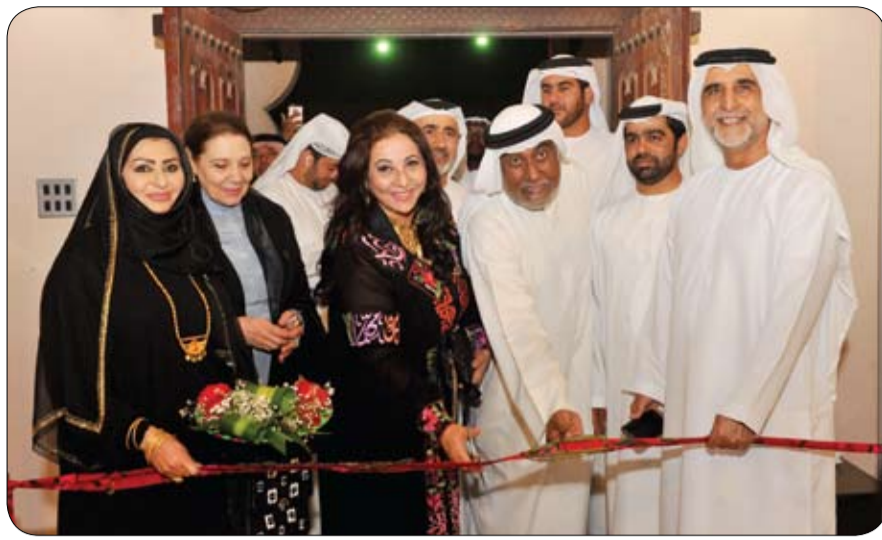
في بداية موسمها الثقافي