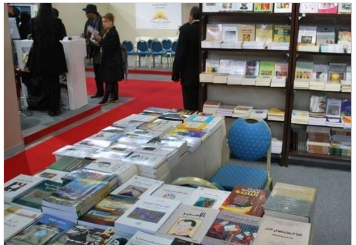
مشاركة متنوعة لدور النشر العربية والاجنبية