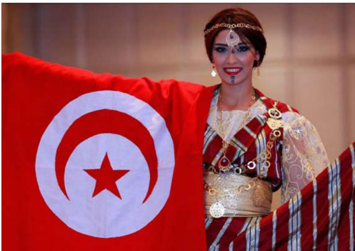
معرض الكتاب يحتفي بالمرأة التونسية

وتسجل الدورة الحالية مشاركة 577 ناشرا يمثلون 23 بلدا عربيا وأجنبيا من ضمنهم 621 ناشرا تونسيا. ويبلغ عدد المعارضين 952 عارضا يمثلون 52 بلدا عربيا وأجنبيا إلى جانب منظمات وهيئات وجمعيات من بينهم 111 عارضا تونسيا.