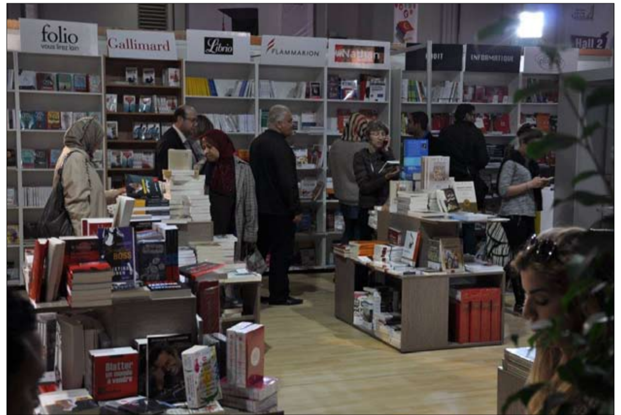
مقاومة الكتب المزورة والمقرصنة

- استبعاد الكتب الصفراء التي تدعو إلى التطرف والإرهاب