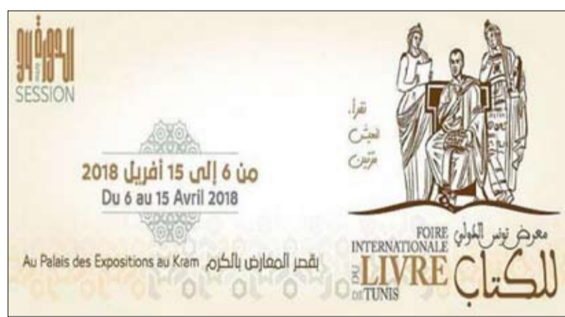
ملصق معرض تونس للكتاب

الدولية خاصة بهذه الفئة العمرية، مبينا الحرص على استمرارية وتعزيز الطابع الدولي لبرمجة الأطفال الذي انطلق بالمعرض منذ العام الفارط. وبين في هذا السياق أن روسيا ستحل ضيف شرف برنامج الأطفال الذي يجمع 31 بلدا عربيا وأجنبيا. وأضاف أن