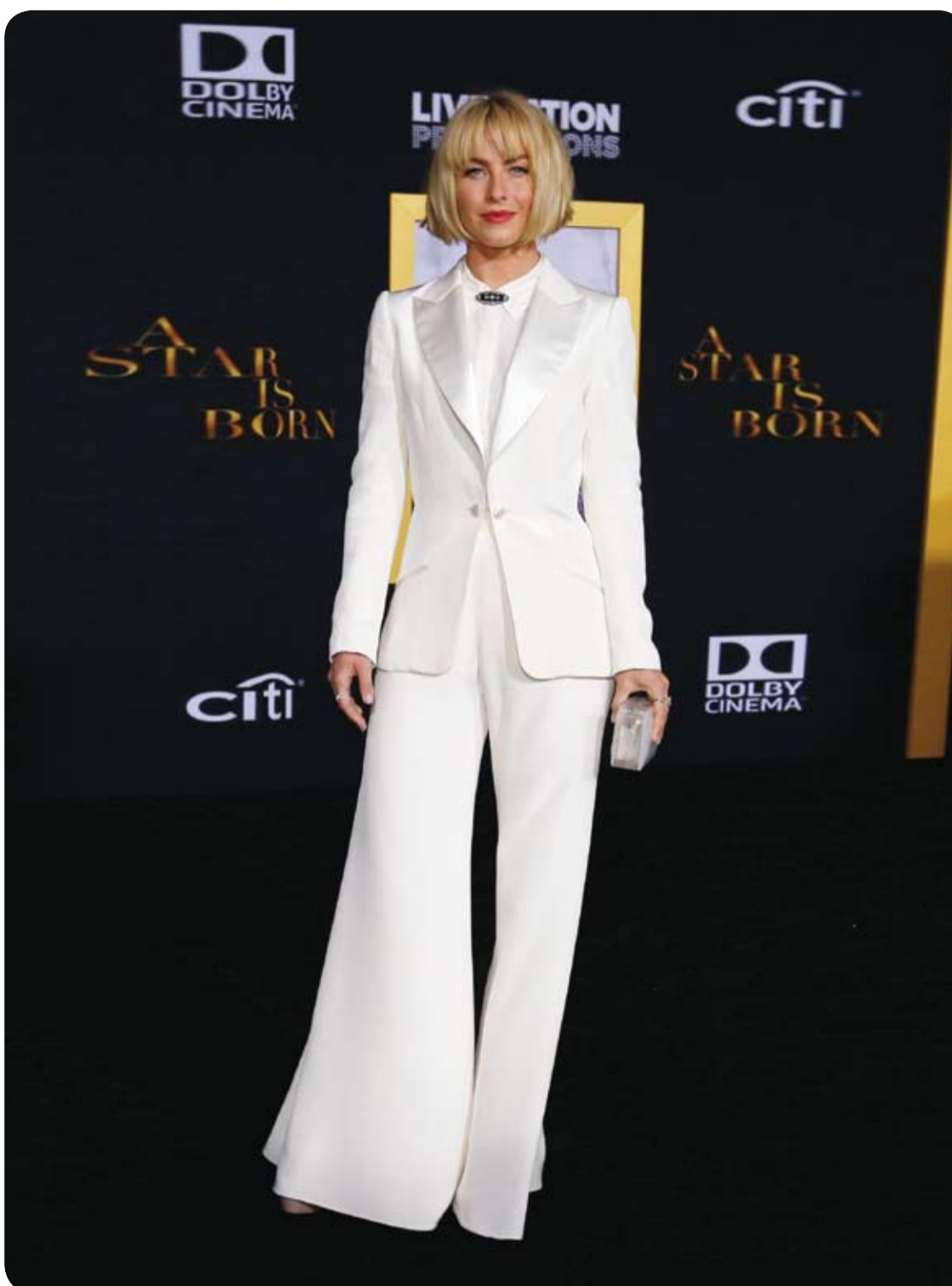
جوليان هوك لدى وصولها لحضور العرض الأول للفيلم (مولد نجم) في لوس أنجلوس، كاليفورنيا.

ونقلت عن "دي بيولا" قولها: "تعد دهون البطن القاتل الصامت، ويرتبط بعدد من المخاطر الصحية". ومضت "دي بيولا" تقول: "على الرغم من الطرق التي لا تعد ولا تحصى، والتي توصف بأنها تخفض الدهون في البطن (كشرب الشاي الأخضر، وتناول وجبات غنية بالبروتين، والصيام المتقطع)، إلا أن هناك نقصاً في الأدلة العلمية لدعم أي من هذه الادعاءات". وتابعت الصحيفة بقولها: "تصحب دي بيولا الذين يسعون إلى تقليل الدهون حول بطونهم باتباع نظام غذائي مهني على الأدلة يحافظ على صحة القلب، مثل اتباع نظام غذائي يعتمد على إيقاف ضغط الدم (DASH)، الذي طوره المعهد الوطني للشيخوخة". ولفتت الصحيفة إلى أن تلك الحميات تتكون عادة من كثير من الحبوب الكاملة واللحوم الخالية من الدهون والأسماك والفواكه والخضراوات ومستويات منخفضة من منتجات الألبان". كما توصي "دي بيولا" بتبني برنامج لإنقاص الوزن يتضمن نظاماً غذائياً صحياً مع تمارين منتظمة.