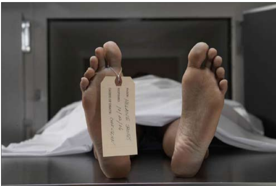
وصولاً إلى العظم خلال المرحلة الثالثة أو مرحلة التحلل، يتفكك الجلد بسبب

ازرقاق وتخشب وبرودة يشير ازرقاق الجثة أو الزرقة التالية للموت إلى النقطة التي يصبح فيها جسم الشخص الميت باهتا جداً أو شاحباً بعيد الوفاة. ويعود ذلك إلى خسارة الدورة الدموية مع توقف القلب عن النبض. يذكر غوف: (يبدأ الدم بالاستقرار، بفعل الجاذبية، في