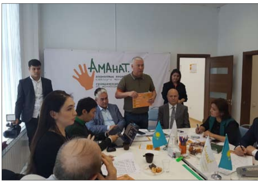
الخبير السياسي مورات كاشكومبايف يؤكد مساعدة (أمانات) للمرشحين والناخبين

ورداً على سؤال عن عدم انتشار تلك بعض اللامات وإن كانت قليلة نظراً لأن الاعتماد بشكل أكبر على وسائل التواصل الاجتماعي، مشيراً إلى أن اليوم هو يوم صمت انتخابي لكن الأيام السابقة كانت هناك أنشطة وفعاليات انتخابية مثيرة، مضيفاً: نحن استقبلنا حديثاً ومنذ ثلاثة عقود لم نعد على مثل هذه الانتخابات التعددية. وتحدث كاشكومبايف عن السيدة المرشحة للرئاسة مؤكداً أنها ليست حديثة العهد فقد بدأت العمل منذ سنوات عديدة ونحن فخورون بها وتجربتها، فهي ليست من نجوم المشاهير لكن لها باع في العمل وهي راغبة في خدمة وطنها مثلها مثل بقية المرشحين.