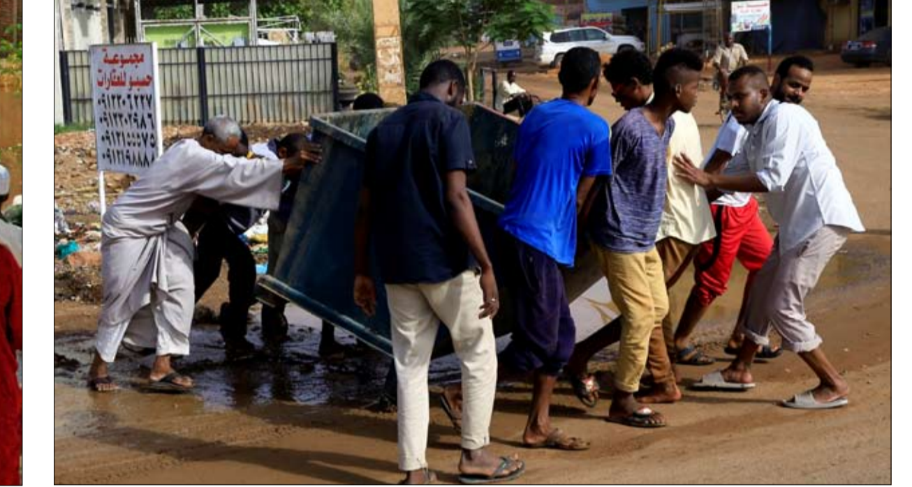
•• الخرطوم-أ ف ب:

على إبقاء النظام القائم. حالياً، يواجه الجنرالات في السودان ضغطاً يمارسه المجتمع الدولي للتحلي بسرعة عن الحكم. والجمعة، زار رئيس الوزراء الإثيوبي الخرطوم في محاولة لحل الأزمة وأطلق دعوة إلى الحوار. وكان الاتحاد الإفريقي في اليوم السابق، علّق عضوية السودان "إلى حين إقامة سلطة مدينة انتقالية بشكل فعلي". ورُحِبَ الاتحاد الأوروبي بهذه المبادرة. وكانت الأمم المتحدة وواشنطن ولندن وفرنسا نددت بحملة القمع ودعت إلى استئناف الحوار. وبعد أعمال العنف، رفض قادة