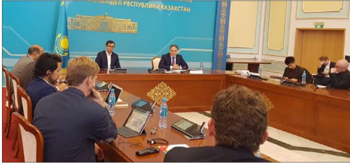
نائب وزير الخارجية يتحدث إلى وسائل الإعلام العالمية