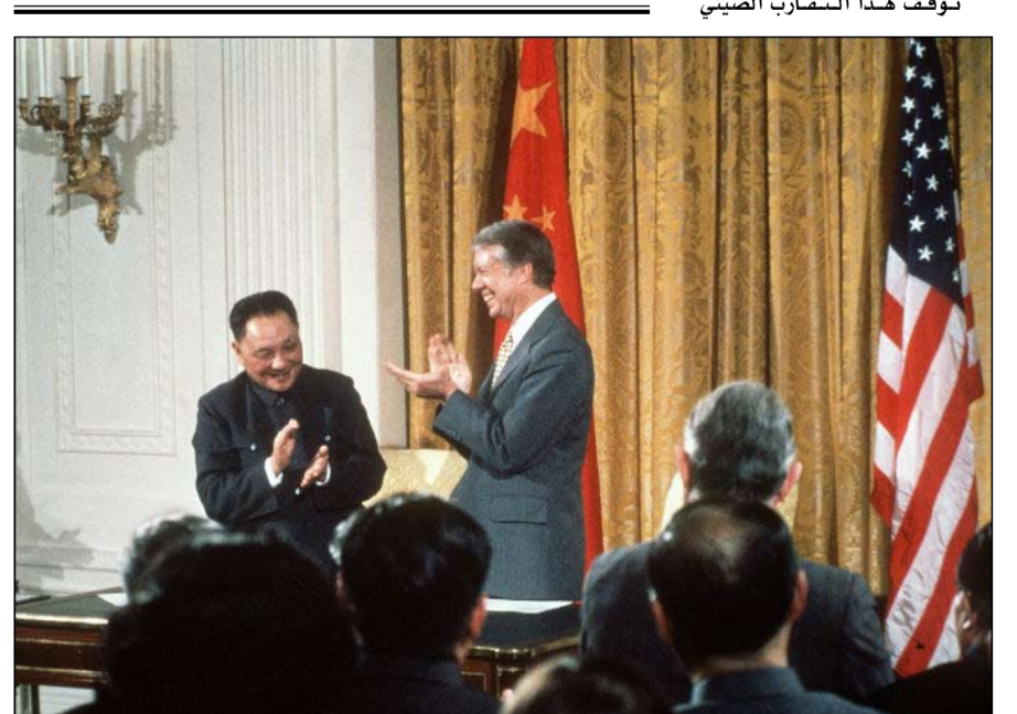
سنوات كارتر هي الاجمل