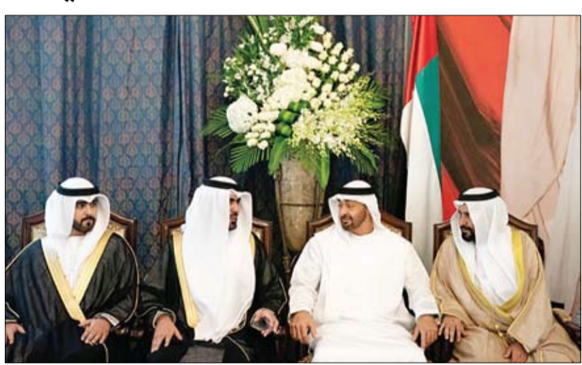
محمد بن زايد خلال حضوره أفراح ابن كردوس العامري

أبوظبي - وام: حضر صاحب السمو الشيخ محمد بن زايد آل نهيان ولي عهد أبوظبي نائب القائد الأعلى للقوات المسلحة أمس حفل الاستقبال الذي أقيم بمناسبة زفاف حمد ومنصور نجلى محمد سالم بن كردوس العامري على كريمتي حمد سالم بن كردوس العامري في نادي ضباط القوات المسلحة بأبوظبي. وهنا سموه العريسين وذويهما بهذه المناسبة متمنيا لهما حياة أسرية سعيدة هانئة ومستقرة وتخلل حفل الاستقبال - الذي حضره جمع من الشيوخ والدعويين وأقارب وأهل العريسين - عروض من الفنون الشعبية الإماراتية واللوحات والأمازيج التراثية.