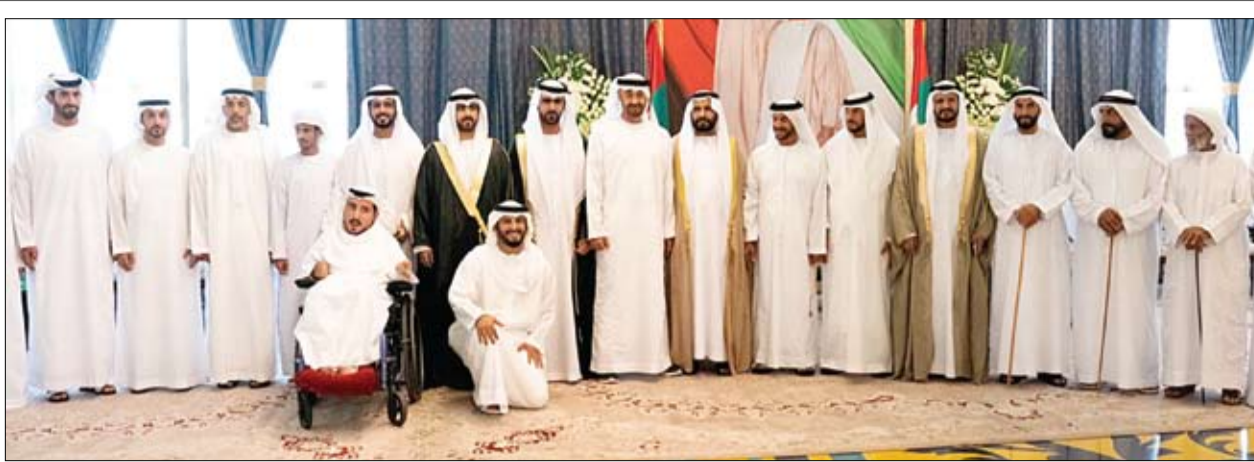
محمد بن زايد خلال حضوره أفراح ابن كرددوس العامري في أبوظبي (وام)