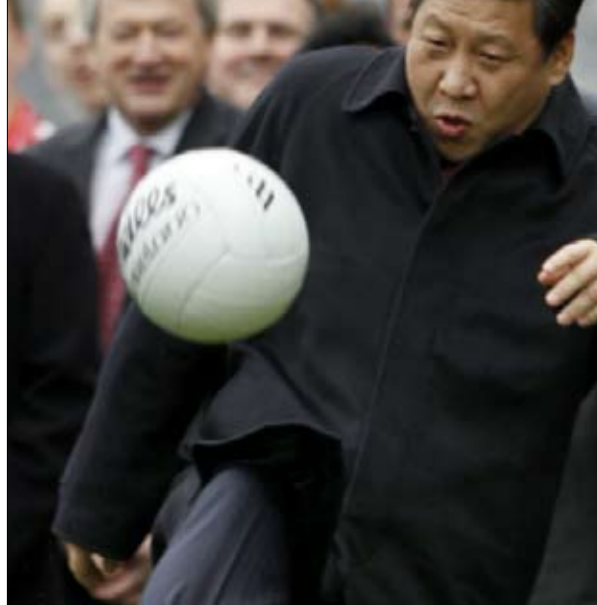
لم تلعب الصين بشكل عادل مع الامريكاني

بكين في وضع صعب يواجه حكما للصين في الأونة الأخيرة صعوبات أخرى عليهم إدارتها. عام 2018، كان نمو الناتج