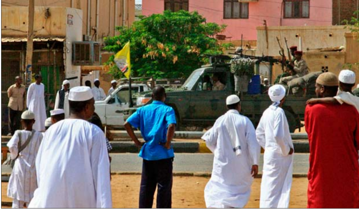
السلطة إلى المدنيين وسقوط المجلس العسكري.

إلا أن حركة الاحتجاج التي انطلقت عقب قرار الحكومة رفع سعر الخبز ثلاثة أضعاف، تأمل في استنهاض حركتها. وقد دعا قادتها إلى مواصلة "الثورة" و"العصيان المدني" و"التجمعات السلمية، ويرى مراقبون أن هناك خطر حقيق من أن ينزل الوضع إلى حرب أهلية. بعد ثلاثة أيام على فض الاعتصام، أعادت بعض المحال التجارية فتح أبوابها في الخرطوم. ووقف السودانيون من جديد في طوابير أمام المراكز التجارية في بلد يعاني من نقص في كل المواد ومن اقتصاد ضعيف ومعدّل تضخم متزايد. والجمعة، عادت بعض السيارات إلى الحركة في الشوارع الرئيسية من العاصمة السودانية التي كانت تخرج بيضاء من السبات الذي غرقت فيه جراء أعمال العنف.