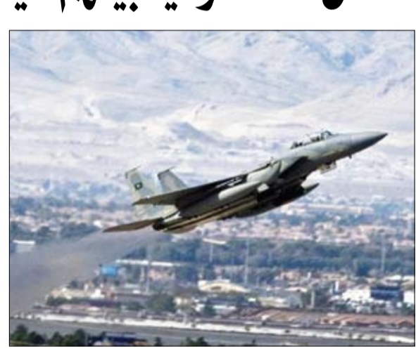
غارات التحالف تلحق خسائر فادحة بالمليشيات الحوثية

وأشارت المصادر إلى أن غالبية قتلى الضربة الجوية من قيادات ومليشيا الحوثي ينحدرون من مديرية أفلح الشام بمحافظة حجة. هذا وأحبطت القوات الأمنية المشتركة والحزام الأمني في اليمن، السبت، هجوما نفذته مليشيات الحوثي الموالية لإيران، على مواقعها في جبهتي مريس