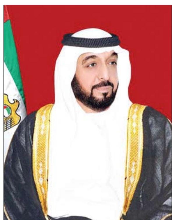
إلى صاحب السمو الشيخ صباح الأمير الجابر الصباح

أبوظبي - وام: بعث صاحب السمو الشيخ خليفة بن زايد آل نهيان رئيس الدولة "حفظه الله" برقية تعزية إلى صاحب السمو الشيخ صباح الأحمد الجابر الصباح أمير دولة الكويت بوفاة السيدة وضحة علي عبدالرحمن المنير والدة سمو الشيخ جابر المبارك الحمد الصباح رئيس وزراء دولة الكويت الشقيقة أعرب خلالها عن خالص مواساته في الضيقة راجيا الله تعالى أن يتغمدها بواسع رحمته وأن يسكنها فسيح جناته. كما بعث صاحب السمو الشيخ محمد بن راشد آل مكتوم نائب رئيس الدولة رئيس مجلس الوزراء حاكم دبي "رعاه الله" وصاحب السمو الشيخ محمد بن زايد آل نهيان ولي عهد أبوظبي