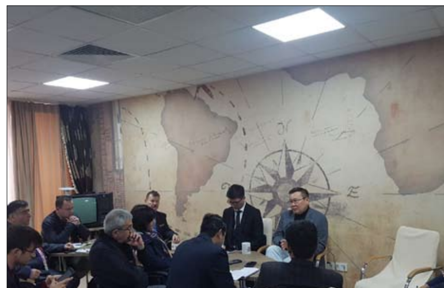
الخبير السياسي تالجات كاليب يتعترض ظروف أجواء الانتخابات

وأصبحنا جزءاً من طريق الحرير، وبنينا دولتنا لتصبح في مصاف الدول المتقدمة خلال وقت قياسي، واستطعنا تطوير اقتصادنا وتنويع مصادره، وجذب حوالي 300 مليار دولار من الاستثمارات الأجنبية المباشرة وتبوأنا المركز 28 من بين الدول الأكثر تنافسية في العالم، كما تم رفع مستوى معيشة المواطن الكازخي، حيث كان نصيب الفرد من الناتج القومي في بداية التسعينات لا يزيد عن 700 دولار وبعد سنوات من العمل الجاد ارتفع إلى 13 ألف دولار غير أن أزمة الاقتصاد العالمي أثرت على سعر صرف العملة الكازاخية بشكل كبير، وعلى الرغم من ذلك فإن نصيب الفرد من الناتج الإجمالي حالياً يبلغ 9000 دولار وهو يعد إنجازاً في ظل الظروف العالمية وانخفاض أسعار النفط، مشيراً إلى أن النهضة الكبيرة التي شهدتها البلاد لم تقتصر على المجالات الاقتصادية، بل شملت أوضاع المجتمع المدني كلها، ففي الماضي كانت وسائل الإعلام في كازاخستان كلها حكومية أما الآن فلدينا 3200 وسيلة إعلامية مستقلة.