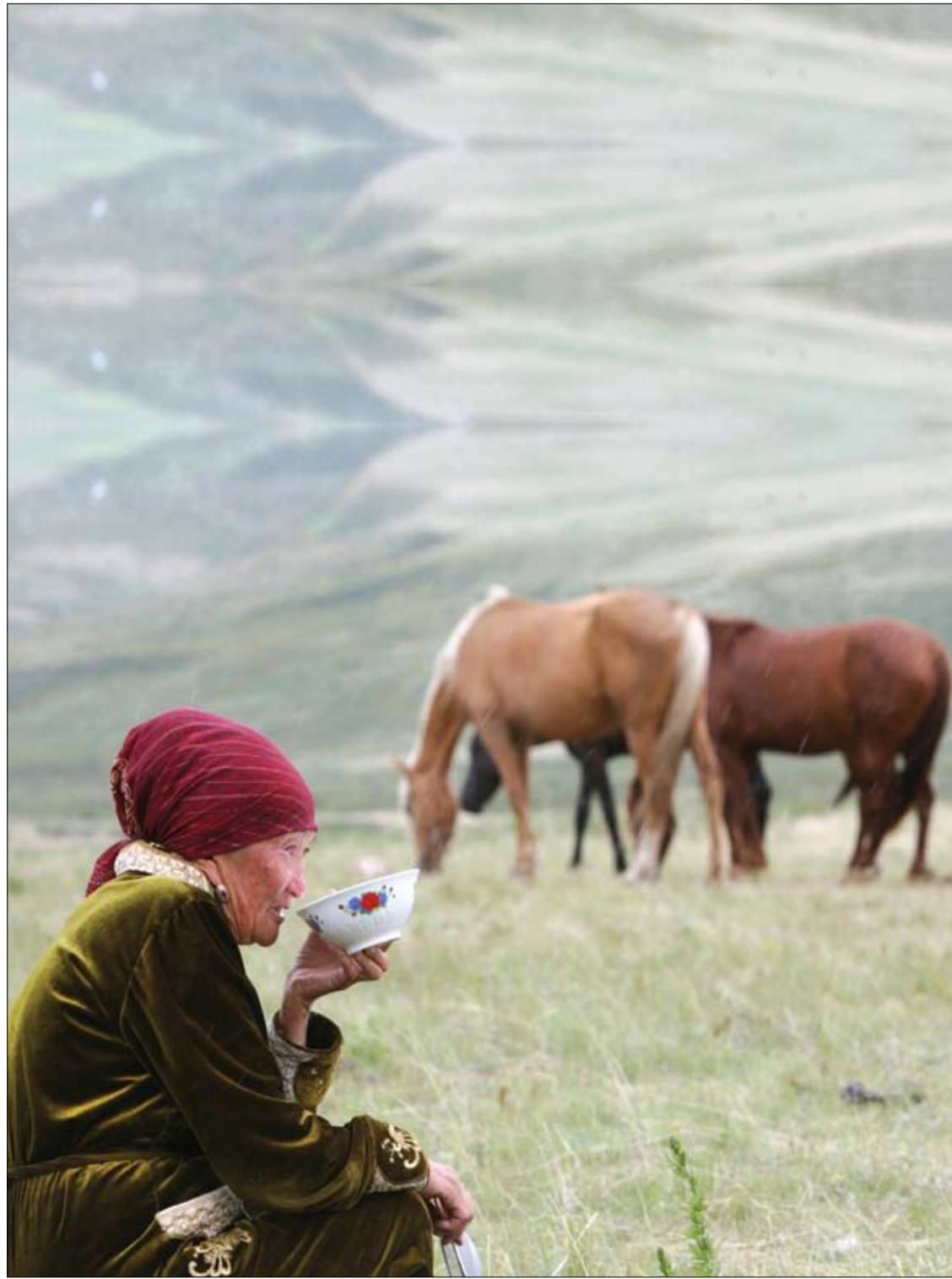
امراة قيرغيزية تشرب حليب الخيل في مرعى صيفي، على بعد حوالي 170 كيلومترا، 106 ميلا جنوب العاصمة بيشكيك

وتقول مايو كلينك: "حدد موعدا مع طبيبك إذا كان لديك أي علامات أو أعراض مستمرة تثير قلقك. وإذا لم تكن لديك أي علامات أو أعراض، ولكنك قلق بشأن خطر إصابتك بالسرطان، فناقش مخاوفك مع طبيبك. واسأل عن اختبارات وإجراءات فحص السرطان المناسبة لك". وتظهر الأبحاث أن أشياء مثل التوقف عن التدخين والحفاظ على وزن صحي يمكن أن تقلل من خطر الإصابة بالسرطان.