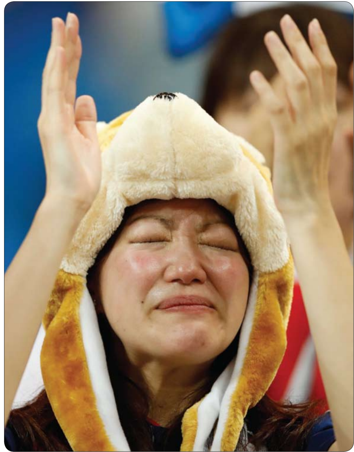
مشجعة يابانية تبكي عقب خروج منتخب بلادها من كأس العالم بعد هزيمته أمام منتخب بلجيكا بثلاثة أهداف مقابل هدفين. (ا ف ب)

تعتبر حرقة المعدة من أكثر المشاكل الصحية التي تعاني منها المرأة أثناء الحمل، وتقول الدراسات إن 8 من أصل 10 نساء تتطور لديهن حرقة المعدة على مدى أشهر الحمل. ورغم أنها غير ضارة في الأساس، إلا أنها تمثل إزعاجاً مستمراً للمرأة الحامل، وقد تكون مؤلمة في بعض الحالات. وللتخلص من أعراض حرقة المعدة أوردت صحيفة ميرور البريطانية عدداً من النصائح المفيدة في هذا الخصوص: 1- اختاري أطعمة ومشروبات سهلة الهضم، وتجنبي الأطعمة التي تحتوي على البهارات والتوابل الحارة، والشوكولاته والحمضيات، والقهوة. 2- تناولي وجبات عديدة وكميات قليلة لسهولة الهضم. 3- إن كنت من المدخنين، حاولي أن تقلعي عن التدخين للتخفيف عن الصمام بين المعدة والمريء. 4- تجنبي الانحناء قدر المستطاع لأنه يجعل حموضة المعدة أكثر سوءاً. 5- إن كانت حرقة المعدة تشتد في الليل، حاولي تجنب تناول أي وجبة قبل الخلود للنوم. 6- عند خلوك للنوم وضعي وسادة إضافية تحت رأسك لأن الجاذبية تساعد في إرجاع الحموضة إلى الأسفل.