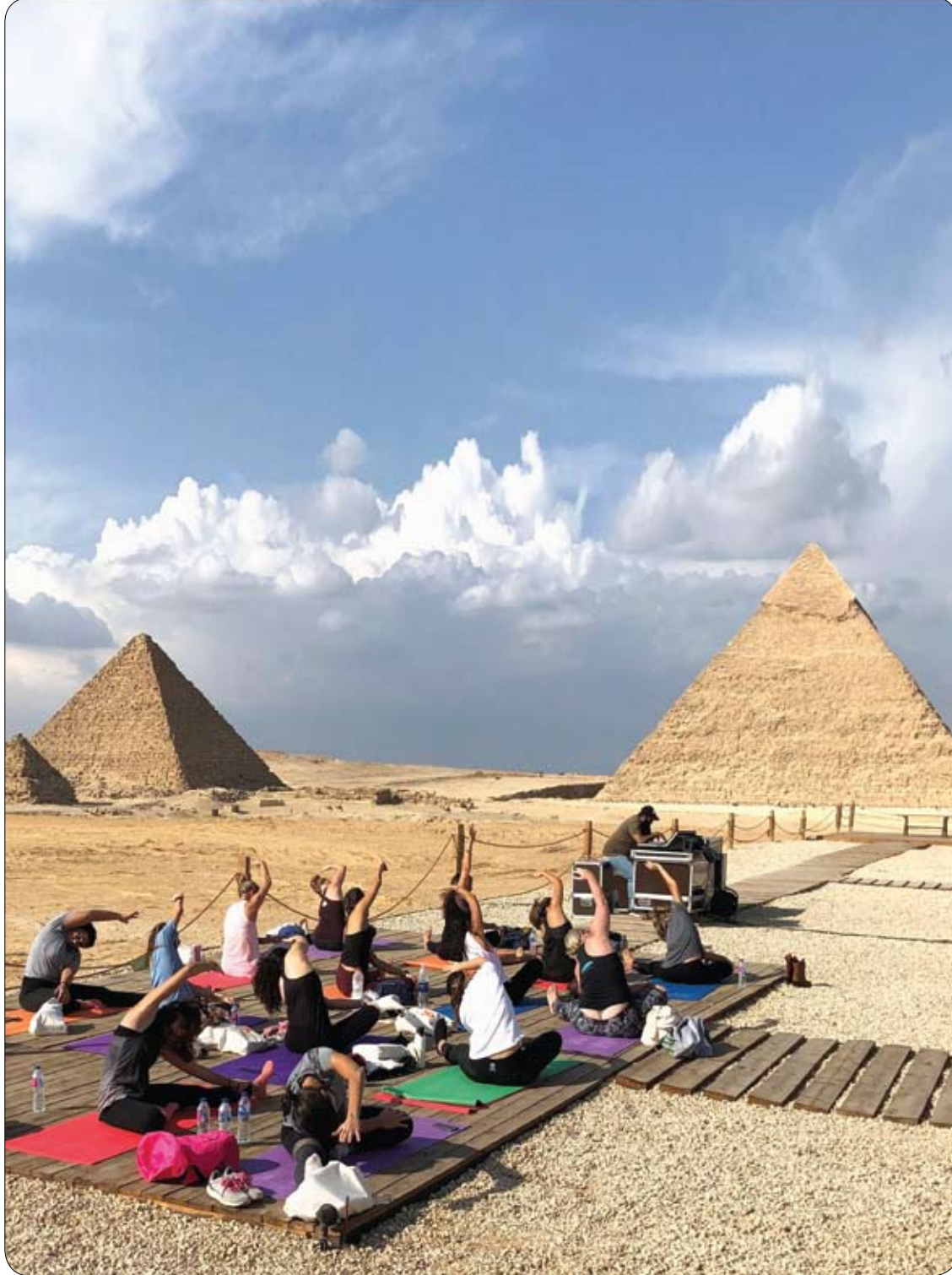
نساء يحضرن فعالية «نعم يوم اليوجا» لدعم القضاء على العنف ضد المرأة أمام أهرامات الجيزة التاريخية.

وبنهاية التجربة، شهدت المجموعة التي تناولت فيتامين E، نمواً متزايداً للشعر بنسبة 34.5%، في حين أن مجموعة العلاج الوهمي شهدت انخفاضاً في الشعر بنسبة 0.1%.