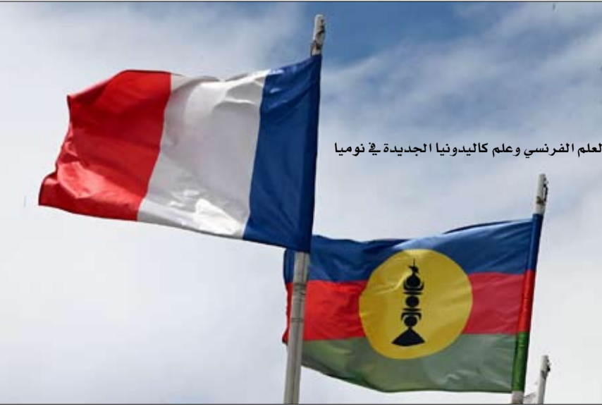
العلم الفرنسي وعلم كاليديونيا الجديدة في نومييا