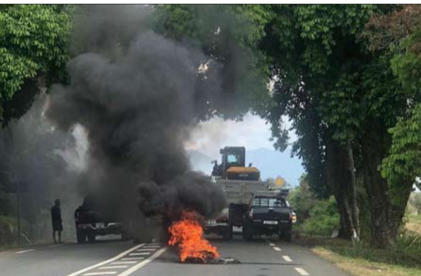
تأمين الاستقرار ضرورة لرسم مستقبل الأرخبيل