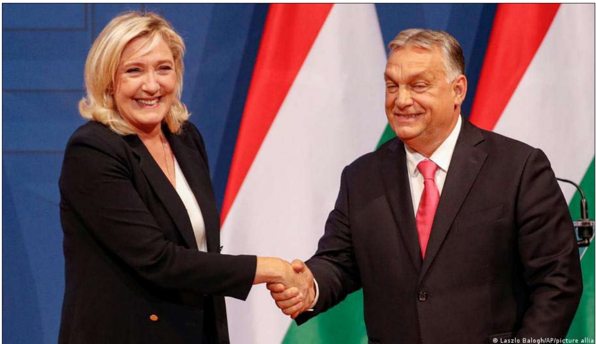
مارين لوبان سبقت منافسها ماكرون الى المجر