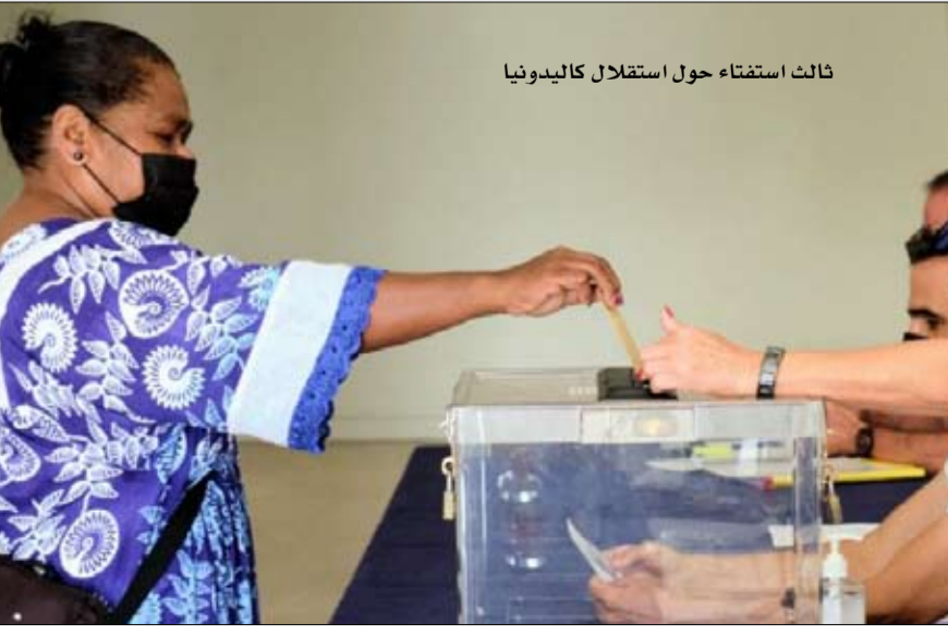
ثالث استفتاء حول استقلال كاليديونيا