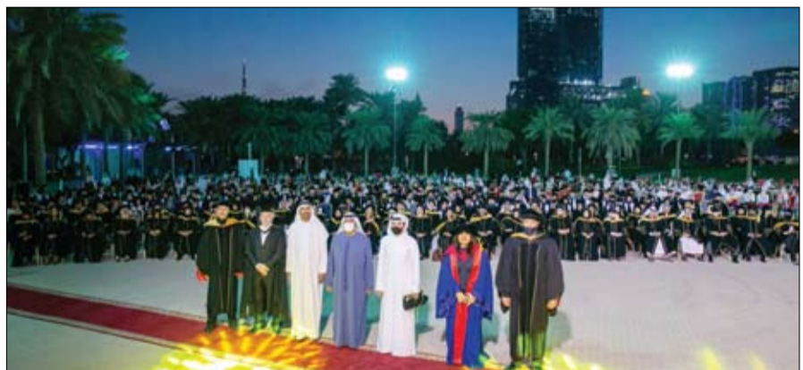
مكتبة أكسبو 2020 دبي للتعليم العالمي على الأبحاث ، كما تلعب دوراً رائداً في تحفيز التنمية واقتصاد القائمة على المعرفة في المنطقة وخارجها.

المجال. واستعرضت سعادة حنان أهلي خلال الاجتماع مستجدات أداء الدولة في التقارير العالمية وما حققته من إنجازات خلال السنوات الماضية لتعزيز التنافسية التحسينية في ملف التوازن بين الجنسين مؤكدة أن هناك فرصة كبيرة لتحقيق تقدم أفضل في تقرير المساواة بين الجنسين الصادر عن برنامج الأمم المتحدة الإنمائي. وقالت إن فريق عمل المركز الاتحادي للتنافسية والإحصاء سيعمل على إعداد خطة عمل لتحقيق ذلك ضمن جهود الداعمة لبيانات المرأة والتقارير العالمية الأخرى والتواصل بشأن منهجيات ومشاريعها والتعريف بإنجازات الدولة ومكتسبات المرأة على أرض الواقع. وقدمت سعادة هدى الهامشي عرضاً للنتائج الأولية لأشهر التوازن بين الجنسين لعام 2020 على مستوى الحكومة الاتحادية وفق إطار القياس المعتمد حالياً والذي يشتمل على 3 محاور رئيسية هي: صناعة القرار والتعليم والخبرة وبيئة العمل مع مقترحات بإضافة محور آخر سيتم دراستها في الفترة المقبلة ليشمل المؤشر نطاقاً أوسع في الدورات القادمة بحيث يتم تطبيقه على مستوى الحكومات المحلية وقطاعات أخرى إضافة لفئة القطاع المصرفي التي تم إضافتها في الدورة الماضية. واستعرضت سعادة شمسة صالح خلال الاجتماع مجموعة المبادرات والأنشطة الرئيسية التي يشارك بها مجلس الإمارات للتوازن بين الجنسين في أكسبو 2020 دبي والتي شملت إلى الآن توقيع مذكرة تفاهم مع المجلس مع المنظمات الدولية صاحبة الدعامات للنوع الاجتماعي وبما يساهم في الارتقاء بمرتبتي الدولة في المؤشرات العالمية والوصول لها وأن يكون الظلة الرئيسية