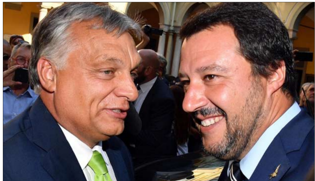
يحلم المجرى بتحالف كبير من المشككين في الاتحاد الأوروبي

يجب أوربان وماكرون الظهور كعمازين، لكن غالباً ما ينتهي بهما الأمر في الجانب نفسه في بروكسل