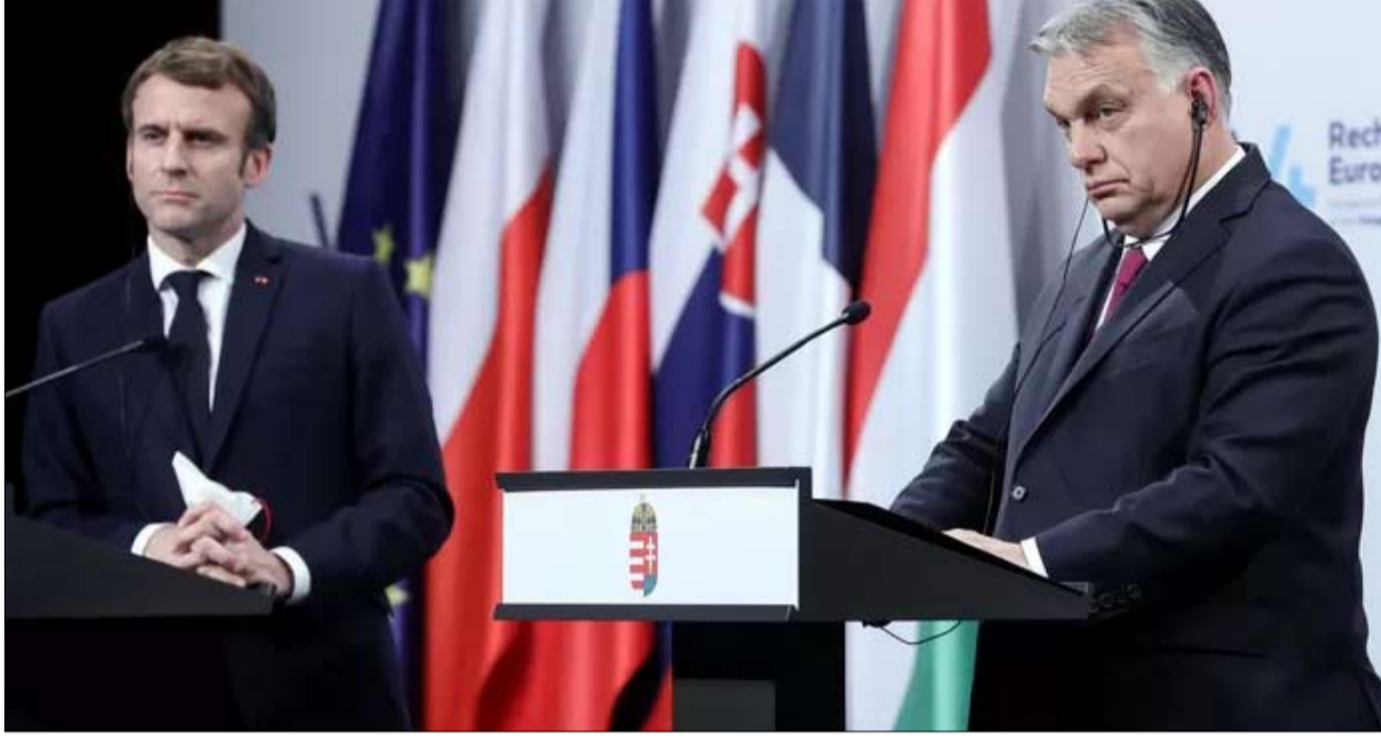
زيارة متعددة الرسائل