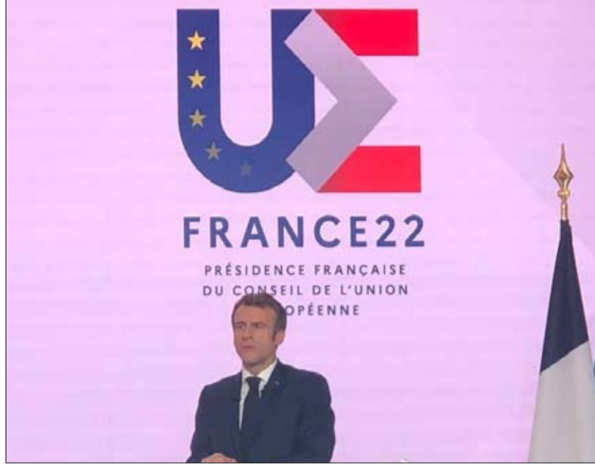
الرئاسة الفرنسية لأوروبا ما بعد ميركل والبريكست تحتاج للمجر

خلال السباق على الانتخابات القارية في مايو 2019، تبادل ماكرون وأوربان إطلاق النار على طريقة الوستارن. وفي بداية شهر يوليو 2018، قدر الرئيس الفرنسي أن "الحدود الحقيقية لأوروبا" هي تلك التي تفصل "التقدميين" عن "القوميين" من عيار أوربان. وبعد ثلاثة أسابيع، أعلن المجرى لصحيفة بيلد اليومية الألمانية، أنه لا يريد أوروبا "تحت الزعامة الفرنسية".