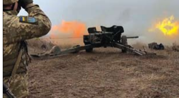
القوات المسلحة الأوكرانية تجري مناورات مدغمية في ميدان رماية في شرق أوكرانيا

المغرب يجب بالتعاون مع واشنطن هجوما إرهابيا لداعش