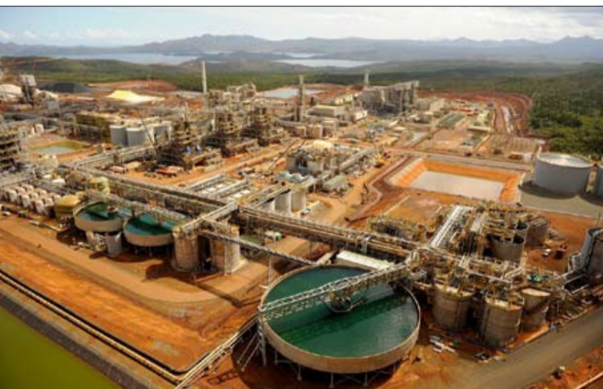
النيكل يسيل لعباب الصين