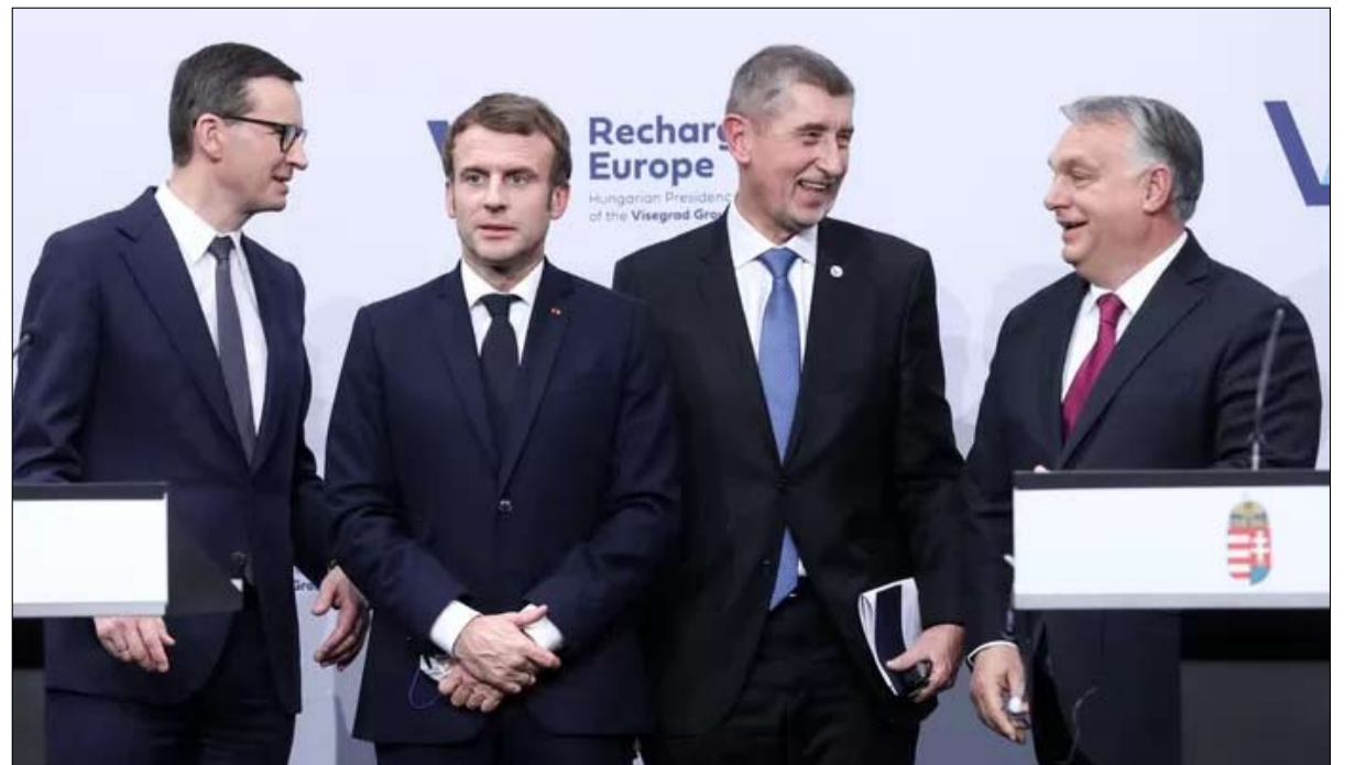
عقد الرئيس الفرنسي قمة مع قادة دول مجموعة فيسيفراد