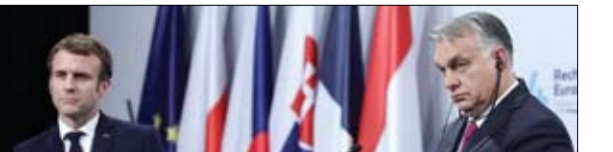
زيارة متعددة الرسائل

قال تقرير بريطانيا ودول مجموعة السبع الأخرى هذا الأسبوع موسكو من عواقب وخيمة إذا غزت أوكرانيا، لكن رئيس الوزراء بوريس جونسون قال، الجمعة، إن بلاده ستلجأ إلى كل إمكاناتها الدبلوماسية والاقتصادية "في مواجهة أي عدوان روسي." وقال الاسبوع للجمعية في مقابلة هذا الأسبوع إن كيف ليست عضواً في حلف شمال الأطلسي (ناتو) لذا ورهض الرئيس الأمريكي