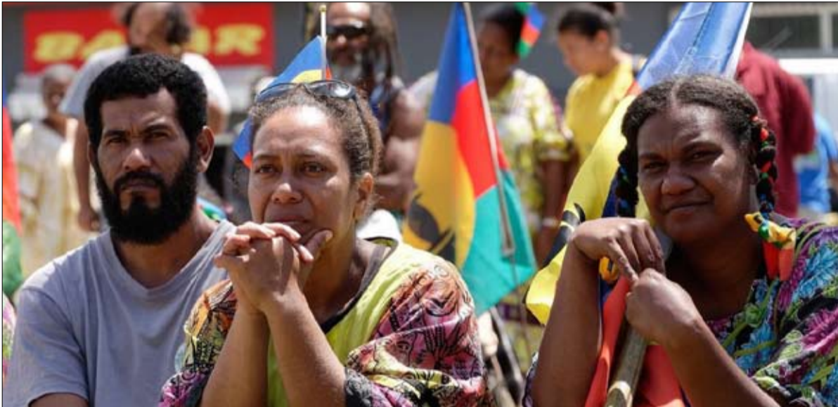
اجتماع عام لجبهة التحرير الوطني كانك الانفصالية

الجغرافية، تقع كاليديونيا الجديدة في مقدمة سور مواجه للنفوذ الصيني في المحيط الهادي.